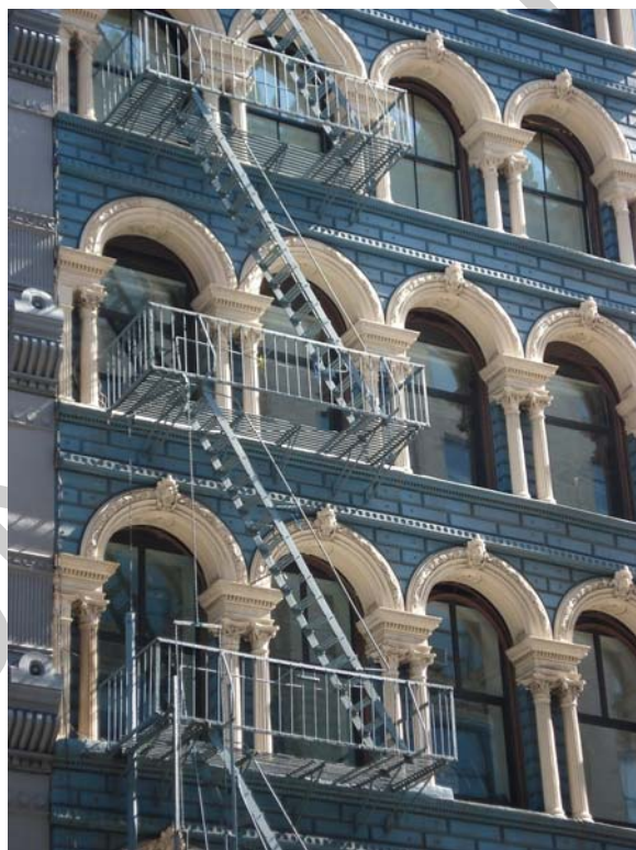
8. ábra. Tűzlépcső 8

Szükséges a menekülés lehetővé tétele (pl. vészkijáratok nyitása, liftek földszintre hívása és kikapcsolása, a liftben rekedt személyek kimentése), életmentés, a közművek lezárása (áramtalanítás, gázlezárás), technológiai folyamat leállítása, a tűz által veszélyeztetett vagy a tűz terjedését elősegítő anyagok eltávolítása, a tűz oltása (ha az biztonságosan megoldható).