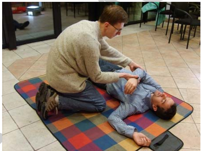
1. ábra. stabil oldalfekvés lépései 1-2