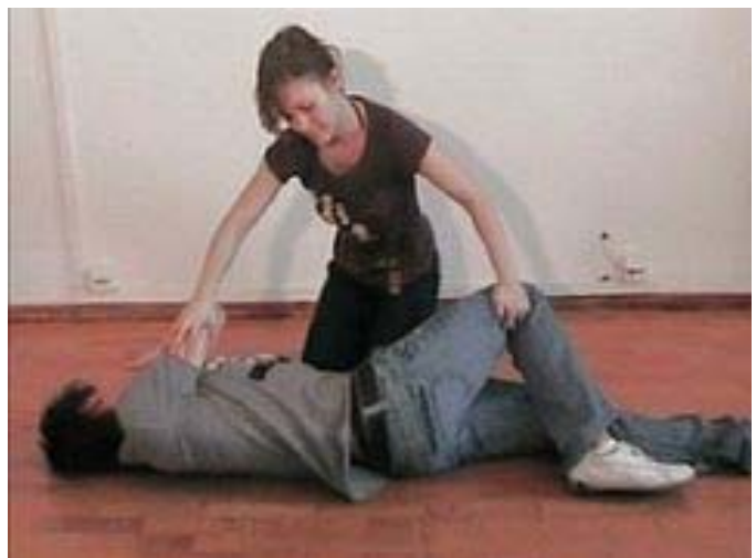
2. ábra. stabil oldalfekvés lépései 3-4