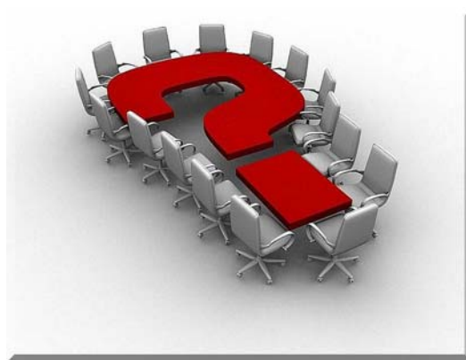
4. ábra. Vállalkozások kapcsolatrendszere 3

Napjainkban a vállalkozó fogalma kibővült, ide kell érteni az egyéni vállalkozót, aki egy személyben vállalatvezető, üzletember és újító is. Tágabb értelemben ide tartoznak a társas vállalkozások, a gazdasági társaságok is.