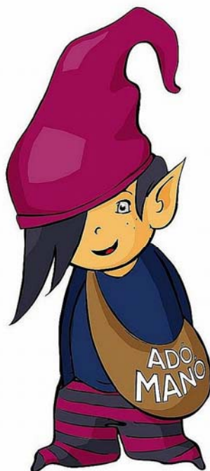
14. ábra. Adómanó 9

Az egyéni vállalkozók által fizetett járulékok (egészségügyi hozzájárulás (EHO), egészségbiztosítási alap, nyugdíjbiztosítási alap stb..) folyamatosan változik nevük és összegszerűségük is, tehát ennek mindig utána kell nézniük, hogy a járulékok tekintetében mindig objektív képet kapjanak.