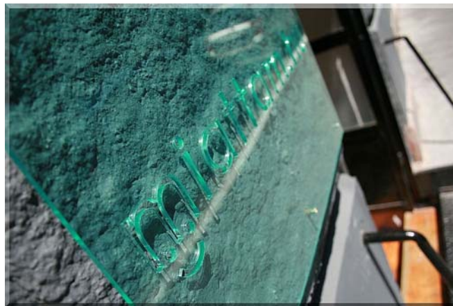
6. ábra. Szépségszalonn bejárata

Ezekből levezethetők a vállalati érdekszerkezet fő összetevői: