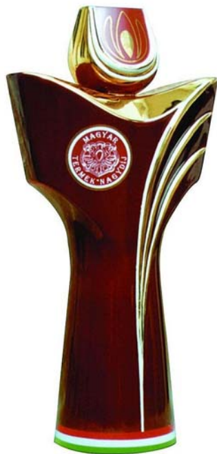
16. ábra. Magyar Termék Nagydíj 10

Gazdasági társaságot üzletszerű közös gazdasági tevékenység folytatására külföldi és belföldi természetes és jogi személyek, jogi személyiség nélküli gazdasági társaságok egyaránt alapíthatnak, működő ilyen társaságba tag-ként beléphetnek, társasági részesedést (részvényt) szerezhetnek.