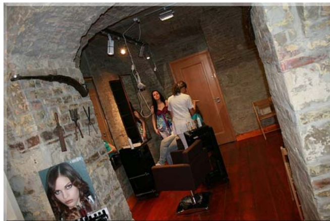
2. ábra. Szépségszalón fodrász része

Rajtunk múlik, hogy ezen döntés hogyan határozza meg vállalkozásunk sikerét! 1