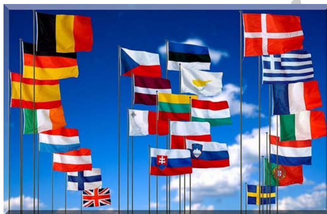
8. ábra. Az Európai Unió országainak nemzeti lobogói 6

Az Európai Parlament és a Tanács 2006. december 12-i 2006/123/EK irányelve a belső piaci szolgáltatásokról