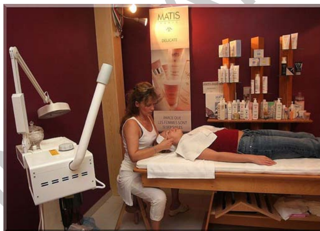
11. ábra. Kozmetikai szalon

Az egyéni vállalkozónak a gazdasági tevékenysége során az „egyéni vállalkozó” megjelölést (vagy annak e.v. rövidítését) és nyilvántartási számát neve (aláírása) mellett minden esetben köteles feltüntetni.