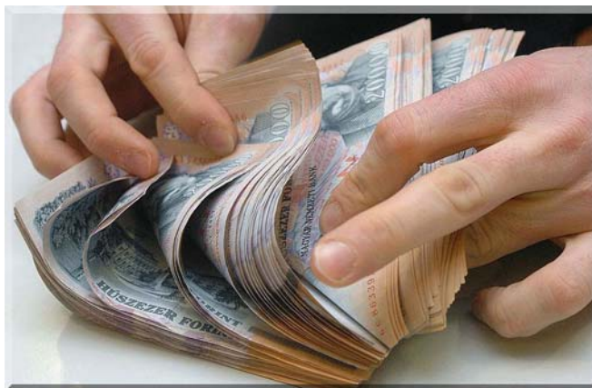
15. ábra. Pénz

Fontos! A fenti információk tájékoztató jellegűek, mindenképp kérje ki egy könyvelő tanácsát, aki személyre szabott, speciális szaktanácsadást tud Önnek nyújtani.