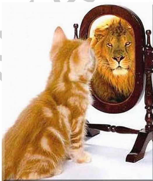
19. ábra. Az "egészséges" önbizalom 13