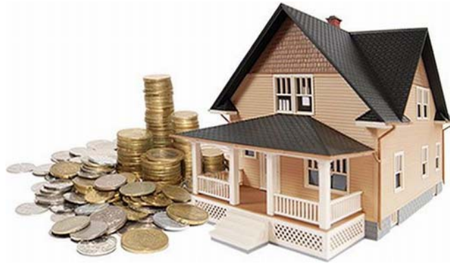
3. ábra. Családi költségvetés 2

Ekkor léptek színre a kockázati tőkével azok a pénzemberek, akik tőkéjük egy részét kockázatos vállalkozásokba fektették, azért hogy ezek egy részétől magas megtérülési hányadban részesüljenek. (Tisztában kell lenni a ténnyel, hogy a kockázati tőkebefektetések egy része vagy egyáltalán nem vagy csak nagyon rossz hatékonysággal térül meg.)