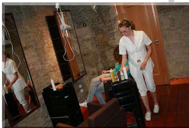
13. ábra. Fodrász szalon