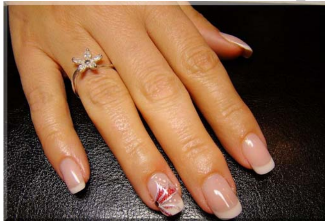
12. ábra. Francia műköröm díszítés 8

Az egyéni vállalkozó szünetelés tartama alatt nem végezheti az egyéni vállalkozói tevékenységet, nem szerezhethet egyéni vállalkozói tevékenységhez kötődő új jogosultságot, nem vállalhat új kötelezettséget, azonban tevékenységének folytatása során a szünetelésig keletkezett és azt követően esedékessé váló fizetési kötelezettségeit a szünetelés ideje alatt is köteles teljesíteni.