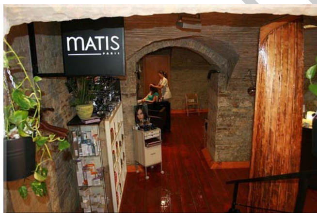
1. ábra. Szépségszalon

Egy saját vállalkozás elindítása előtt fontos, hogy tisztában legyünk a különböző vállalkozási formák előnyeivel és hátrányaival fodrász, kozmetikus, kéz- és lábápoló, műkörömépítőként egyaránt. Ha ismerjük az egyes formákkal járó jogokat és kötelezettségeket, könnyebben ki tudjuk választani azt a formát, ami leginkább passzol a beindítani kívánt vállalkozáshoz