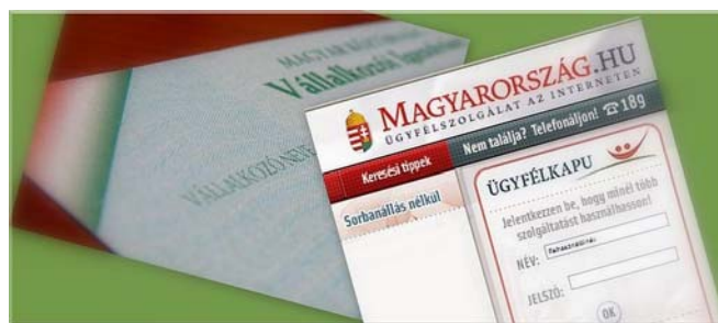
10. ábra. Ügyfélkapu 7

Az elektronikus ügyintézés során nincs szükség különböző igazolások, dokumentumok (pl. képesítést igazoló bizonyítvány) bemutatására. Az ügyfeleknek csupán nyilatkozniuk kell bizonyos kérdésekről, az ellenőrzés utólag történik.