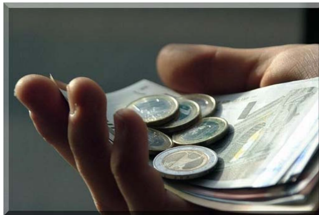
5. ábra. Vállalkozások pénzügyei 4

Az üzleti vállalkozások létrejöttét és elterjedését elősegítette a pénzügyi elszámolások elterjedése (pénz nélkül ugyanis elképzelhetetlen az eredmény megállapítása, a kockázat értékelése és racionális gazdasági döntések meghozatala), a hitelezés kialakulása, és a cég vagyonának elkülönülése a résztvevők személyi vagyonától. Ebben a folyamatban alakult ki a tőke.