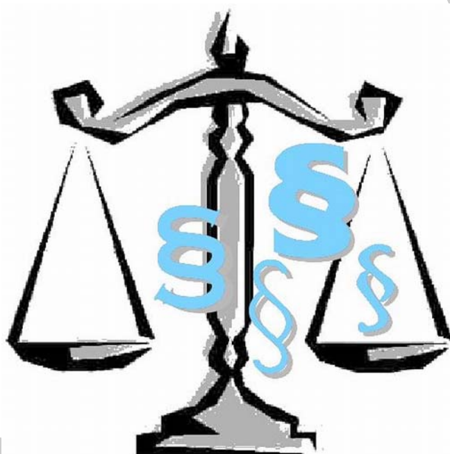
7. ábra. Mérlegen a jogszabályok 5

Az egyéni vállalkozás és a gazdasági társaságok működését jogszabályok: törvények és kormányrendeletek szabályozzák.