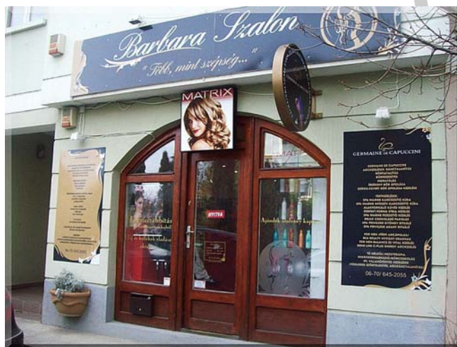
5. ábra. Szépségszalon cégtáblával

A cég székhelye a cég bejegyzett irodája. A bejegyzett iroda a cég levelezési címe, az a hely, ahol a cég üzleti és hivatalos iratainak átvétele, érkeztetése, őrzése, rendelkezésre tartása, valamint ahol a külön jogszabályban meghatározott, a székhellyel összefüggő kötelezettségek teljesítése történik. A cégnek a székhelyét cégtáblával kell megjelölnie.