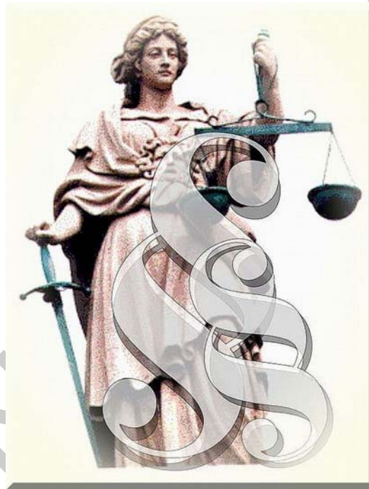
1. ábra. Justitia 1

A három szépségipari tevékenység a fodrászat a kozmetika és a kéz és lábápolás, műkörömépítés Szakmai és vizsgakövetelményeiknek közös modulja a szépsészeti szolgáltatóegység üzemeltetése, melyen belül foglalkozunk a vállalkozásformákkal, azok szabályozóival, betartandó jogszabályokkal.