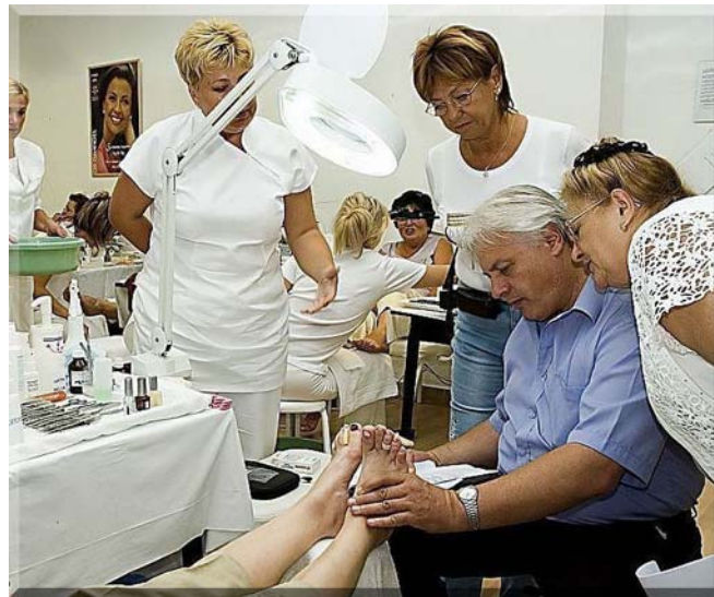
6. ábra. Bérelt tanműhely 4

A használat jogosságát több féle okirat igazolhatja, ilyenek lehetnek: a székhelynek (telephelynek) helyt adó ingatlan tulajdonosával, bérleti szerződéssel kötött bérleti szerződés, használati szerződés, amely kifejezetten tartalmazza, hogy az érintett ingatlan címe a cégnyilvántartásba székhelyként, vagy telephelyként bejegyezhető. A használat jogosságát nem csak cégalapításkor, hanem azt követően bármikor igazolni kell.