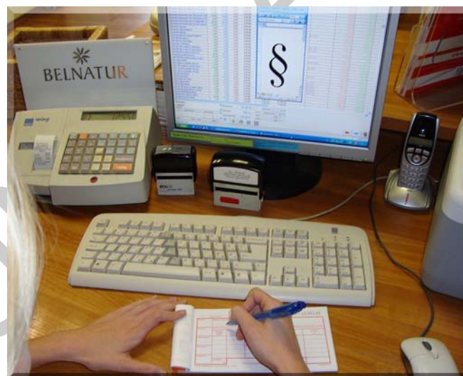
2. ábra. Szépségipari vállalkozás

A képesítés megszerzése után büntetőjogi felelősséggel tartoznak a munkájukért és ezt vegyék nagyon komolyan!