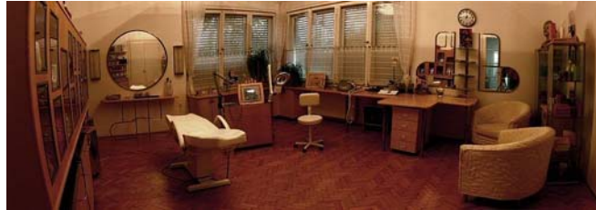
6. ábra. Kozmetikai szalon

Természetes személy csak egy egyéni vállalkozást alapíthat, de a vállalkozása idején gazdasági társaságnak lehet korlátolt felelősségű tagja is.