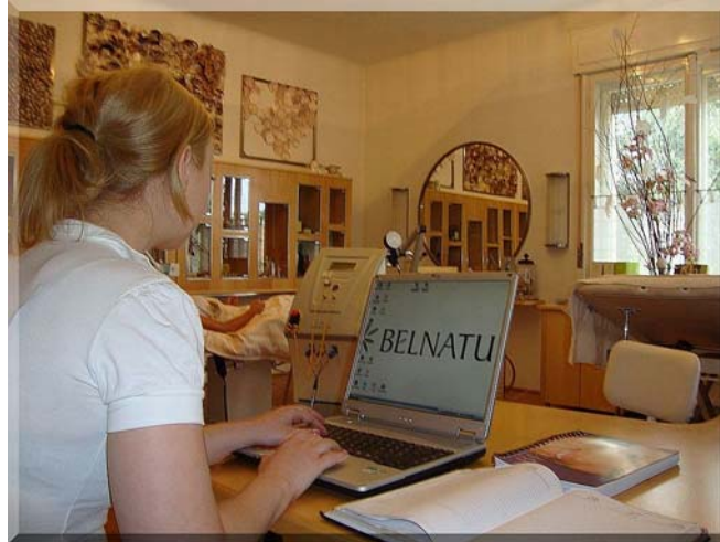
2. ábra. Egyéni vállalkozási formában működő kozmetikai szalon 2

Érdemes átgondolni, hogy a tevékenységre legalább a rálátáshoz, a körültekintő döntésekhez szükséges mértékben értsen és ismerje a reá vonatkozó jogszabályokat!