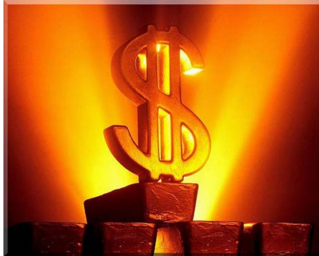
8. ábra. Az "ideális" befektetés módja, amelyhez nem kell bankszámla