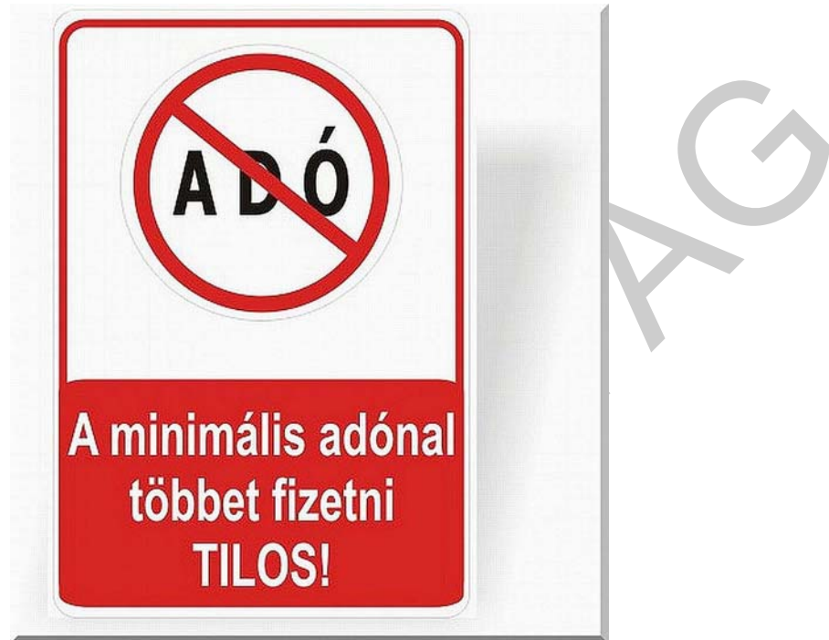
11. ábra. A minimális adónál többet fizetni TILOS!

Az egyéni vállalkozó társadalombiztosítási járulékának mértéke 27%, ebből nyugdíjbiztosítási járulék 24%, egészségbiztosítási- és munkaerő piaci járulék 3%. A bérből levont járulékok 9,5 % nyugdíjjárulék és 7% egészségbiztosítási járulék, amit szintén a vállalkozónak kell befizetni önmaga és az alkalmazottja után is.