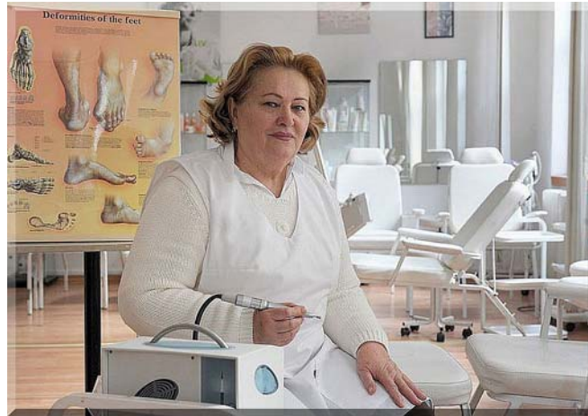
13. ábra. Sikeres kéz- és lábápoló, műkörmépítő vállalkozó