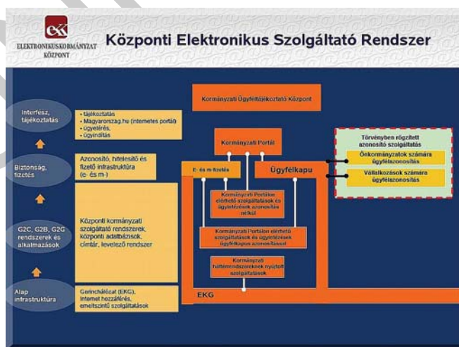
4. ábra. Központi Elektronikus Szolgáltató Rendszer felépítése 3

A bejelentést természetesen elektronikus bejelentőlapon kell megtenni. (10T180 nyomtatvány) Ez az okmányiroda ügyfélszolgálatán ügyintézői segítséggel is történhet. Amennyiben a bejelentés hiba nélkül megtörtént, úgy a hatóság automatikusan beszerzi az egyéni vállalkozó adószámát és statisztikai számjelét.