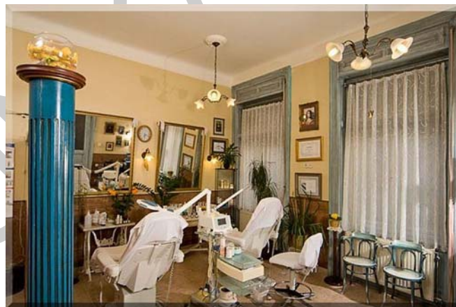
1. ábra. Kozmetikai szalon 1

A három szépségipari tevékenységre, a fodrászatra, a kozmetikára a kéz és lábápolásra, műkörömépítésre egyaránt jellemző tevékenységi forma az egyéni vállalkozás. Természetesen egyéb vállalkozási formában is működhetnek és működnek is pl. nagy szépségszalont több tulajdonos Bt vagy Kft formájában üzemeltet. Ezt az adott vállalkozó/vállalkozók már a tervezéskor eldöntik és az egész vállalkozás indítását ennek megfelelően szervezik.