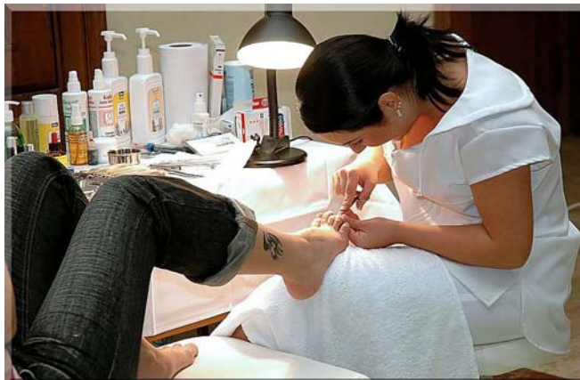
3. ábra. Kéz- és lábápoló, műkörömépítő munka közben