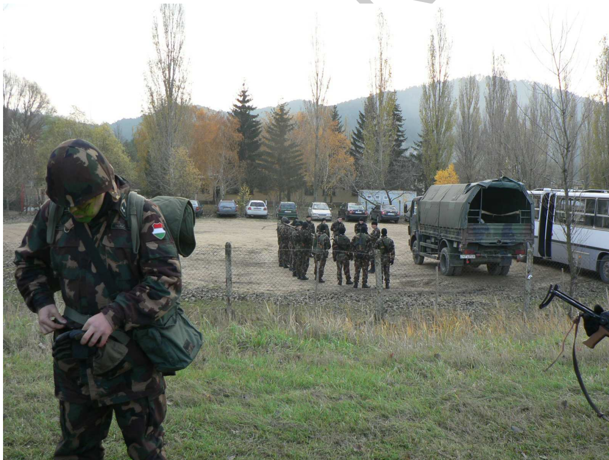
3. ábra. Az őrség felkészítésre várva

Az őrség felkészítésére a szolgálatba lépés előtt 4 órát kell biztosítani, ebből 2 órát az elméleti és gyakorlati felkészítésre, 2 órát pedig a személyes felkészülésre. A felkészítés gyakorlatias legyen, feleljen meg az adott őrzési sajátosságoknak és a katonák gyakorlati tapasztaltságának.