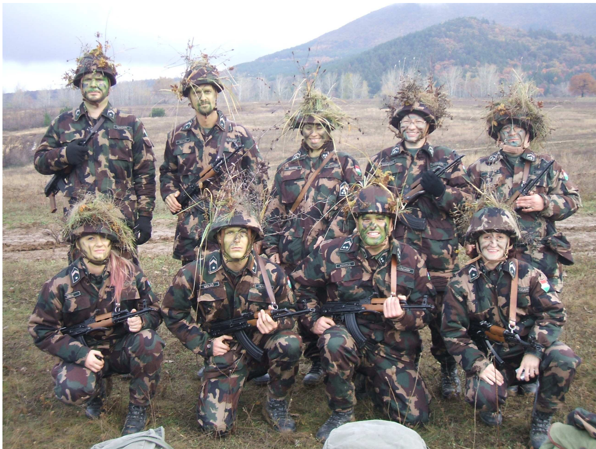
2. ábra. Felkészülés egyéb készenléti szolgálatra