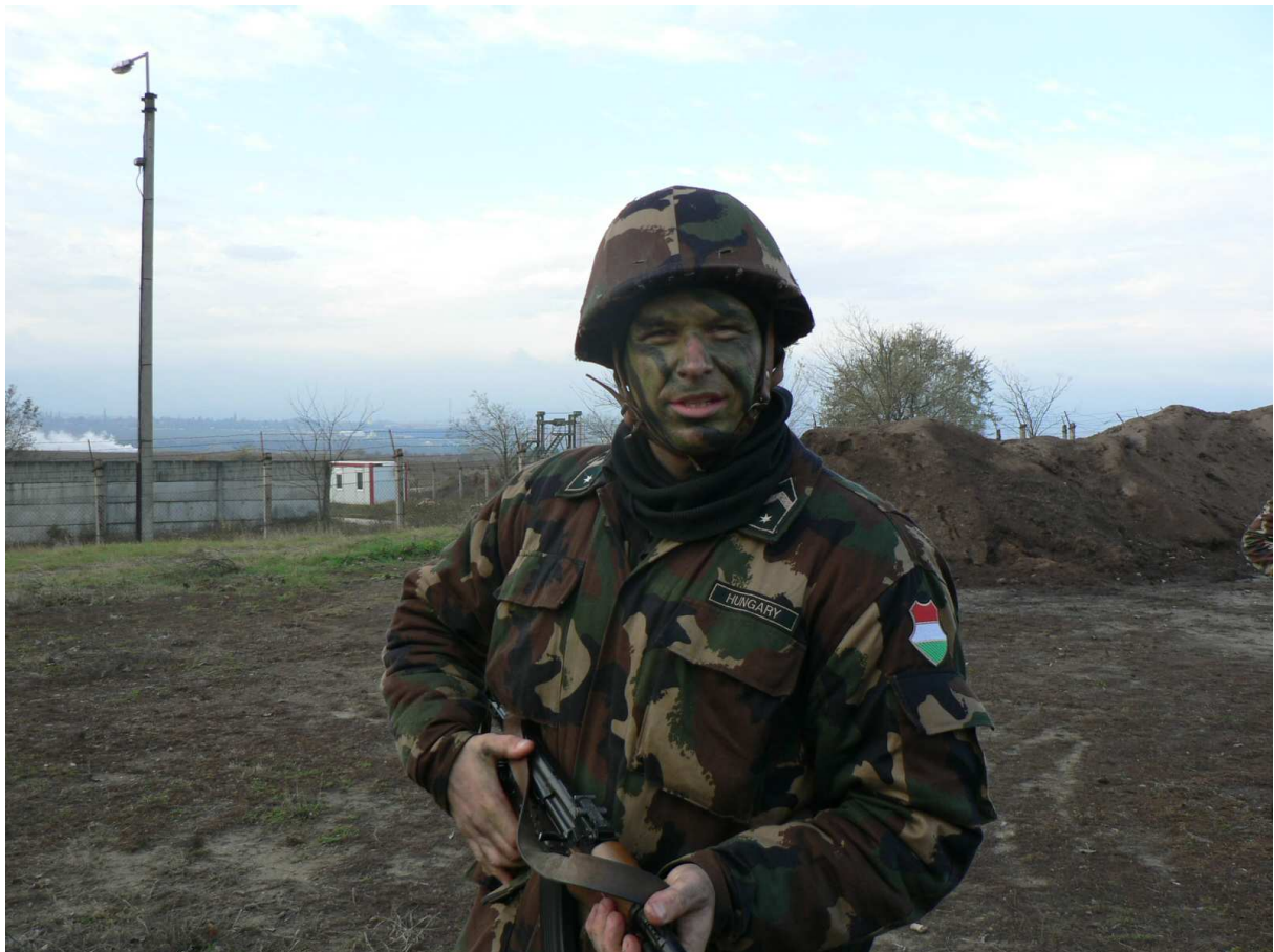
5. ábra. A felállított ór felkészítése az őrmintakertben

A felállított ór kiemelkedően fontos feladatot teljesít, őrhelyét még akkor sem hagyhatja el, ha életét veszély fenyegeti.