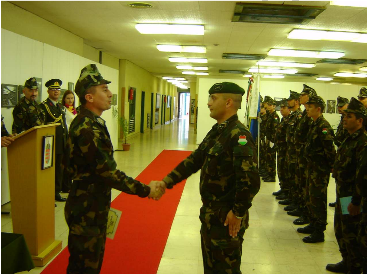
1. ábra. „Hazámat szolgálom!”

„ Hazámat szolgálom! ” Ugye, ismerősen cseng ez a mondat? Minden katona életében felemelő érzés, amikor ezekkel a szavakkal kell válaszolni. A Magyar Honvédség Szolgálati Szabályzata szerint, ha az előljáró egy katonát megdicsér, előléptetését, kitüntetését vagy magasabb beosztásba helyezését hirdeti ki, a jelen levő érintett ezekkel a szavakkal köteles válaszolni.