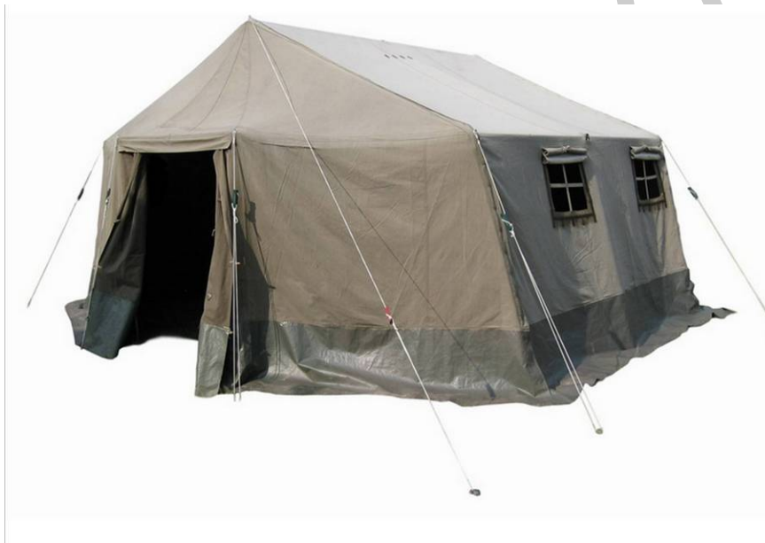
18. ábra. 63 M mintájú katonai sátor

A 63 mintájú katonai sátrakat több éve sikerrel, úgy mond „élesben” alkalmazzuk csapatépítő rendezvényeinken és kalandtúráinkon is, így kedvező tapasztalatunk birtokában jó szívvel ajánljuk Önnek. Erős, stabil fémváz és vízhatlan sátorvászon, mely szakszerűen felépítve és rögzítve komoly viharok is ellenáll.