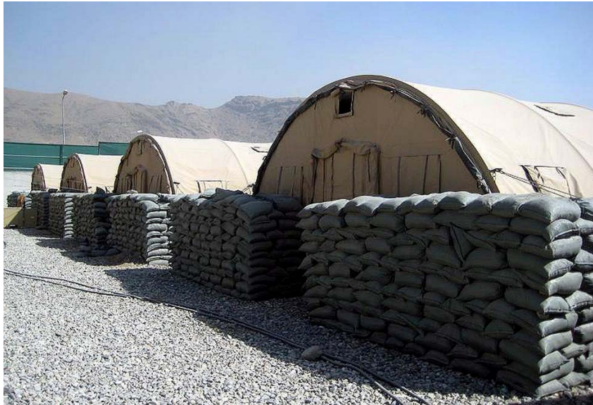
15. ábra. Katonai tábor egy részlete

A lőszer- és robbanóanyag-raktárakat az előírt védőtávolságok betartásával kell elhelyezni és őriztetni kell. Szükség esetén a védelmi létesítményeket és azok helyét a táborparancsnok határozza meg.