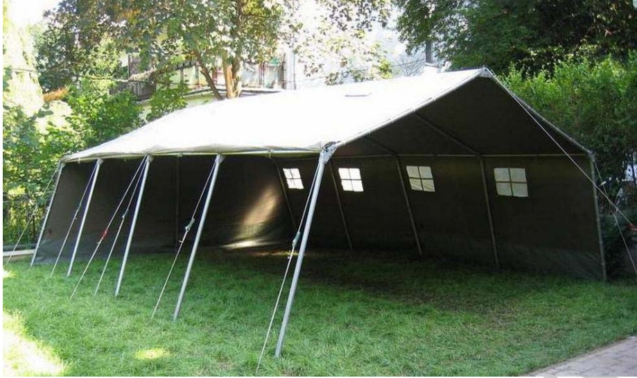
19. ábra. 63 M mintájú katonai sátor egyik építési lehetősége