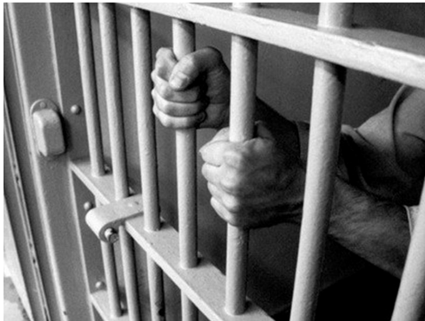
21. ábra. Büntetés letöltése a fogdán

Ha a szabálysértés a katona szolgálati viszonyának megszűnése után jut a parancsnok tudomására – és az még nem évült el – az ügyet át kell tenni az illetékes szabálysértési hatósághoz.