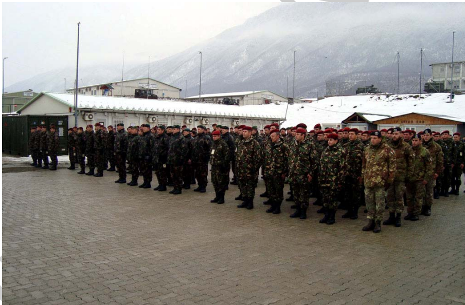
7. ábra. Külszolgálaton lévő honvédek ideiglenes tábori körülmények között

Biztosítja a katonai szervezetre háruló – a szolgáltatási szerződésben előírt – a szolgáltatás működtetéséhez szükséges feltételeket. Gondoskodik a szolgáltatási szerződésben foglaltak folyamatos és maradéktalan betarthatóságáról és betartásáról.