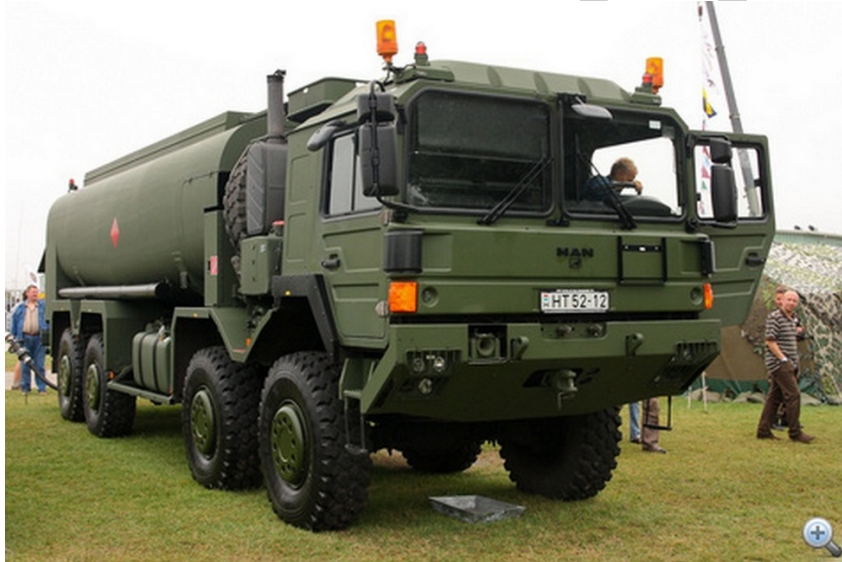
3. ábra. A logisztika egyik kulcsterülete, üzemanyag utánpótlás

A logisztika céljainak eléréséhez különböző tudományterületek törvény-szerűségeit, eredményeit használja fel. Ezek közül elsősorban a rendszerszemlélet, a szabályozásméletek, az operációkutatás, a matematikai statisztika, és az információelmélet játszanak jelentős szerepet. Mindezeket figyelembe véve a logisztika interdiszciplináris, integratív tudománynak tekinthető.