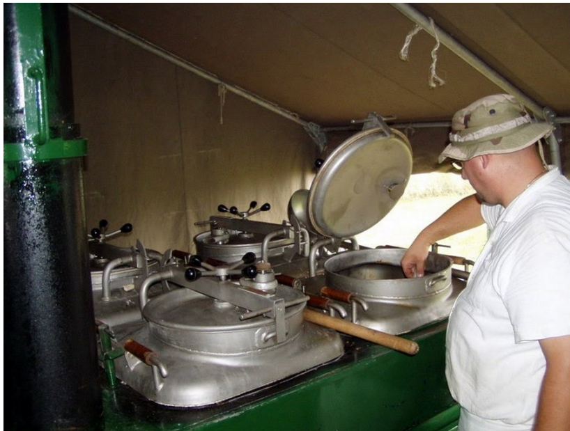
10. ábra. A katonák ételmezése tábori körülmények között