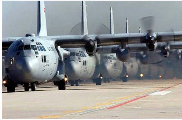
1. ábra. Katonai légi logisztikai ellátás biztosítása

A logisztika igazi térhódítása a haditudományokban a második világháború, illetve a koreai háború idejére tehető, ekkor kezdték az amerikai és a nyugati hadseregekben a Jomini által megfogalmazott elveket komolyabban alkalmazni és továbbfejleszteni.