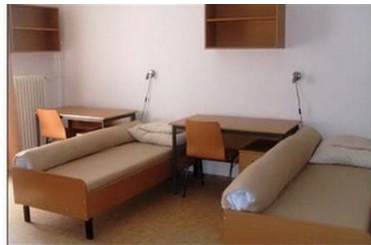
5. ábra. Katonai felsőoktatási hallgatók elhelyezési körlete

Csapatok elhelyezésére szolgáló katonai objektumok a laktanyák és az állandó jellegű táborok, valamint a (külföldi) műveleti területen szolgálatot teljesítő személyi állomány elhelyezésére a műveletet szervező, irányító külföldi szervezet, vagy a Magyar Honvédség által biztosított elhelyezési körletek.