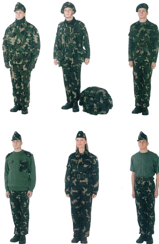
13. ábra. 90M mintájú katonai gyakorló ruházat

A próbaidőt követően a felderítő és az ejtőernyős szakbeosztású katona a nyári gyakorlósapka helyett hímzett felderítő (ejtőernyős) jelvénnel ellátott zöld barett sapkát visel, a harckocsizó és a hadihajós szakbeosztású katona a nyári gyakorlósapka helyett hímzett harckocsizó, illetve hadihajós jelvénnel ellátott fekete barett sapkát visel, a tüzér és a légvédelmi tüzér szakbeosztású katona a nyári gyakorlósapka helyett hímzett tüzér, illetve légvédelmi tüzér jelvénnel ellátott skarlátpiros barett sapkát visel.