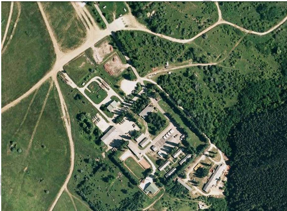
4. ábra. Laktanya képe madártávlatból

Az összevont laktanya logisztikai gazdálkodás egyes szakterületeit közvetlenül irányító vezetők hatásköre és felelőssége az adott szakterületen kiterjed az összevont laktanya logisztikai gazdálkodás irányítására és ellenőrzésére, a laktanyában ellátásra utalt katonai szervezetek teljes személyi állományának ellátására.