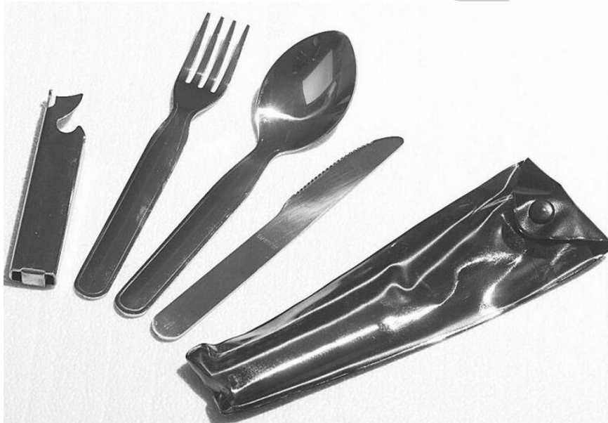
11. ábra. "Kanál gép" a katona konyhája

Aknamentesítésre és tűzszerész feladatok ellátására kirendelt hivatásos, szerződéses és tényleges szolgálatteljesítésre behívott önkéntes tartalékos katonák a feladat végrehajtásának ideje alatt.