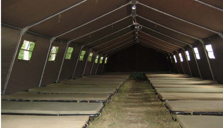
17. ábra. Katonai szálláshelyek sátorban

Csapatokat elszállásolni csak közegészségügyi-járványügyi szempontból átvizsgált helyiségekben szabad. Erről az elszállásolást elrendelő parancsnok köteles gondoskodni.