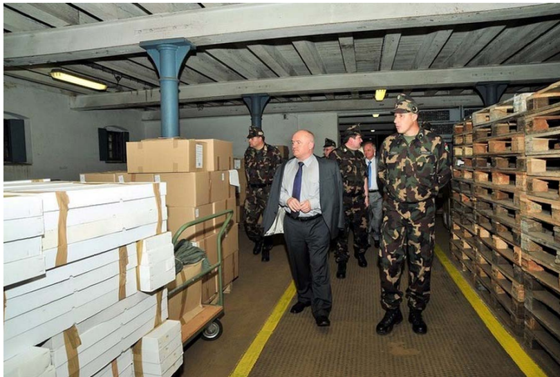
2. ábra. Miniszteri látogatás egyik az logisztikai katonai bázison

Ezen új igények és lehetőségek találkozása volt a logisztika gyors fejlődésének és elterjedésének fő mozgatórugója. Létrejött és a korszerű szervezési módszerekkel megvalósíthatóvá vált a JIT (Just In Time) elv , melynek lényege, hogy a gyártás során a nyersanyagok, félkész termékek percre pontosan akkor érkeznek meg a gyárba amikor megkezdődik a feldolgozásuk, és ezért szükségtelenné válik ezen anyagok raktározása. Ez egyrészt nagyban csökkenti, esetleg megszünteti a gyártásközi raktározás költségeit, másrészt jóval gyorsabb termelési átfutási időt tesz lehetővé. A JIT elv és a számítógéppel integrált rugalmas gyártórendszerek együttes alkalmazása lehetővé teszi a rendelésre való gyártást, ahol a gyárak nem készletre termelnek, hanem mindig az elosztási oldalról aktuálisan felmerülő igényeket (megrendeléseket) elégítik ki.