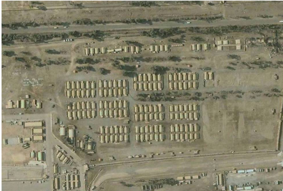
8. ábra. Katonai tábor Irakban

A naponta bejáró katonáinak részére helyiséget kell biztosítani az átöltözés céljából, ott biztosítani kell a katonák személyes felszerelésének biztonságos elzárhatóságát.