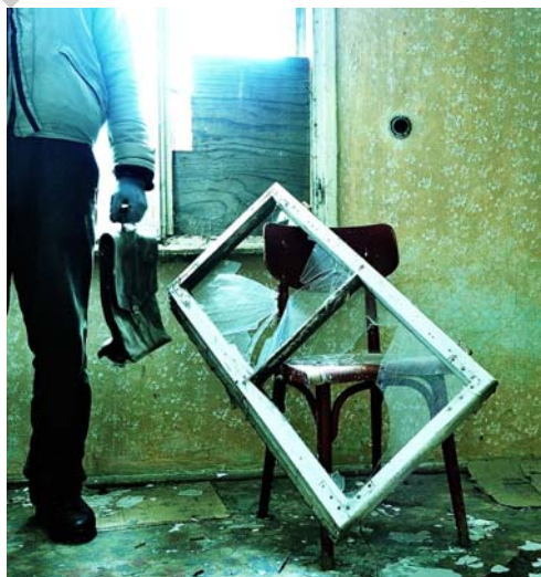
20. ábra. Szándékos károkozás

A katonai fegyelem a jogszabályokban, belső rendelkezésekben és az előjárók által meghatározott követelmények, feladatok minden katona és katonai szervezet részéről történő teljesítését, végrehajtását jelenti. Ennek megvalósítása és fenntartása minden katona kötelessége. A katonai fegyelem alapját a katonai élet- és szolgálati viszonyok rendezettsége adja, melyhez szorosan kapcsolódik a katona tudatos kötelességérzetén, a haza védelméért érzett személyes felelősségén alapuló aktív öntevékeny kezdeményezéssel és együttműködéssel párosuló engedelmségi készsége. A fegyelem minden katona önkéntes jogkövető magatartásán, a honvédelem iránti kötelezettségvállalásán, a haza védelméért és a szövetségeseik iránt érzett személyes felelősségén, a katonaközösségek összeforrottságán és magas fokú szervezettségén alapszik.