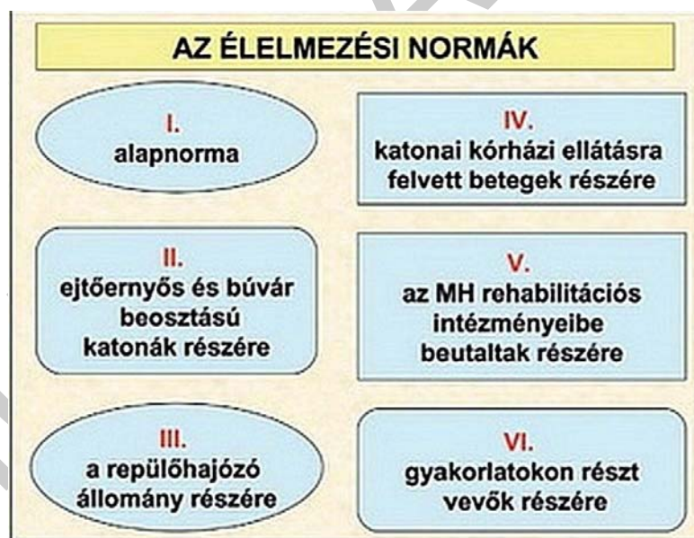
9. ábra. A Magyar Honvédség ételmezési normái

Az Magyar Honvédségen belül az ételmezési ellátást – a tevékenységhez igazodóan differenciálva – I–VI. számú ételmezési normák szerint kell biztosítani.