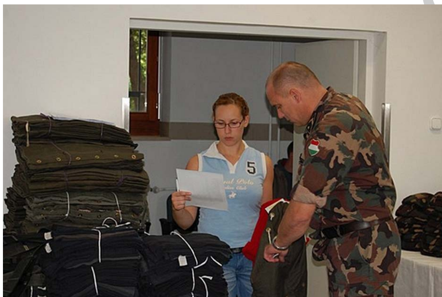
12. ábra. Újonc katonák alapfelszerelése

A katona részére biztosított alapfelszerelésről a személyhez kötést Részletes Felszerelési Könyvben (RFK) történő bejegyzéssel kell végrehajtani.