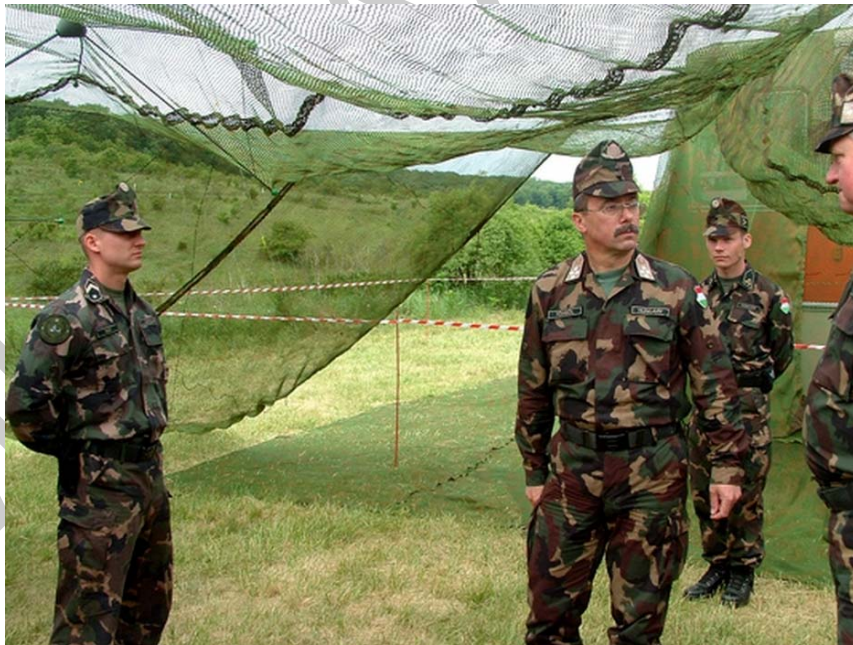
16. ábra Katonák harcászati, hadvezetési gyakorlaton.

Harcászati jellegű kihelyezések, gyakorlatok alatt a tábor alaprajzának, belső elrendezésének kialakításakor a felsorolt alaki követelményektől eltérően elsősorban a harcászati, az álcázási és védelmi szempontok az irányadók.