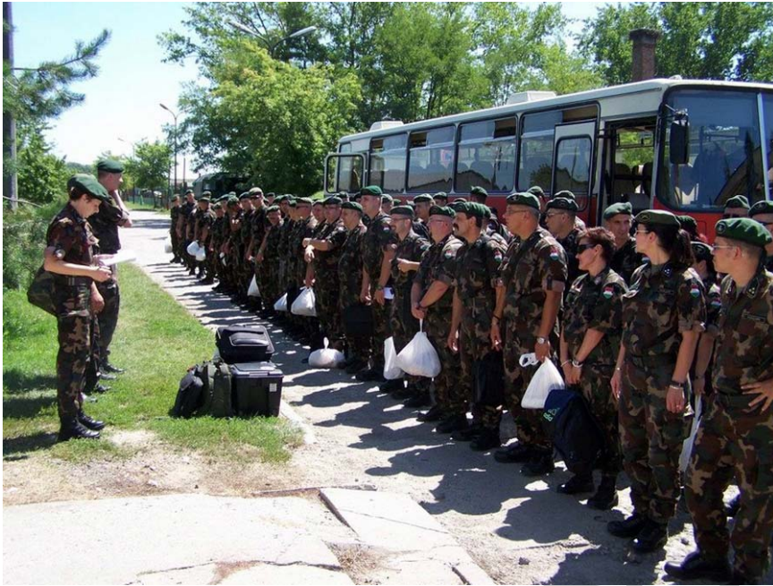
14. ábra. Katonák megérkezése a katonai táborba

A fenti kritériumokon kívül a táborhely: