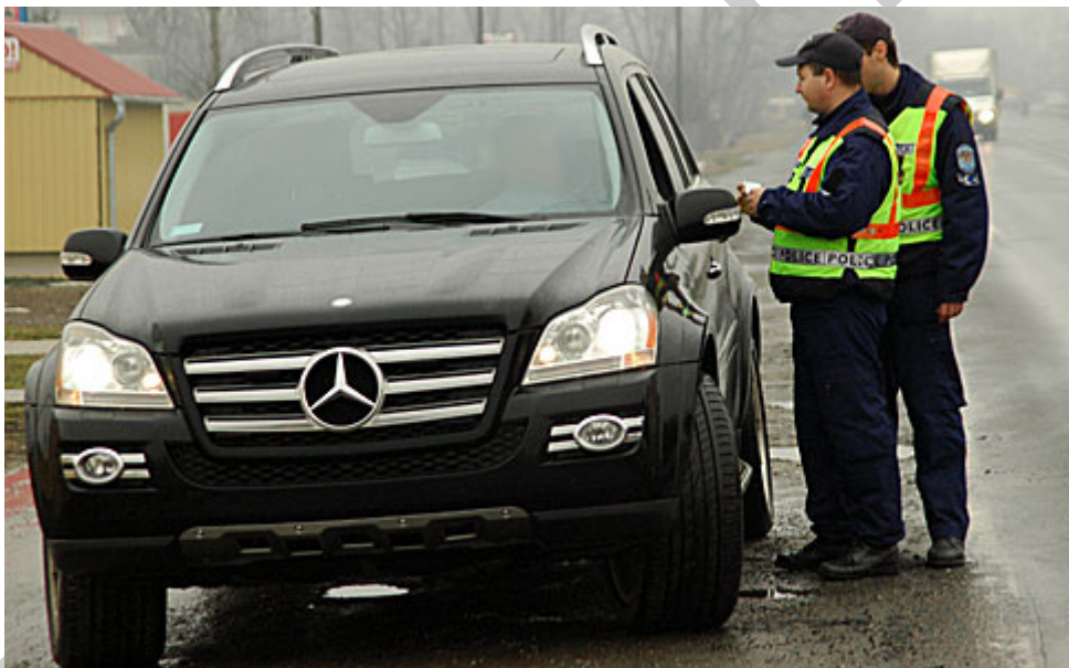
1. ábra. Az intézkedés végrehajtása 1

Ön közrendvédelmi rendőrként járőrtársával szolgálatot lát el a Budapesti Rendőr-főkapitányság XIII. Kerületi Rendőrkapitányság állományában. A járőrszolgálat teljesítése közben 10.43 órakor észleli, hogy a Bp. XIII. kerület Fáy utca – Jász utca kereszteződésénél olyan jármű vesz részt a közúti forgalomban, melynek nincs hatósági jelzése.