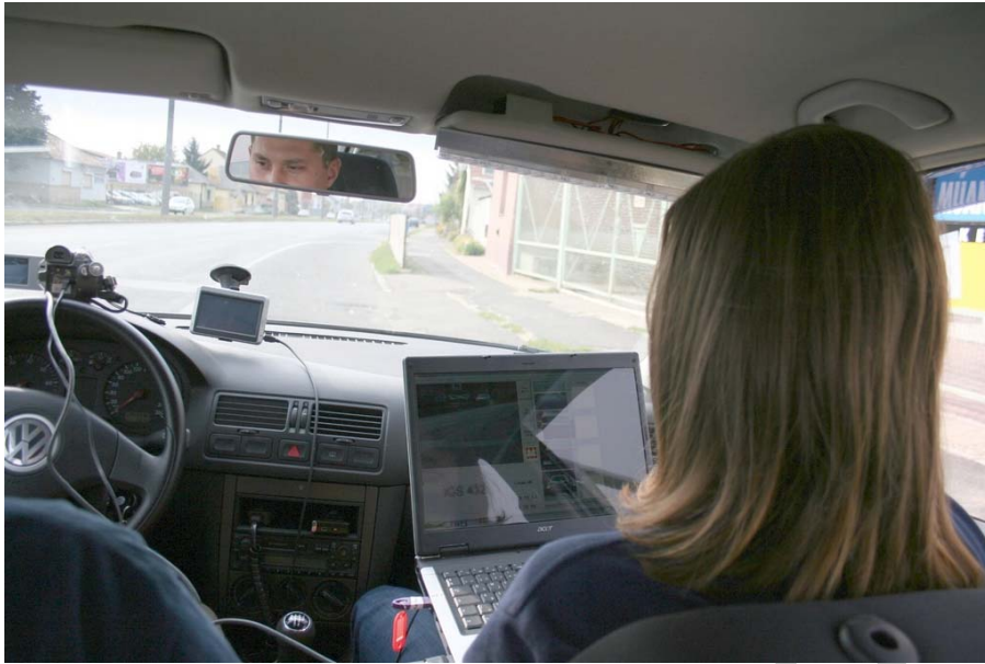
13. ábra. Gépjárművek ellenőrzése a körözési rendszerben

A Rendőrség annak a személynek, holttestnek, tárgynak a körözését végzi, akinek, illetve amelynek felkutatását vagy személyazonosságának megállapítását jogszabályban arra feljogosított hatóság határozatban elrendelte.