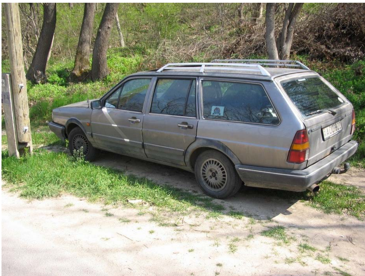
15. ábra. Megtalált körözött gépjármű

A KA a hatályos jogszabályok rendelkezése szerint elrendelt körözés adatainak – ismert személyi adatokkal rendelkező személyek, az egyedi azonosításra alkalmas tárgyak, illetőleg ismeretlen személyek és holttestek adatai és fényképe – kezelésére szolgáló, illetve ezen adatok megismerését biztosító adatkezelés.