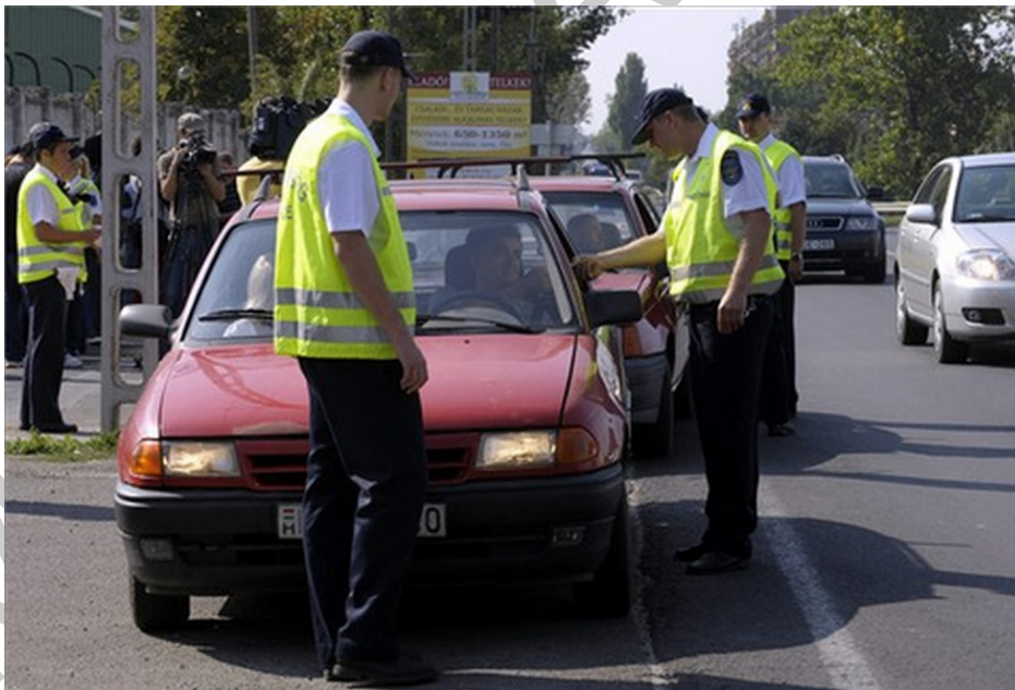
1. ábra. Intézkedés személyazonosítással!

Nézzük hát, hogyan, milyen tartalommal és módszerrel hajtja végre a rend őre a személyazonosság megállapítását.