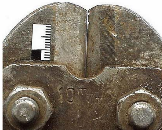
11. ábra. A nyomozók által rögzített, azonosításra váró tárgy

A személyek, egyediek, egymástól többé-kevésbé eltérőek keletkezésük pillanatában is, és további létezésük folyamán egymástól eltérő körülmények közé kerülve, újabb és újabb egymástól eltérő ismérveket szereznek. A tárgy teljes egészében önmagával is csak egy adott időpontban azonos, az idővel állandóan változik, s így önmagában hordozza a különbözőségeket is. A tárgyak állandó változásai viszonylagos állandósággal párosulnak. A kriminalisztikai gyakorlatban azonban a kérdés nem úgy merül fel, hogy egy balta azonos-e önmagával, hanem úgy, hogy nyomaik, maradványaik, nyilvántartási adataik, tanúk emlékezetében megmaradt képeik stb. alapján azonosíthatók-e.