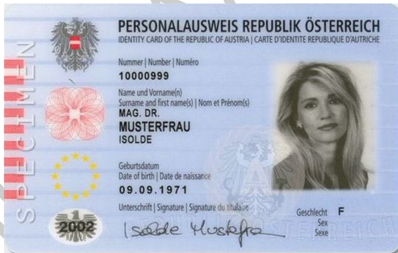
7. ábra. Személyazonosításra alkalmas okmány 3

A személyazonosítás célja, annak megállapítása, hogy a személyazonosításra szolgáló okmányt (útlevél, személyazonosító igazolvány, kártya formátumú vezetői engedély) felmutató személy azonos-e azzal, aki részére az okmányt kiállították.