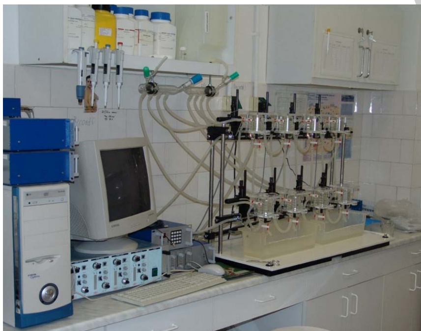
12. ábra. Kriminálisztikai laboratórium

Vagy két kis üvegszilánk eredetileg egy darabba tartozását a nyomszakértő meg tudja határozni a törésvonalak megfelelősége esetén akkor is, ha előzőleg nem vizsgálta meg, hogy azok ablaküvegből vagy gépjármű fényszórójának üvegéből pattannak le. A vegyészszakértő is rendszerint válaszolni tud a nyomozó hatóságok kérdéseire a vizsgálandó anyagok összetétele abszolút mennyiségi mutatóinak megállapítása nélkül, relatív mennyiségi analízis elvégzése útján. Ahhoz ugyanis, hogy két minta összetételt mennyiségileg összehasonlítsák, nem kell ismerni a bennük lévő különböző elemek abszolút százalékát, hanem elegendő megállapítani azok viszonylagos mennyiségét az egyik és a másik anyagban. A viszonylagos mennyiségek statisztikai megegyezése az adott anyagok kémiai összetételének megegyezéséről tanúskodik.