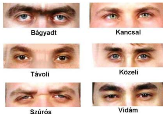
9. ábra. Szem és a szemöldök elhelyezkedése