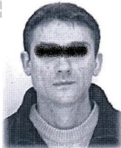
14. ábra. Rendőrség által közzétett körözött személy fényképe

A Rendőrség nyilvánosságra hozhatja a büntett megnevezését és az elkövetésével alaposan gyanúsítható vagy gyanúsított körözött személy nevét, képmását, az azonosításhoz szükséges adatait, a valószínű megjelenési, tartózkodási helyét, kivéve, ha azt a körözést elrendelő hatóság kifejezetten megtiltotta.