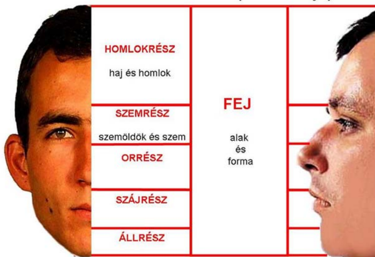
5. ábra. A fej anatómiai felosztása

A profilból történő megfigyelés és azonosítás elemei a következők: