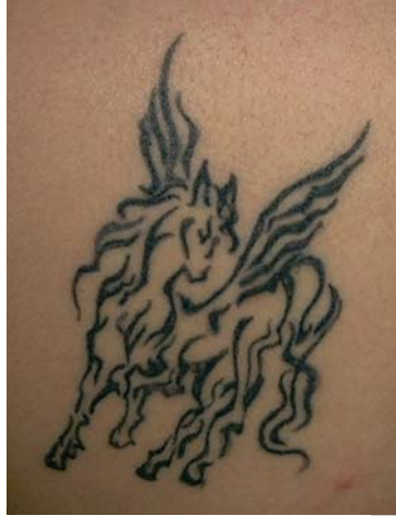
6. ábra. Tetoválás, mint különös ismertetőjel