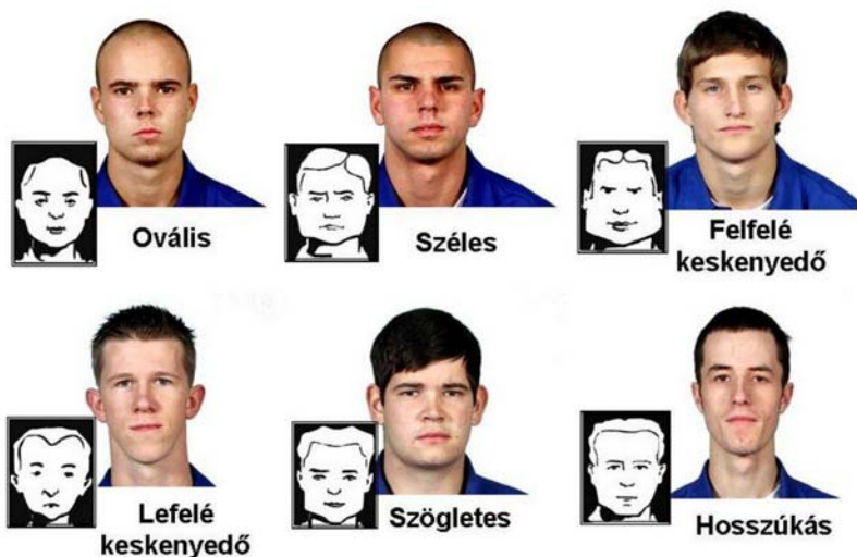
8. ábra. A fej formája