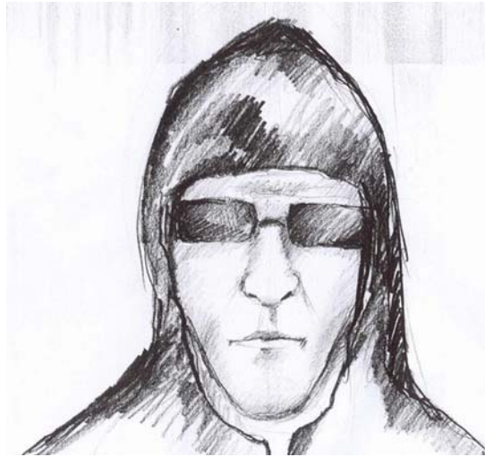
2. ábra. Személyleírás után készült fantomkép 2