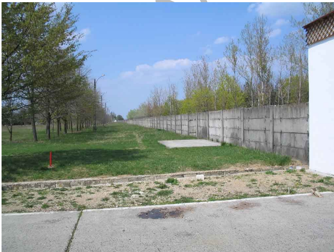
7. ábra Lehetséges mozgási körzet