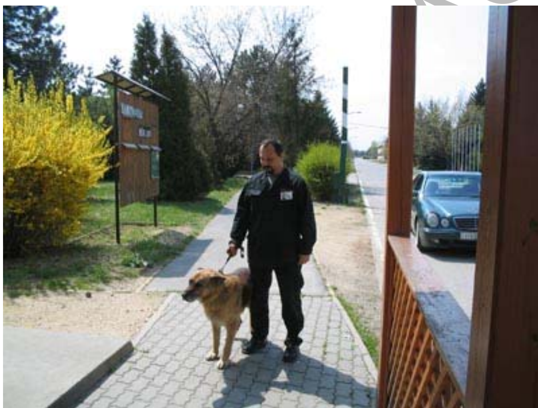
5. ábra Kutyával megerősített járőr