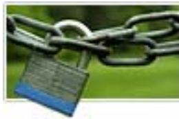
2. ábra Lakat