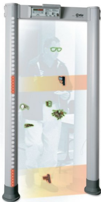
1. ábra. Átvilágító röntgenkészülék

Ön szerint lehetséges-e 100%-os biztonság megteremtése kompromisszumok nélkül? Nyilvánvalóan jelen esetben valamilyen területről, épületről van szó, amelyek lehetnek az állam- vagy magánszemélyek tulajdonában. Kíváncsi lennék rá, hogy mit gondol a következő három kép láttán! Egyáltalán tudja-e, hogy miket és miért raktuk ide ezeket a képeket? Vannak-e és milyen kapcsolatok ezek között?