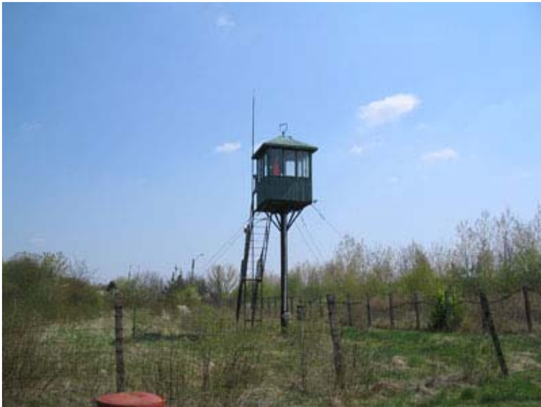
6. ábra Őrtorony figyeléshez