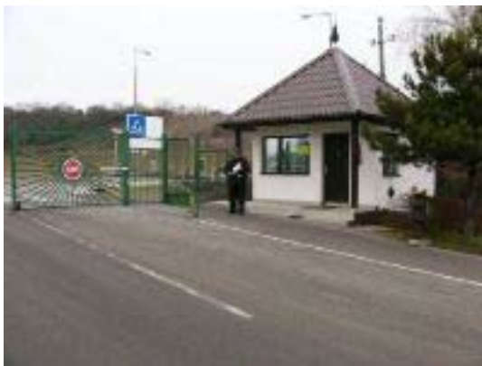
4. ábra Főkapu bejárat, portaszolgálat