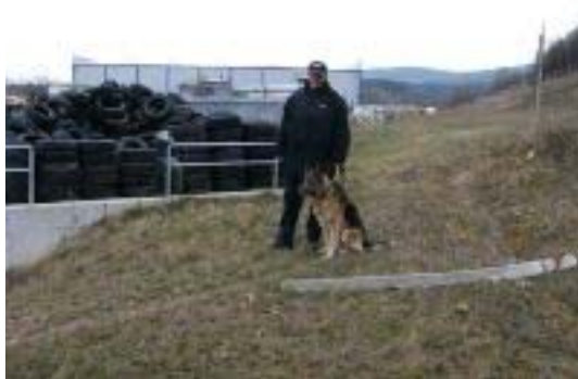
A feladathoz szükséges kép

Kérem, írja le, mit lát a képen és fűzzön hozzá a most tanultak alapján szakmai jellegű kiegészítést. (3 pont)