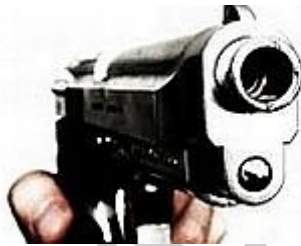
2. ábra. Jogos védelmi helyzetben használhat fegyvert

Végszükség: saját, illetőleg a mások személyét vagy javait közvetlen és másként el nem hárítható veszélyből mentés, vagy a közérdek védelmében e szerinti eljárás, feltéve, hogy a veszély előidézése nem róható fel a végszükségben cselekvő terhére, és a cselekménye kisebb sérelmet okoz, mint amelynek elhárítására törekedett.