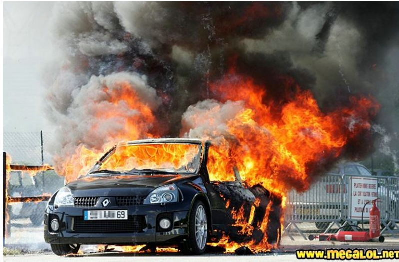
1. ábra. Objektumban égő személygépkocsi 1