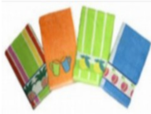
5. ábra. Frottír konyhai törlők 5