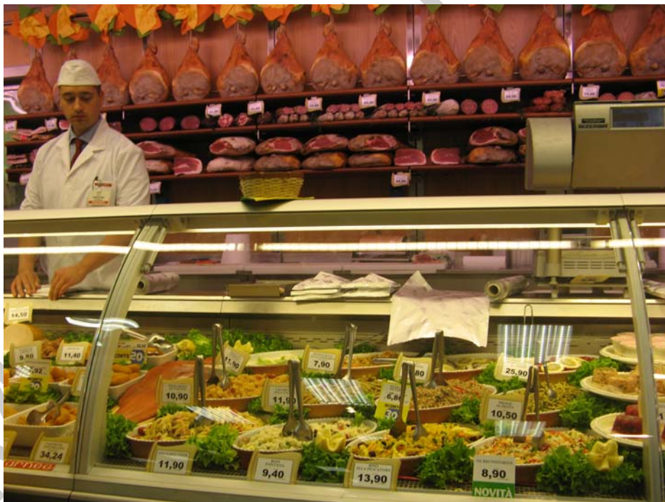
7. ábra Esztétikus hidegkonyhai pult egy külföldi élelmiszer áruházban

Az alábbi képen egy külföldi élelmiszer áruházban készült képet lát. Értékelje fogyasztóvédelmi szempontból!