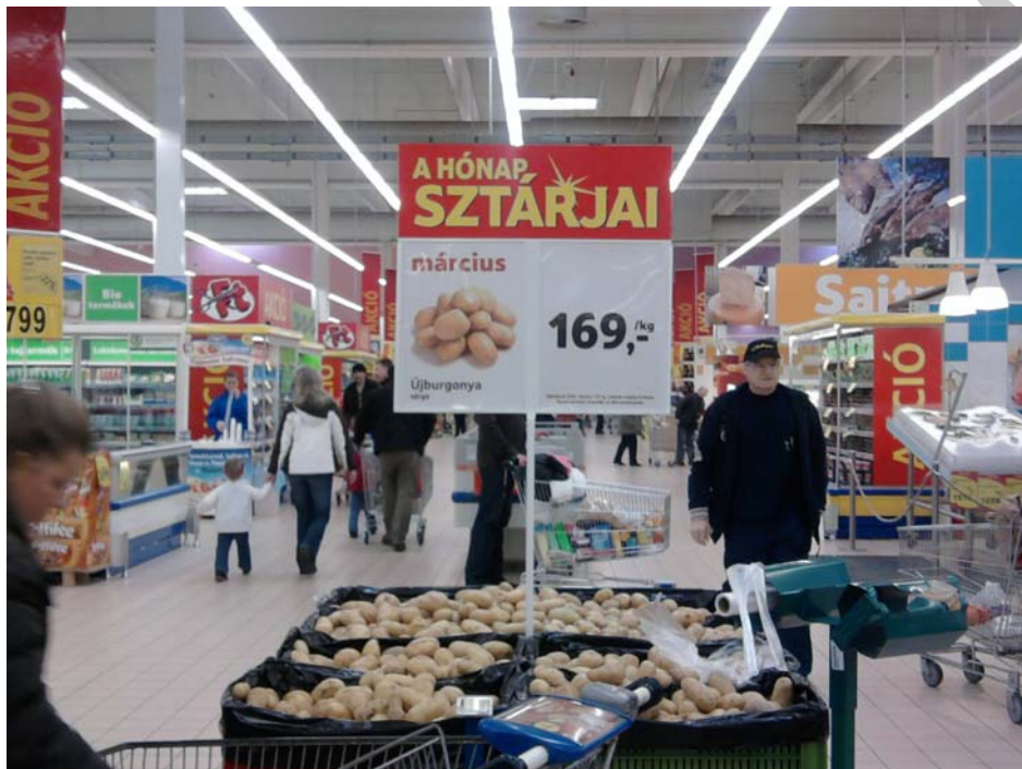
6. ábra: árfeltüntetés az akciós termék esetén

Értékelje az alábbi képet az árfeltüntetés szempontjából!