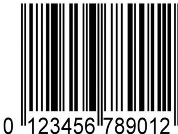
3. ábra. Vonalkód 4