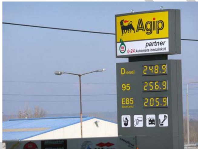
10. ábra. Üzemanyagtöltő állomás 6

C) Az alábbi képen helyesen tüntették-e fel az árakat az üzemanyagokkal kapcsolatosan?