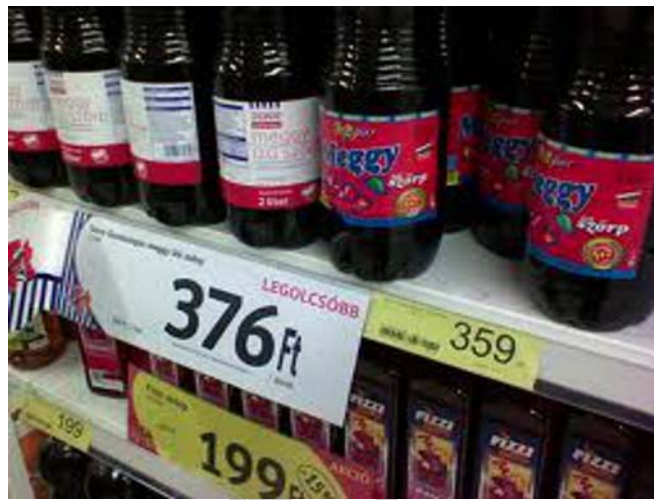
8. ábra. Hibás árfeltüntetés 5