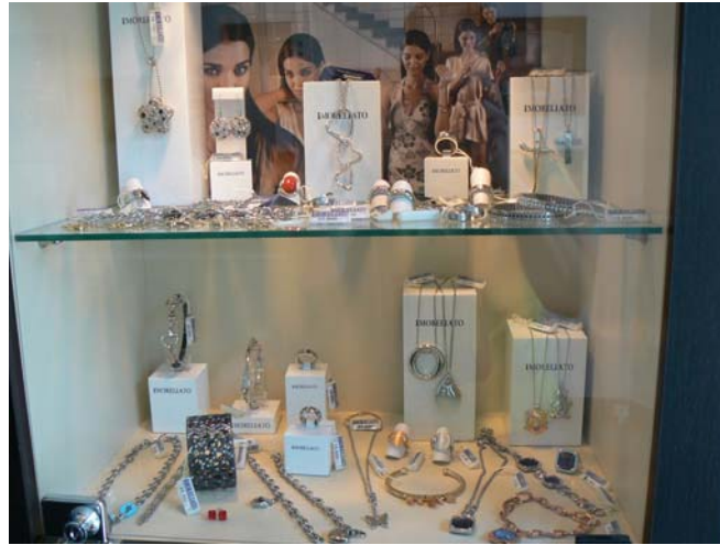
5. ábra. Kirakati árfeltüntetés