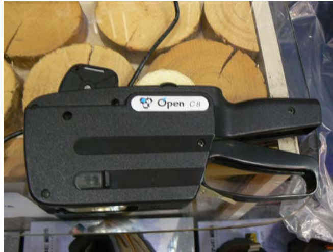
2. ábra. Mechanikus árazó gép

Térjünk ki néhány törvényi előírásra, melyek gyakran okoznak problémát az árfeltüntetéssel kapcsolatban.