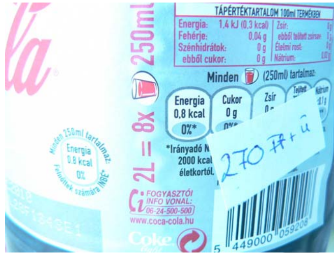
9. ábra. Helytelenül beárazva