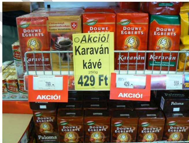
6. ábra. Akciós ár feltüntetése

Amennyiben a kereskedő akció keretében meghatározott termékeket kedvezményes áron kínál értékesítésre, ezen áruk esetében mind az akciós eladási, mind az akciós egységárat fel kell tüntetnie. (Az akciós egységár feltüntetésének kötelezettsége értelemszerűen nem vonatkozik azokra a termékekre, amelyek esetében a GM r. értelmében egyébként sem kell az egységárról tájékoztatást adni.). Önmagában az eladási ár és a kedvezmény mértékének feltüntetése (pl. „-70%”, „-5000 Ft”) nem fogadható el, ha nem szerepel számszerűen a ténylegesen fizetendő ár is, a lényeg ugyanis az, hogy ez utóbbiról tájékoztatást kapjon a fogyasztó.