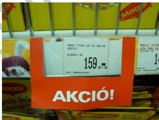
4. ábra. Polccímke

A gyűjtő árjelzés formája lehet gyűjtőár-lista, illetve polccímke. A gyűjtő árjelzésen a termék neve (esetleg valamely jellemzője, pl. kiszerezése), és a hozzá rendelt fogyasztói ár szerepel. Ebben az esetben az egyes termékek nem kapnak egyedi árazást. Alkalmazása csak akkor megfelelő, ha az áru és a hozzárendelt fogyasztói ár egyértelműen beazonosítható. Az elektronikus (vonalkódos) árleolvasó készülék alkalmazása nem mentesíti a forgalmazót az egyedi, vagy gyűjtőár útján történő tájékoztatás kötelezettsége alól. Ha az üzletben eltérés tapasztalható a kiírt polccímken, akkor az egység alkalmazottainak segítségével, hordozható árellenőrző gépekkel győződhetünk meg arról, hogy a polccímken feltüntetett és a pénztárnál fizetendő ár megegyezik-e.