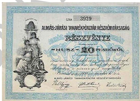
2. ábra. Régi vállalati részvény 1

Az alap- és törzstőke emelés saját forrásnak tekinthető. Ez azt jelenti, hogy a már meglévő résztulajdonosok további részesedésének növelése ill. új tulajdonosok bevonása történik . A külső forrás bevonása után a vállalat saját tőkéje emelkedik meg, vagyis az így bevont tőkét visszafizetni nem kell.