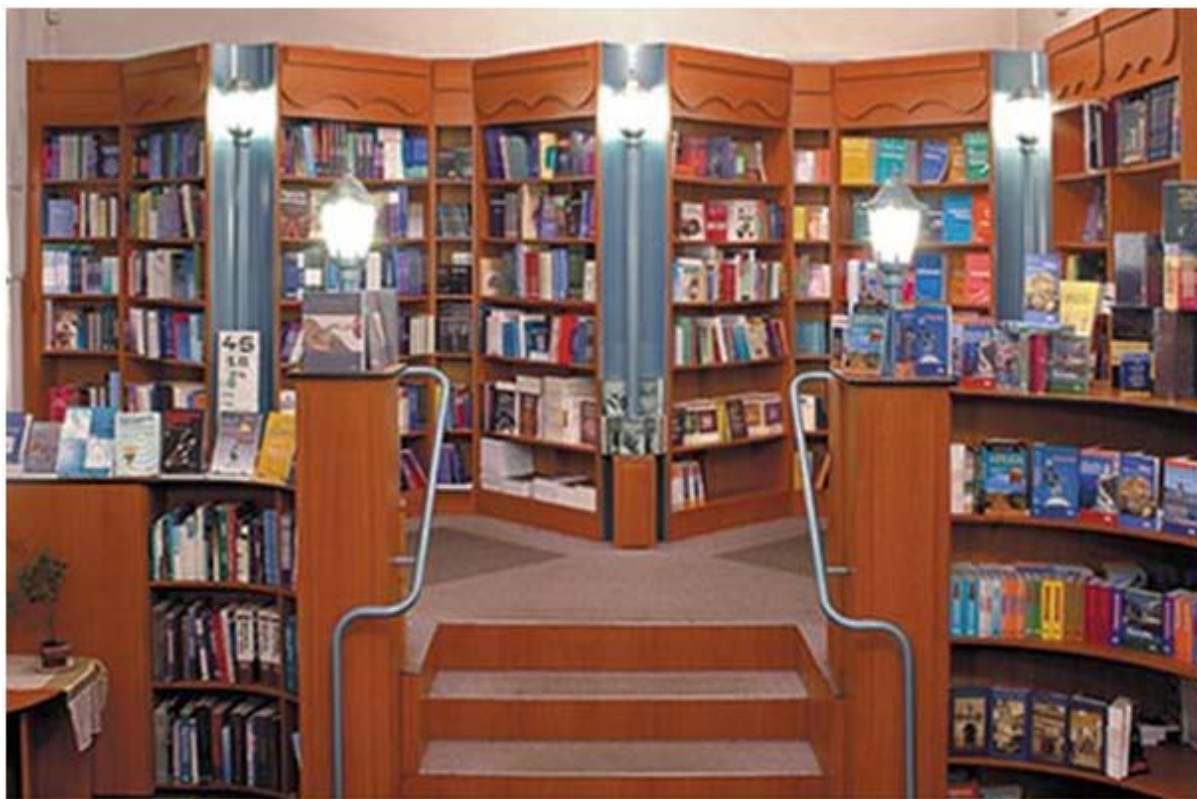
3. ábra Könyvesbolt 3

Válaszait a fenti információtartalom és egyéb források (2009. CXV tv., a Magyarország.hu, más internetes oldalak és nem elektronikus források) felhasználásával fogalmazza meg és írja le a kijelölt helyre!