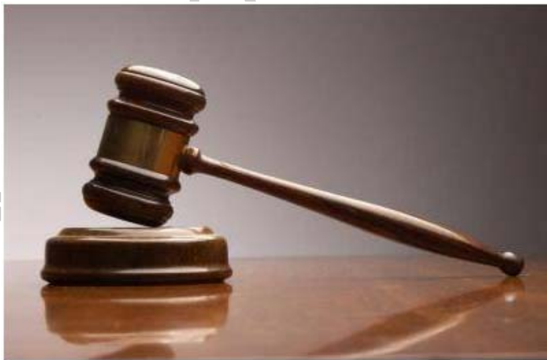
6. ábra Fontos a jogszabályi környezet

Az egyéni vállalkozás megszűnése, megszüntetése