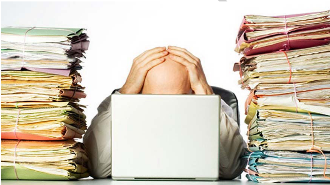
3. Faire appel à l'esprit de synthèse

Plus généralement, la plupart des activités professionnelles qui ne relèvent pas de la stricte exécution font appel à l'esprit de synthèse, à la capacité de rassembler des données éparses, de les embrasser d'un seul coup d'œil et d'en tirer des indications utiles pour entreprendre une action.