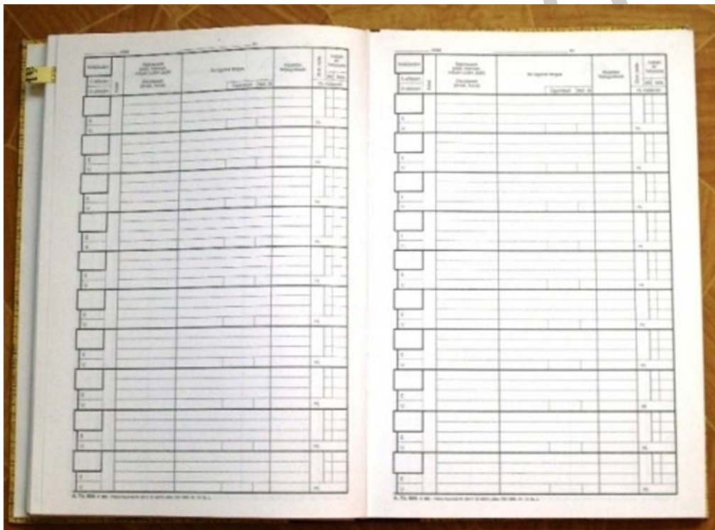
1. ábra. iktatókönyv