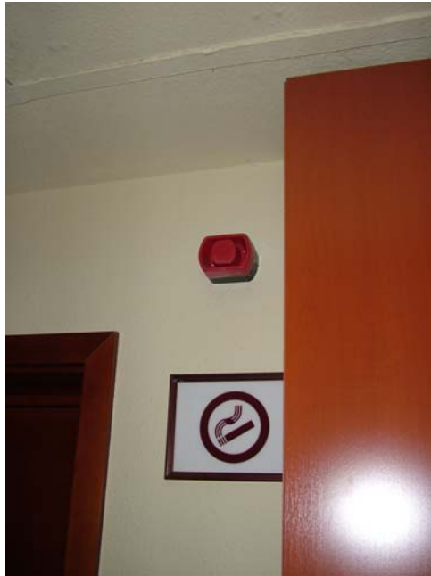
10. ábra. Tűzjelző sziréna