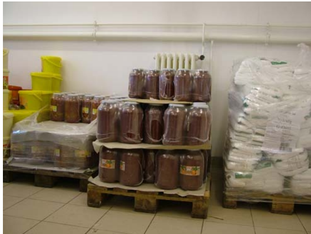
14. ábra. Keressük a csomagolóanyagokat!

Sorolja fel a képen látható csomagoló anyagokat, göngyölegeket!