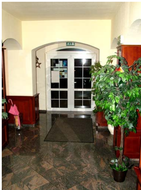
13. ábra. Kijárat

Nézze meg alaposan a képet és fedezze fel a hibát!