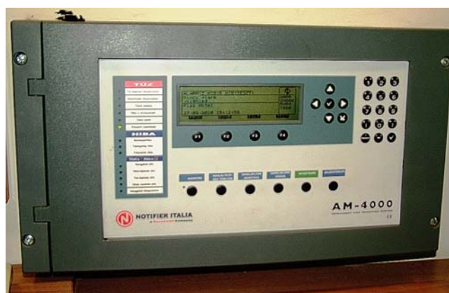
7. ábra. Automatikus tűzjelzés

Aki tüzet észlel vagy a tűz kialakulásának veszélyét látja, köteles haladéktalanul jelezni a tűzoltóságnak. A tűzjelzés díjtalan, más hívásokkal szemben elsőbbséget élvez. A vendéglátó üzletekben a fővonalú telefonok mellett jól látható helyre ki kell tenni a tűzoltóság, a mentők (104) és a rendőrség (107) hívószámait.