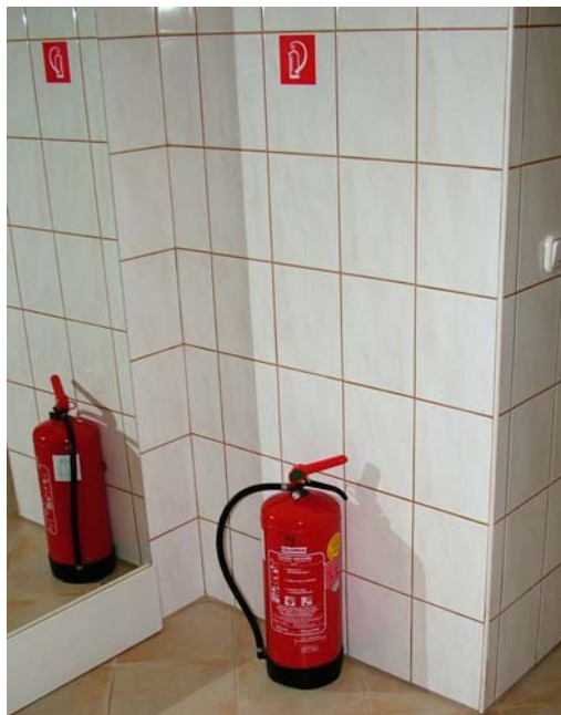
6. ábra. Poroltó készülék