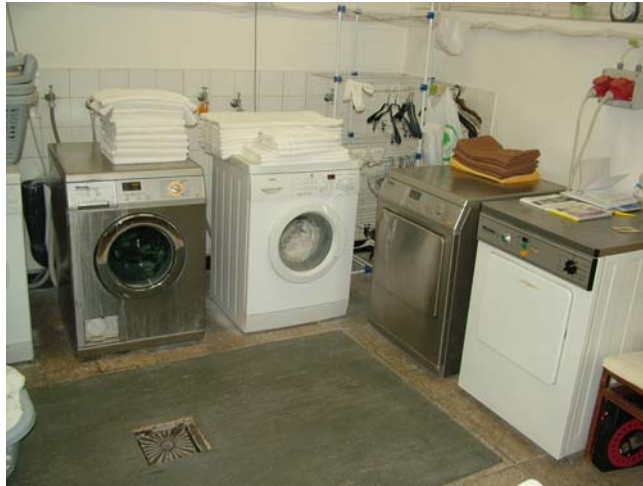
12. ábra. Mosoda