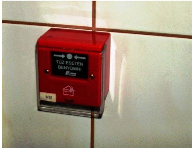
5. ábra. Mechanikus (kézi) tűzjelzés