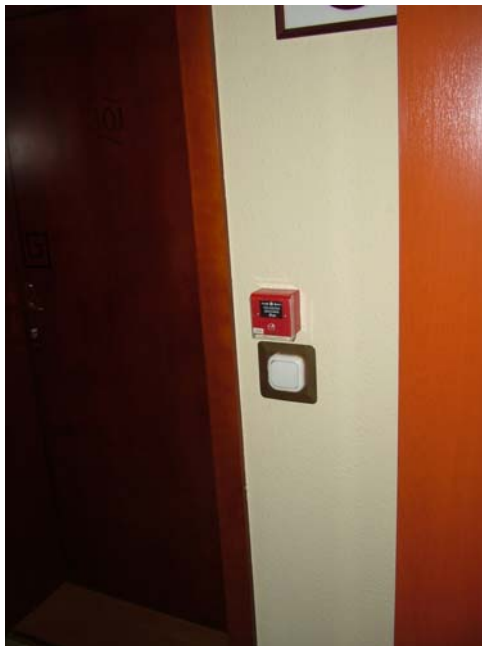
9. ábra. Tűzjelző készülék

Nézze meg az alábbi képeket és állapítsa meg miért ezt a helyet jelölték ki a dohányzásra?