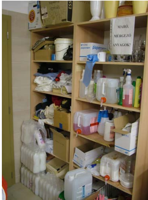
15. ábra. Keressük egy másik területet!