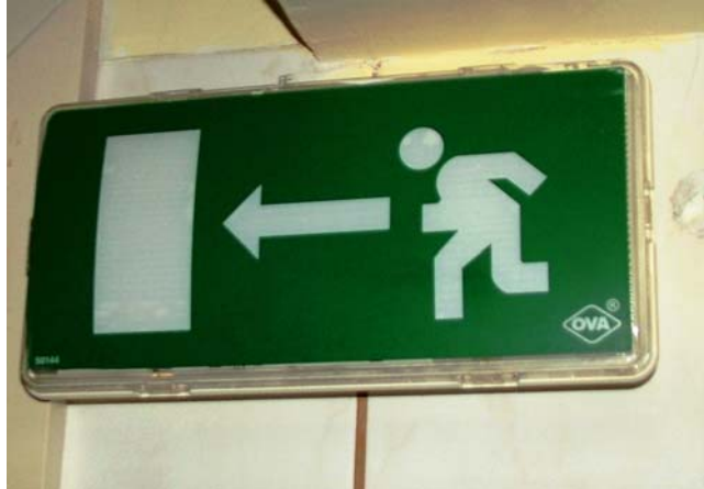
3. ábra. Vészkijárat jelzése (1)