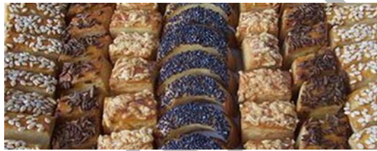
15. ábra Vágott sós

Az ismert módon elkészítjük a sós linzer tésztát, majd a begyúrást követően rögtön kinyújtjuk a tésztát kb. 1,5 cm vastagságúra. Tetejét recés nyújtóval mintázzuk, tojással megkenjük, sajttal, köménymaggal, szezámmaggal, stb. megszórjuk és hűtőben pihentetjük. A hűtőből kivéve különböző alakúra (négyzet, rombusz, téglalap, félhold, kör, stb.) felvágjuk vagy kiszúrjuk. Az így előkészített süteményeket sütőlemezre helyezzük és előmelegített sütőben 180–200°C-on megsütjük.