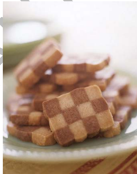
1.ábra Sütemények omlós tésztából