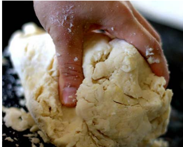
9. ábra Tésztakészítés 3.