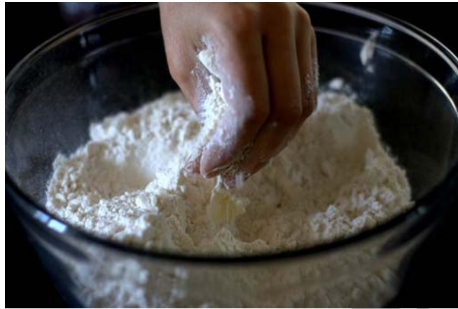
6.ábra Zsiradék elmorzsolása a liszttel

Az előkészítő műveletek elvégzését követően a lisztet a zsiradékkal elmorzsoljuk, majd hozzáadjuk a többi anyagot és rövid idő alatt tésztát gyúrunk belőle.