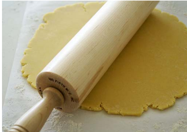
13.ábra Tészta nyújtása

A sütőből kivéve felületét megkenjük forró barackízzel, majd őrölt dióval megszórjuk. A dió helyettesítésére használhatunk édes morzsát. Az így előkészített tésztalapon elterítjük az előkészített, fahéjjal ízesített almatölteléket. A maradék tésztát kinyújtjuk és beborítjuk vele a tölteléket. Felületét tojással megkenjük, villával rácsozzuk és megszurkáljuk. Előmelegített sütőben 180°C-on aranyárgára sütjük.