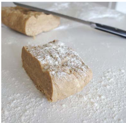
14. ábra Barna linzer tészta

A barna linzer tészta a sárga linzerhez hasonló módon készül, csak tartalmaz őrölt olajos magvakat is. Ízesítő anyagként a citromhéjon és a vanillincukron kívül fahéjat szoktunk a tésztához adni.