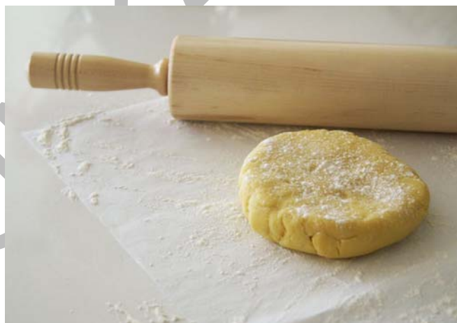
12.ábra Tészta nyújtása

Kinyújtjuk a sárga linzi tésztát 8mm vastagságúra, széléj egyenesre vágjuk és előmelegített sütőben félig megsütjük.