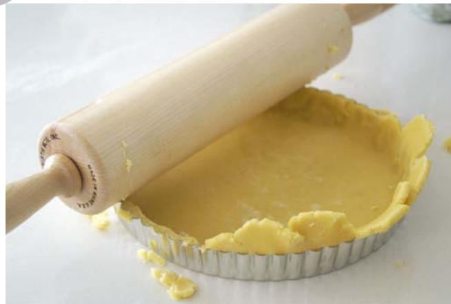
16. ábra Brokkolis pite készítése

A sós linzer tésztát begyúrjuk, hűtőben kb. fél órán át pihentetjük. A pihentetés után kinyújtjuk, és kibélelünk vele egy piteformát úgy, hogy a forma oldalán is legyen tészta.