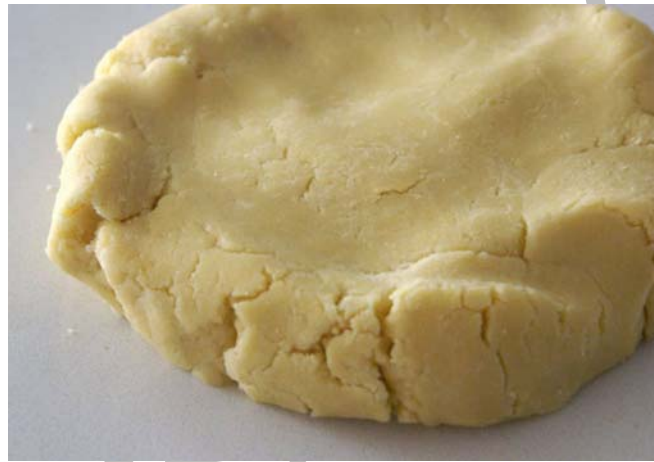
10. ábra Tésztakészítés 4.

Nagyobb mennyiség készítése esetén géppel történik a tésztakészítés. Ekkor a készítés sorrendje kissé megváltozik. Először a zsiradékot dolgozzuk össze a porcukorral, (de nem habosítjuk) majd beletesszük a többi anyagot és hasonlóan kézi gyúráshoz rövid időn belül begyúrjuk a tésztát. Az elkészült tésztát a felhasználásig hűtőben pihentetjük. Ha kis mennyiséget készítünk a dagasztást a fából készített munkaasztalon végezzük.