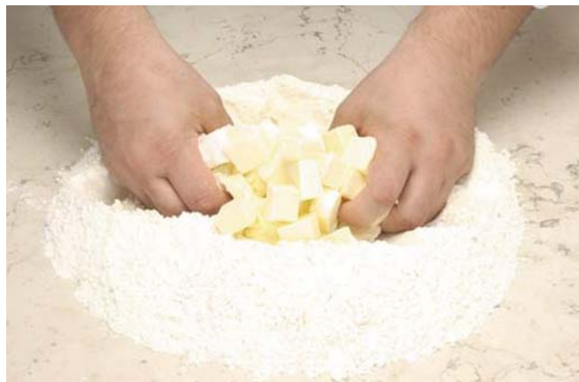
11.ábra Tésztakészítés munkaasztalon

Ha nagyobb mennyiséget készítünk, akkor használjunk gépet. A dagasztógép vagy az egyetemes konyhagép nagyban megkönnyíti munkánkat, de a tanulás időtartama alatt kézzel készítsünk tésztát, hogy a megfelelő tésztaállagot megismerjük.