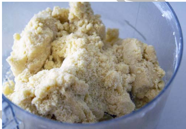
7.ábra Tésztakészítés 1.