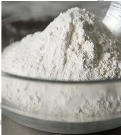
2. ábra Liszt

Az élesztős tészták egyik legfontosabb alapanyaga a liszt, ami nem más mint a gabonaszem őrleménye. A sütőcukrászatban a liszten mindig búzalisztet értünk. A megfelelő liszt kiválasztása és előkészítése egy cukrász számára nagyon fontos feladat. A liszt minőségét a sikértulajdonsága, hamutartalma és szemcse nagysága határozza meg. Az élesztős tésztákhoz főként finomlisztet (BL-55) használunk. A cukrászatban ritkán használunk más gabonából készült liszteket (pl. rizs liszt, rozsliszt, kukoricaliszt). A kiválasztott lisztet a felhasználás előtt minőségi ellenőrzésnek kell alávetnünk. Az egyik ilyen könnyen elvégezhető vizsgálat a liszt szagának vizsgálata. Termékkészítéshez csak idegen szagtól mentes lisztet használjunk fel. Ha a liszt szaga állott vagy dohos, próbáljuk meg többször jól átszellőztetni, átszitálni. Ha továbbra is érezzük az ideg szagot, ne használjuk fel a lisztet. A másik könnyen elvégezhető vizsgálat az íz vizsgálata. Ha zavaró, nem a lisztre emlékeztető ízt érzünk kóstoláskor, akkor azt a lisztet ne használjuk fel termékkészítéshez.