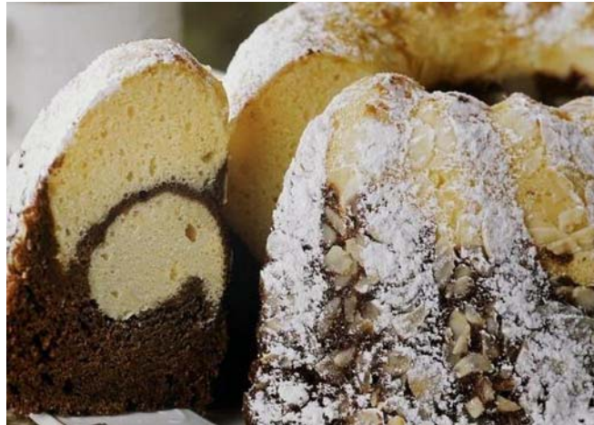
19. ábra Kuglóf

A szokásos módon elkészítjük a kevert élesztős tésztát és megkelesztünk. A kelesztés után a tésztát kisodorjuk vagy kigömbölyítjük. (Ha csöves közepű kuglófformát használunk, akkor döntünk a sodrás mellett, mert így könnyebb a tésztát a formába helyezni.) A kialakított tésztát az előzetesen leragadásgátló spray-vel kifújít formába helyezük úgy, hogy a 2/3-ad részéig töltsen meg a formát. Az így előkészített kuglófokat újból megkelesztjük és előmelegített sütőben 180°C-on megsütjük. A sütésnél ügyeljünk arra, hogy a kuglóf jól átsüljön.