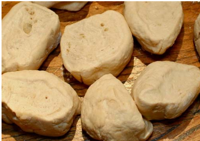
13. ábra Tészta darabolása

A kapott tézsdarabokat nyújtással, sodrással, vágással, tekeréssel, töltéssel, fonással, stb. műveletekkel megformázzuk, szükség szerint tojással lekenjük. A tészta a feldolgozás folyamatában nyeri el a termékre jellemző alakját.