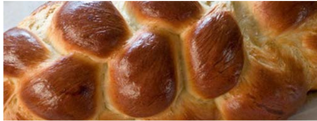
14. ábra Fonott kalács