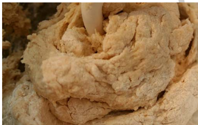
10. ábra Tésztagyúrás

A maradék lisztet – amit nem használtunk fel a kovász készítéséhez – keverjük össze a sóval és készítsünk a közepébe mélyedést. Keparjuk a kovászt a lisztből készített fészek közepébe, tegyük hozzá a többi megmaradt anyagot a folyadék kivételével és dagasszuk be a tésztát.