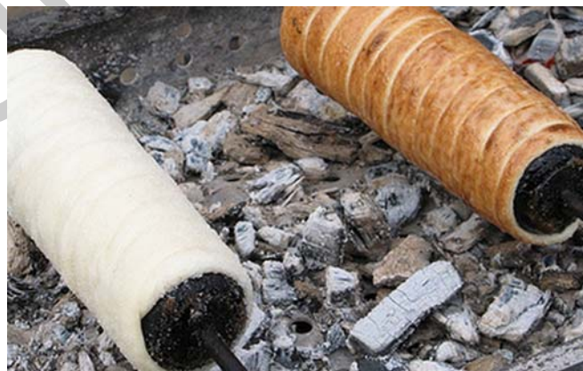
16. ábra Kürtőskalács

Az Erdélyből származó különleges kalácsot eredetileg faszénparázs felett forgatva sütötték. Az elkészített kalácsrészt kinyújtjuk, 2–3 cm vastag csíkokra felvágjuk a tésztát, feltekerjük hézagosan egy vajjal vékonyan megkent fa hengerre. Az asztalon a hengert átsodorjuk, így a tésztacsíkok egymáshoz érnek. A tésztát vajjal megkenjük, és cukros dióba forgatjuk. Mostanában készítenek nagyon sokféle ízesítéssel kürtőskalácsot. Ilyen lehet például a fahéjas, kókuszos, mogyorós, stb. ízesítésű kalács. A sütést végezzük faszénparázs felett vagy infrásütőben a lényeg, hogy a hengereket folyamatosan forgatni kell körbe.