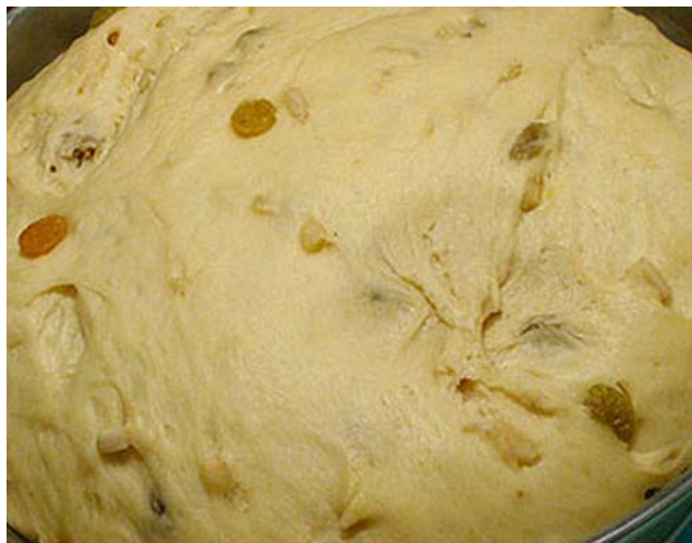
12. ábra Megkelt mazsolás kalács tésztája

A begyúrt tésztát tálba tesszük, melyet előzőleg vékonyan liszttel beszórunk. A tálba helyezett tésztát meleg helyen (30–40°C-on, 30–40 percig) letakarva kelesztjük. Ha olyan terméket készítünk, amihez sodornunk kell a tésztát, pl. fonott kalács vagy barhesz, akkor a kelesztéshez használt edényt ne liszttel szórjuk be, hanem olajjal vékonyan kenjük be. Így tésztánk a kisodrásakor nem fog ráncosodni.