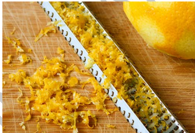
8. ábra Citromhéj reszelék

Vannak olyan ízesítő anyagok, melyeket a felhasználás előtt le kell reszelni. Ilyen lehet pl. a citrusfélék héjrésze, esetleg kemény fűszernövények vagy egyéb ízesítő anyagok (gyömbér, szerecsendió, fokhagyma, parmezán sajt, stb.).