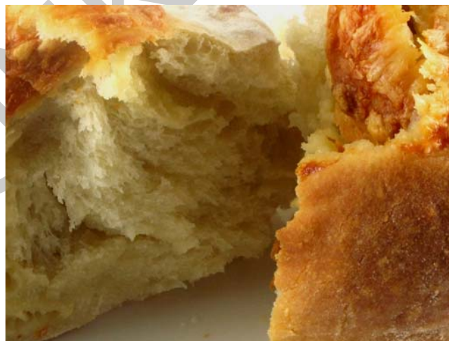
1. ábra Élesztős tészta

Az élesztős tészták a cukrásztészták között, ha rangsort állítanánk fel a felhasználás gyakorisága szempontjából, akkor igen előkelő helyet kapnának. A belőlük készíthető süteményeket, ha fel akarnánk sorolni, a változatok számtalan variációja miatt szinte a lehetetlen volna. Elkészítésük nagy szakértelmet igénylő feladat, ezért egy cukrásznak tisztában kell lennie az egyes tésztaípusok készítési módjával, ismernie kell a felhasználandó alap- és járulékos anyagok tulajdonságait, a készítés során kialakulható tésztahibákat, azok kijavítási módját és az egyes termékek gyártástechnológiai sorrendjét.