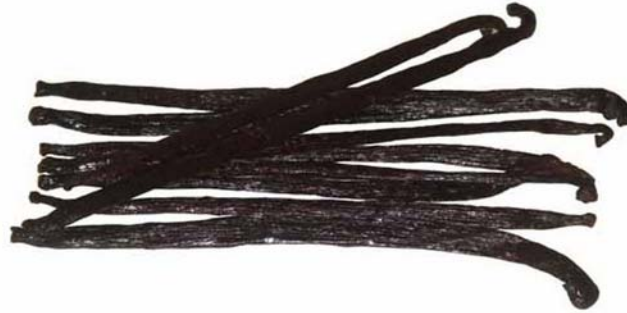
7. ábra Vanília rúd

Az ízesítésre használt fűszereket, ízesítőket a felhasználás előtt fel kell aprítanunk vagy meg kell őrölnünk. Ilyenek lehetnek például: fahéj, bors, paprika, friss zöldfűszerek, stb. A vaníliarúd használatakor kettéhasítjuk, magját kikaparjuk és a maradék magot a porcukorral átgyúrva tudjuk a termés héjából kiszedni.