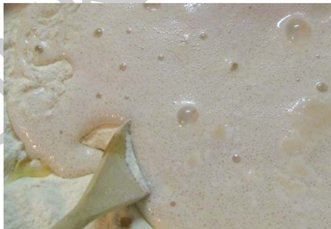
9. ábra Kovász készítése

A kovász vagy más néven előtészta készítését a kimért alapanyagokból készítjük el. Az élesztőt a folyadék kb.1/3-ad részében feloldjuk, majd annyi lisztet teszünk bele, hogy a keverék tejföl sűrűségű legyen. Édes tészták esetében tehetünk a kovászba kevés cukrot.