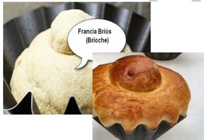
17. ábra Francia briós

A formában sült francia süteménykülönlegesség egyedi receptúra szerint készül. A kalácstésztahoz képest legjelentősebb változás, hogy legalább háromszoros zsiradékmennyiséggel készítjük. A formázásnál a tészta 90%-át kigömbölyítjük és az előzetesen kiszírozott formákba tesszük a megmaradt tésztarészből cseppalakot formázunk, melyet a félig megkelt sütemény tetejébe nyomunk. Tetejét tojással megkenjük és előmelegített sütőben 180–190°C-on aranybarnára sütjük.