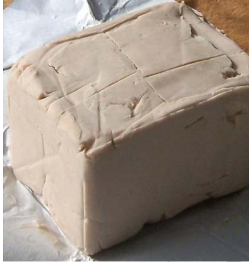
3. ábra Friss élesztő

Az élesztős tészták lazításához használt élesztő egy egysejtű, mikroszkópikus gomba. Az élelmiszeriparban használatos élesztőgomba színe világosbarna, frissen rugalmas tapintású, jellegzetes szagú és ízű termék. Kereskedelmi forgalomban kapható frissen, fagyasztva és szárított formában.