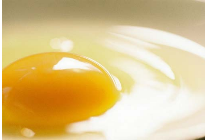
6. ábra Tojás

A legtöbb élesztős tésztához nem egész tojást, hanem csak a tojás sárgáját használjuk fel. Itt meg kell említenünk, hogy a tojás szó hallatán mindig csak a tyúktojásra gondolunk. Használhatunk fertőtlenített friss tojást, tojáslevet vagy tojásport.