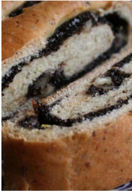
15. ábra Mákos kalács