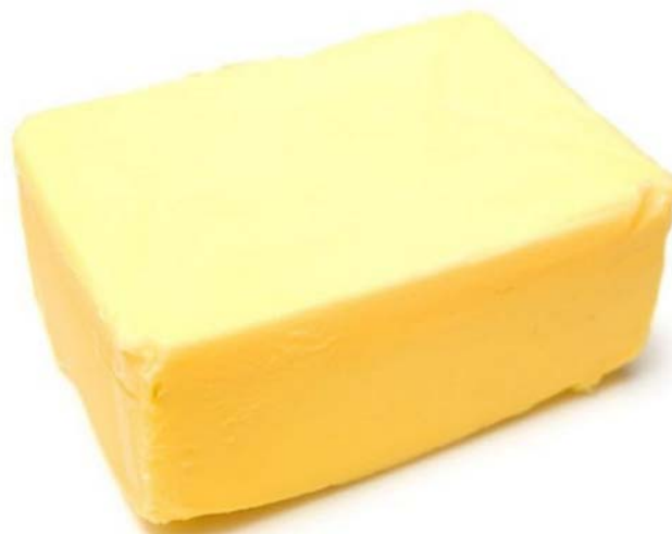
5. ábra Vaj

Az élesztős tészták készítéséhez zsiradékként leggyakrabban vajat használunk.