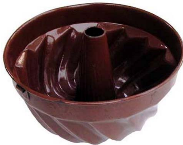
18. ábra Guglóf sütőforma

A receptúrából látszódik, hogy a készítéshez több vajat, több cukrot és több folyadékot használunk fel, mint a gyúrt élesztős tésztához. A felsorolt anyagok a tésztát ellágyítják, így kézzel való gyúrésa nem megoldható. A tésztakészítést keveréssel végezzük. Az elkészült tésztát szellőztetjük, kelesztjük, formázzuk és sütjük. A tészta légysága miatt a kevert élesztős tésztából készült süteményeket legtöbbször formában sütjük.