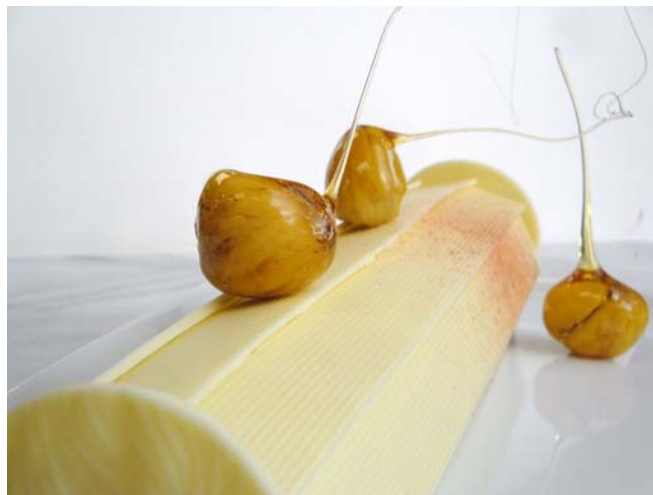
7. ábra Gesztenyés karácsonyi fatörzs