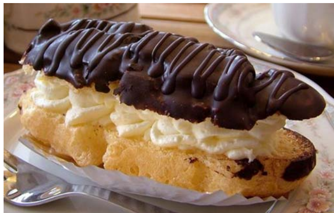
15. ábra Ekler fánk