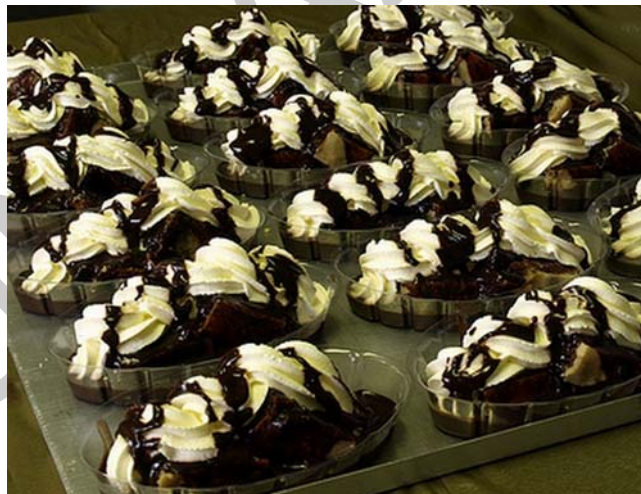
12. ábra Somlói galuska

Az egyik legfinomabb magyar desszertkülönlegesség. A Gundel Étterem honlapján az alábbiakat olvashatjuk a somlóiról: "A somlói galuska ma már több, mint egy az édességek sorából. Az igazi somlói egy keserédes gasztronómiai költemény, ízek, illatok mesés egymásra találása csokoládéöntettel és némi rummal. S hogy a galuska miért pont somlói? Az édesség szülőatyja Gollerits Károly egykori főpincér. A fejedelmi desszert születésekor édesszájú felesége is bábáskodott. Mivel a főpincérné a Somló hegy vidékéről származott, ezért úgy gondolta, kellő megtiszteltetés szülőhelyének, ha galuskája nevében szerepelhet. A hamisíthatlan somlói a következőképpen fest: csokiöntettel locsolnak meg néhány darab dióval, kakaóval és vaníliakrémmel megbolondított gömbölyű piskótagaluskát. Már a látvány is felemelő, nemhogy az íz! Aki eszik belőle, biztos, hogy jobb kedvre derül!" Ugyanakkor vannak olyan vélemények, miszerint a somlói galuskát eredetileg somlói furmintból készült borhab krémmel készítették és innen ered a desszert elnevezése.