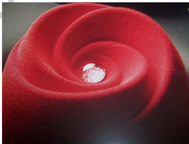
2. ábra. Piros színű csokoládé bevonat