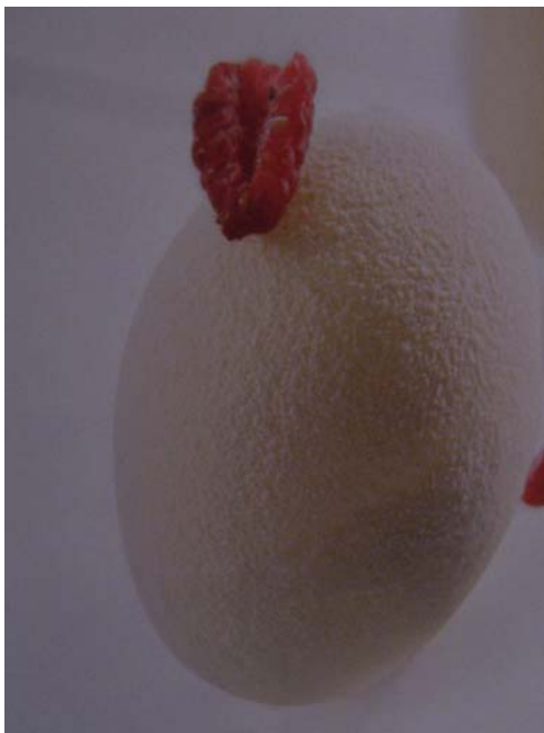
12. ábra. Fehér csokoládéval befújt csemegebomba