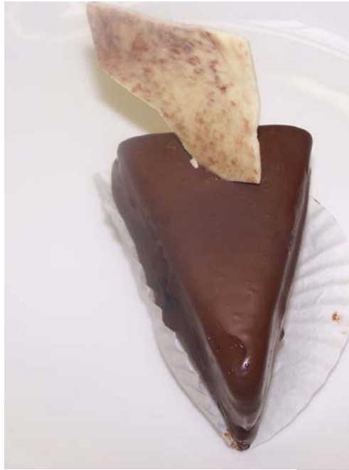
7. ábra. Torta alakú csemege