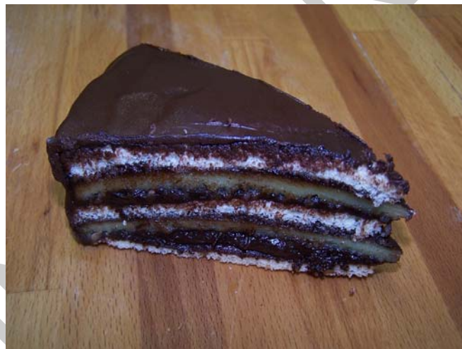
6. ábra. Párizsi krémmel töltött torta

A legegyszerűbb fajtája a csemegéknek, hiszen bármelyik párizsi vagy rokokó krémmel töltött egyszerű tortából előállítható. A betöltött, megdermedt, tortákat felszeleteljük. Esetenként aládíszítünk, majd csokoládéba mártjuk a körcikkeket (tortaszeleteket). A szokásoknak megfelelő, vagy a fantáziánktól függően az egyszerű díszítés elemeit használjuk.