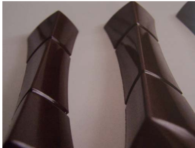
14. ábra. Formában készült csemege

A formákat teljesen megtöltjük temperált csokoládéval. A felesleg eltávolítása után ütögetéssel, rázogatással kiküszöböljük az esetleges levegőbuborékok létrejöttét. Rövid idő elteltével a forma oldalán dermedni kezd a temperált csokoládé. A néhány (kb.2) milliméteres kéreg kialakulását követően a felesleges csokoládét kifolyatjuk. A korpusz dermedése után a formákat megtöltjük az átkevert krémmel. A töltés során rétegezzük, betétezzük piskótákkal, alkoholban tartósított gyümölcsökkel, ízesített zselével, ostyatormelékkel stb.. A töltés végén lezárjuk a csemegénket a megfelelő méretre vágott piskótadarabbal. Dermesztünk. A szilikonforma felületéről könnyedén leválasztható lesz a csemegénk, de a formából történő kiszedéskor ügyeljünk a mintázat, élek épségére.