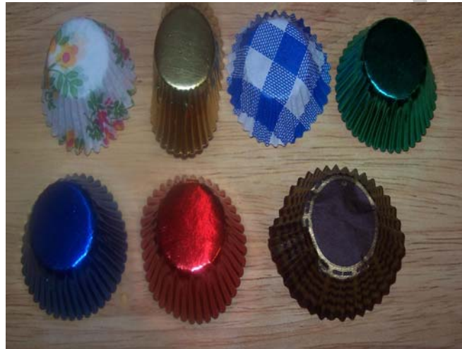
4. ábra. Különböző mintázatú papírhüvelyek

A bevont, díszített csemegéket egyedi csomagolással (papírhüvely) látjuk el. A redőzött oldalú papírtálcák alulról védik a csemegéket. Ez biztosítja a higiénikus kezelést is, illetve a csomagolás másik funkciója lehet a figyelemfelkeltés is. Megfelelő csomagolóanyagot választva növeljük termékünk esztétikumát, így akár növelhetjük a vásárlói kedvet is, hiszen soha nem tudjuk, mi alapján döntött a vendég pont amellet a termék mellett.