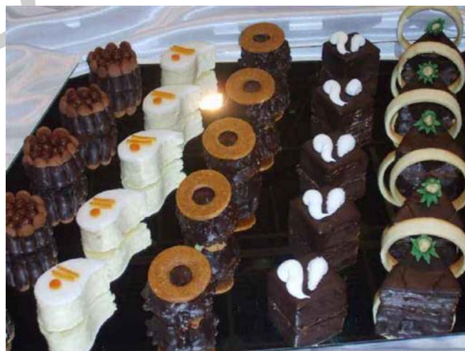
5. ábra. Csemegevariáció