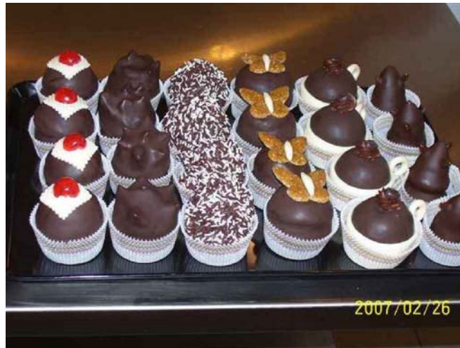
10. ábra. Csemegevariáció