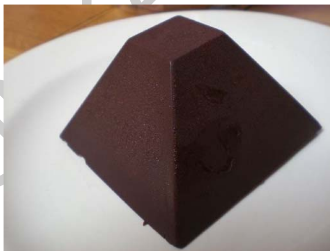
13. ábra. Piramis alakú csemege

A szilikonos formák segítségével széles formai változatosságot tudunk biztosítani a csemegék választékában. A legkülönfélébb alakzatokat (félgömb, piramis, kocka, téglalap stb.) be lehet szerezni. Ezek a formák alkalmasak sütésre, és fagyasztásra egyaránt.