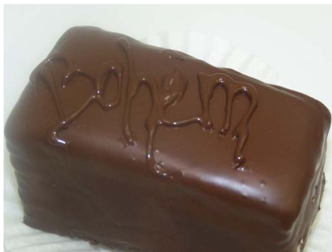
9. ábra. Bohém csemege

A krémen kívül a felhasznált tésztával is tudunk variálni. A töltés során a marcipánlapok mellett sokféle felvertet is felhasználhatunk. A Bohém csemegénél, ahogy az elnevezés is utal rá, bohém felvert tésztát töltünk össze, a Dominó és a Marcipános csemegék készítésénél vajás lapot használunk. Egyes csemegéknél sacher felvert a felhasznált tészta, és készülhetnek egyszerű piskóta, vagy dobos felvertből is a masszák.