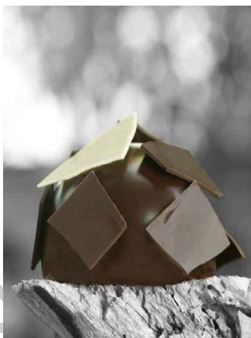
3. ábra. Felrakással díszített csemegebomba 1

A bevonóanyag dermedése után a sütemények felületét, vagy oldalát a tetszetőség fokozásának érdekében díszítésre alkalmas anyaggal beszórhatjuk. Amikor a beszórásra alkalmas anyagot (tortadara, őrölt vagy szeletelt olajos magvak, csokoládéforgács stb.) a termék oldalára juttatjuk, akkor panírozásról, ha a felületére, akkor hintésről beszélünk. Fecskendezhetjük, vagy felrakással is díszíthetjük a csemegéket. Díszítésre alkalmas elemeket vagy a segédanyagokat forgalmazó cégektől készen szerzünk be, vagy felrakásra alkalmas díszítőelemeket kell formázni kézzel (pl.: csokoládé pasztilla), sablonnal, formákkal, mintázó-fácskák segítségével (pl.: kávészem, kisvirág, levél stb.) . "A kevesebb, néha több" tartja a mondás, és ez igaz a díszítésre is. Általánosságban elmondható, hogy célszerű kerülni a túldíszítettséget, kövessük inkább az elegáns megoldásokat.