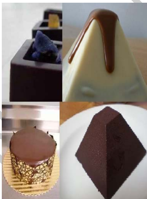
1. ábra. Különböző alakú csemegék

Még az élelmiszeriparban is ezzel a jelzővel különböztetnek meg termékeket pl.: kukorica, uborka, kolbász, fűszerpaprika stb.. Az emberek többségének a csemege szóról inkább valami féle édesség jut az eszébe. Valami ínycsiklandó, ami a legkülönbözőbb formákban készülhet el, és ami magában hordozza a meglepetést: "Vajon milyen lehet belül?"