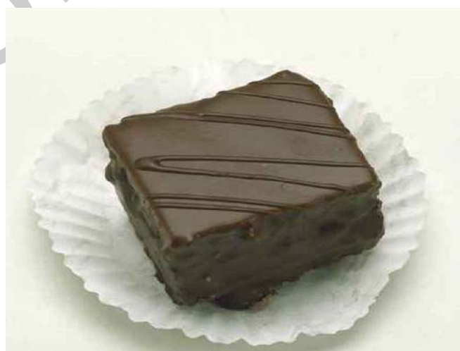
8. ábra. Vágással készült csemege

A vágással történő alakításnak nagyon nagy előnye, hogy formai változatosságot tudunk kialakítani a csemegék szortimentje között. Vágással készülhet pl.: háromszög, kocka, rombusz, téglalap alakzat is. Másik pozitívuma ennek a készítési módnak, hogy a szeletelés során kevés a veszteség. Ahhoz, hogy ne csak a formai változatosságot tudjunk biztosítani, hanem az ízbelit is, sokféle járulékos anyaggal célszerű dolgoznunk. Az erősen csokoládés ízű, kissé kesernyés párizsi krém nagyon sok egyéb ízzel párosítható. Harmonizál például a kókusszal,ogyoróval, narancshéjjal, marcipánokkal, konyakkal, rummal, whiskyvel, likőrökkel, és a fűszerekkel is. Így az előbb felsorolt járulékosanyagok bármelyikével dúsíthatjuk a párizsi krémet.