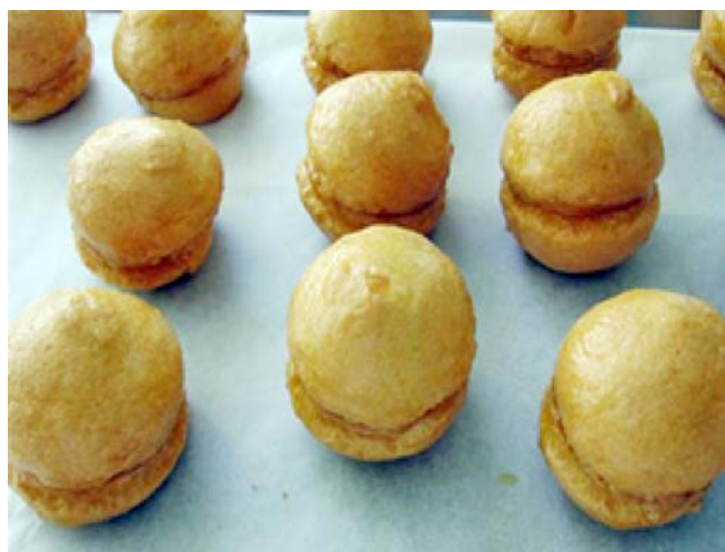
11. ábra. Betöltött és összeillesztett tésztahüvelyek

A könnyebb kezelhetőség miatt talpat vágunk a gömböknek. Felületüket bevonjuk krémmel és/vagy csokoládéval. Gyakran alkalmazzuk a csokoládé bevonás előtt az aládísztítás műveletét is pl.: Tüske bomba . A tüskés mintázatot a vastag krémbevonat ütögetésével (késpenge), vagy simacsöves nyomózsákból történő fecskendezéssel érjük el.