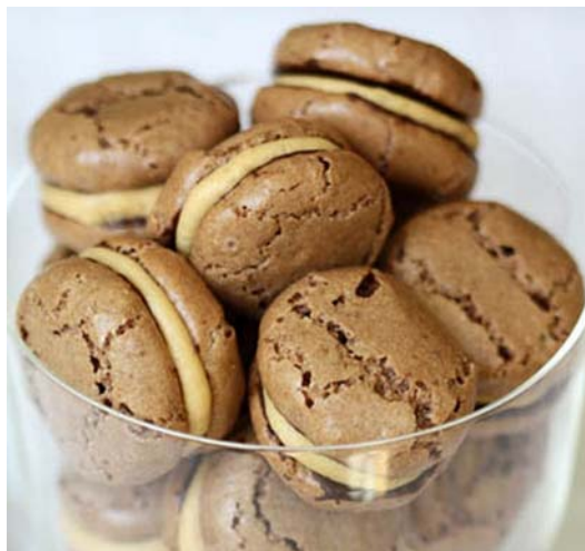
1. ábra. Diós csók

Az alapanyagokból (a dió kivételével) habtésztát készítünk. A diót sütőben megpörköljük, majd gorombára őröljük és a habtésztához adjuk. Szilikonpapírral fedett sütőlemezre kis halmokat formázunk simacsöves nyomózsák segítségével. Előmelegített, 70–80 °C-os sütőben szárítjuk. A kihűlt korpuszok alját csokoládében kimártjuk. A mártás során ügyeljünk arra, hogy a készítmény ne legyen "talpas". A diócsók teasüteményt készíthetjük töltötten is. Ilyenkor pralinékrémmel két tésztalapocskát töltünk össze.