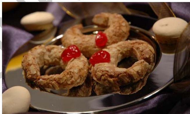
4. ábra. Mandulás kifli

A 18.sorszámú munkafüzetben már készítették jegyzet a mandulás kifli készítéséről. Ez a sütemény készítésében csak annyiban tér el az ott megismert uzsonnasütemény készítésétől, hogy 10 g-os darabokat mérünk ki, és abból készítünk pici kis kifliket. Igen mutatós lehet egy jól összeválogatott édes teasütemény kínálatban.