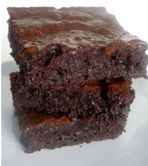
10. ábra. Csokoládés barrette

Az elkészült masszát vékonyan terítsük el keretes sütőlemezen és előmelegített sütőben (170°C-on) süssük 35–40 percig. A kihűlést követően vágjuk apró kockára vagy csíkokra. Egyéb díszítést a sütemény nem igényel.