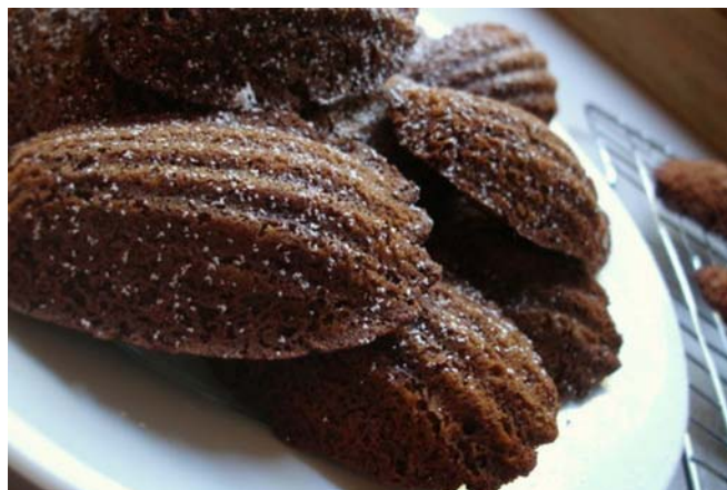
8. ábra. Csokoládés madeleine

A tészta elkészítése előtt a madeleine sütőformákat vékonyan kikenjük vajjal. A csokoládét olvasszuk fel és adjuk hozzá az előzőleg kihabosított vajhoz– A tojásokat egybe engedjük le, majd a kristálycukorral verjük habbá. A tojáshabot és a vajas csokoládét óvatosan forgassuk össze, majd végül fakanál segítségével keverjük bele a liszttel elkevert és átszitált kakaóport. A masszát töltjük a sütőformákba és előmelegített (180°C-os) sütőben süssük meg. A kihűlt süteményeket meghinthetjük porcukorral vagy vékonyan kenjük meg felületüket csokoládéval.