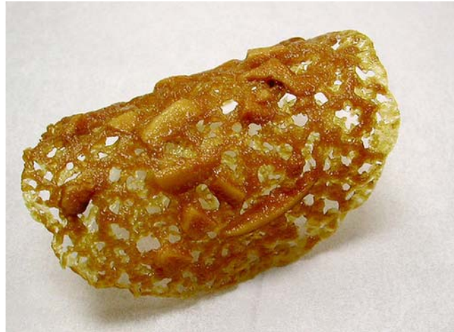
5. ábra. Moszkauer

A dió egyik részét finomra, a másik felét durvára őröljük meg. A cukrot, a narancshéj pépet, a vajat, a tejszínt és a diót egy üstben felhevítjük, beleöntjük a lisztet és lereszteljük. Kihűlés után vékonyan zsírozott-lisztezett sütőlemezre vagy szilikonpapírral fedett sütőlemezre kis halmokat nyomunk simacsöves nyomózsákból, és rumba mártogatott villával kissé ellapítjuk. Ezt a műveletet el lehet hagyni, ha kissé lágyabbra készítjük a tésztát. Ennél a süteménynél is fontos szabály, hogy végezzünk próbasütést!