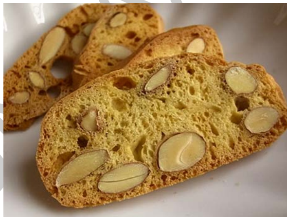
7. ábra. Biscotti

Az összes anyagból képlékeny tésztát gyúrunk, majd 2–3 cm széles rudakat sodrunk a tésztából. Előmelegített, 180 °C-os sütőben világosbarnára sütjük. Kihűlés után a tészta rudakat 1 cm széles szeletekre vágjuk, lapjára fektetve, újból sütőlemezre helyezük és gyengébb sütőben újból megsütjük. Sütés után nedvességtől elzárt helyen tároljuk. Ezt a fajta süteményt csak akkor tegyük a kínálatba, ha italt is szolgálunk fel (pl.kávészünetben) mellé. Olaszországban ezt a sütemény bor mellé kínálják.