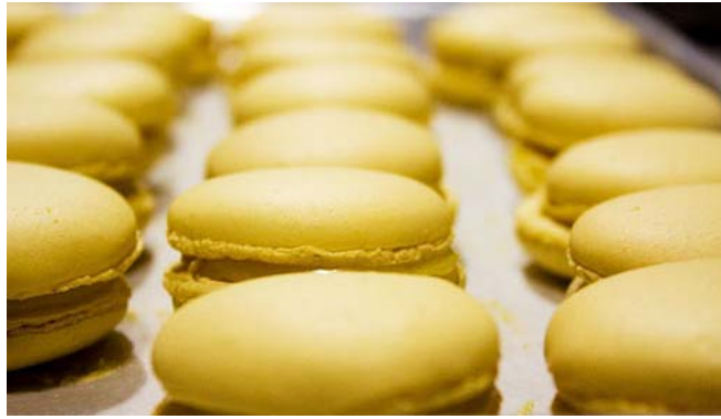
11. ábra. Macaron

A II. anyagcsoport anyagaiból készítsünk windmasszát, majd keverjük el az előzőleg elkészített mandulás keverékkel. Az elkészült masszát a néró tésztához hasonlóan formázzuk szilikonpapírral fedett sütőlemezre. A formázást követően pihentessük a tésztát legalább 1 órán keresztül, majd előmelegített sütőben 160°C-on süssük. A tészta akkor jó, ha a papírról könnyedén leválasztható. A színes macaronokat úgy készítjük, hogy a cukorszörp készítésekor adjuk a festéket hozzá. A színezésnek megfelelően töltsük tartós töltelékkel például trüffel krémmel. Az ízesítésnek szinte végtelen variációja lehetséges.