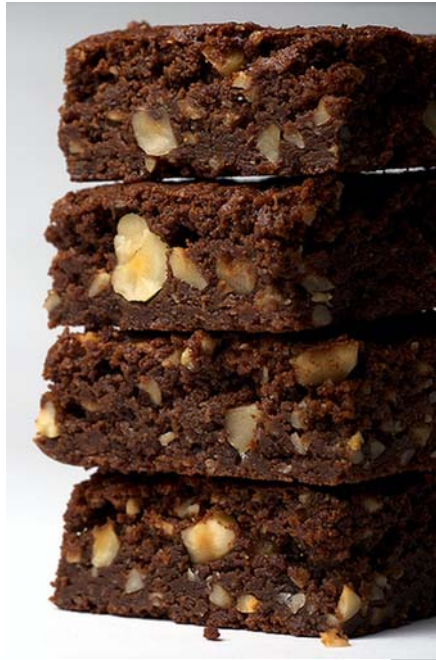
9. ábra. Brownie

Legvégül fakanál segítségével belekeverjük a lisztet és a diót. Sütőpapírral bélelt keretbe töltjük és előmelegített sütőben 180°C-on lágyra sütjük. A sütőből kivéve hűlni hagyjuk, majd apró kockára vágjuk. Tetejét a felvágás előtt csokoládéval is bevonhatjuk.