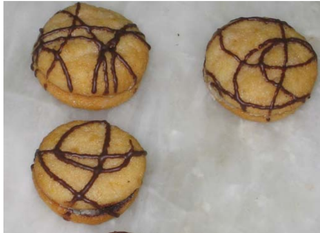
2. ábra. Narancsgalet