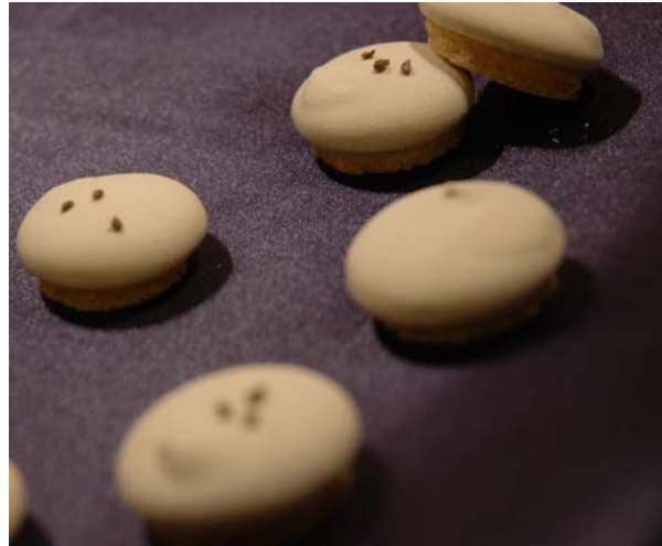
3. ábra. Estike teasütemény