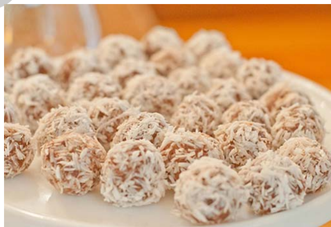
6. ábra. Mini kókuszgolyó

Tortaposzti nemes hulladékból vagy kekszörleményből rumos ízesítésű tésztát készítünk. A tésztakészítés során felhasználunk még barackízt, kakaóport vagy esetleg pörkölt olajos magvakat. A tésztából 10–15 g súlyú kis golyókat formázunk, melyek felületét vékonyan bevonunk csokoládéval és a kívánt panírozó anyagba (kókusz, dió, mandula, stb.) forgatjuk.