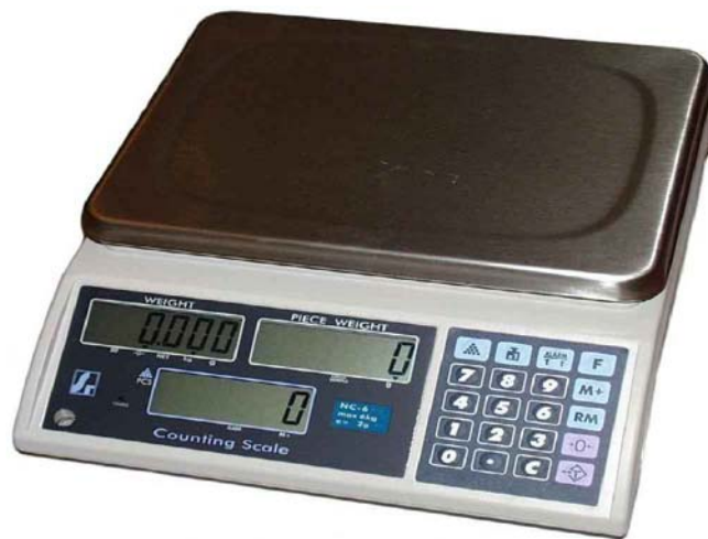
1. ábra. Digitális mérleg 1

A pontos mérés (súly, úrtartalom) az egyetlen része az élelmi anyagok előkészítésnek, amelyben ugyanúgy járunk el. Minden egyéb előkészítő művelet specifikus. Egyes termékeket hűteni, másokat épp ellenkezőleg melegíteni kell. Van olyan alapanyag, amelyet megmosunk, olyan is van, ami tönkremegy, ha víz éri. Van, amelyet darabolunk, vagy más módon aprítunk, bizonyos élelmi anyagokat egészben használunk fel. Bármilyen jellegű is legyen az alap, vagy járulékos anyagunk a gondos előkészítés elengedhetetlen a további feldolgozáshoz. Ne feledkezzünk meg a munkaszervezésről sem, így a gyártástechnológia során szükséges eszközöket, gépeket, és berendezéseket is megfelelően elő kell készíteni!