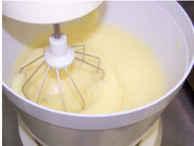
3. ábra. Pudingkrém