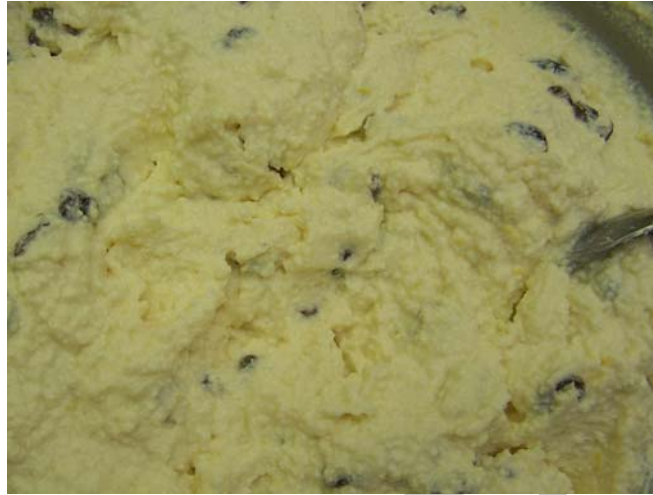
9. ábra. Túrótöltelék

Az előkészített túrót összekeverjük az összes alap-, és járulékos anyaggal, kevés pihetés után felhasználható. Túrós táska, Karlsbadi túrós (ökörsem), rétes, pite, lepény, bukta tölteléke.