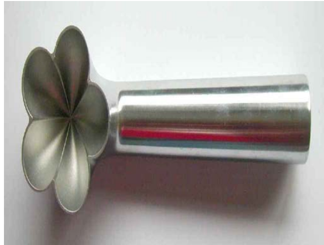
5. ábra. Virág alakú adagolókanál