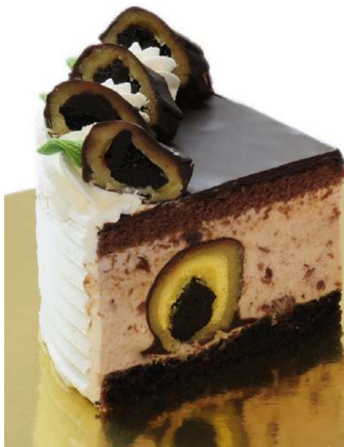
7. ábra. Tejszínes szilvakrémmel töltött torta (az Ország tortája 2010-ben) 2