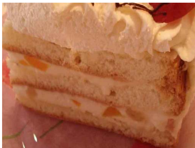
6. ábra. Tejszínes túrókrémmel töltött sütemény