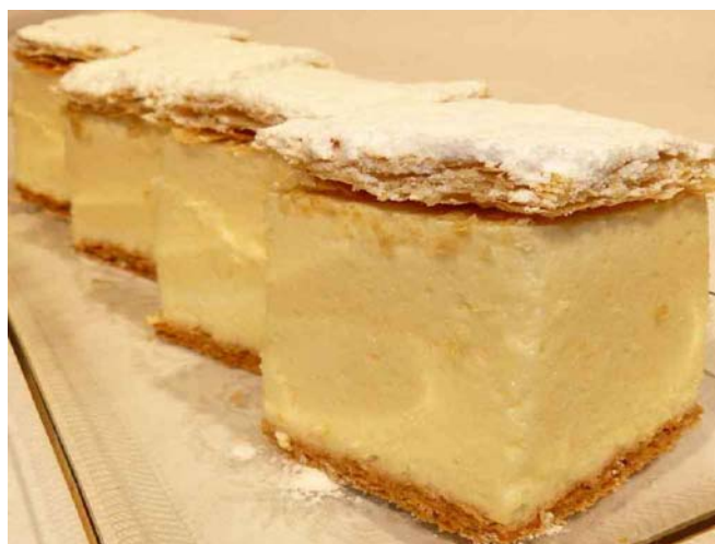
2. ábra. Krémes