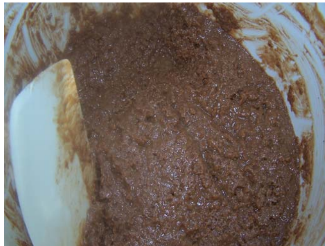
10. ábra. Ostyatörmelék

A megolvasztott nugátot, csokoládét és az ostyatörmeléket összekeverjük. Piskótalapra kenve alsó töltékként használjuk. Keretben kifagyasztva, darabolva bonbon alapja is lehet.