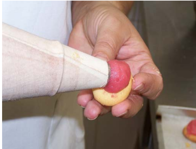
12. ábra. Rummal puhított marcipán adagolása nyomózsákból