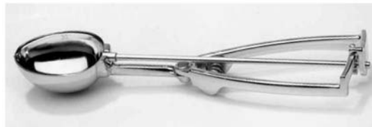
4. ábra. Hagyományos és ovális alakú adagolókanál