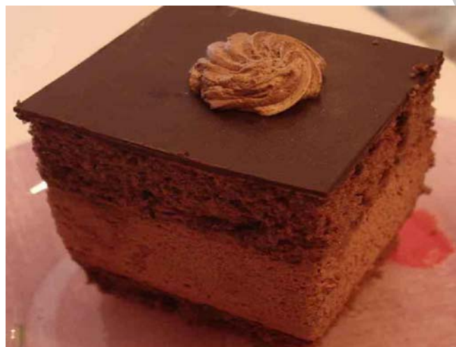
8. ábra. Rigójancsi szelet

Ezt a hagyományőrző magyar cukrászati készítményt mindenki jól ismeri. A legtöbb süteményespult kínálatában szerepel. Sokféle, sokféleképpen készítik a töltelékét. Készülhet csokoládéval, párizsi krémmel, vagy kakaóporral is.