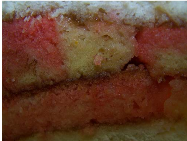
11. ábra. Puncstöltelék