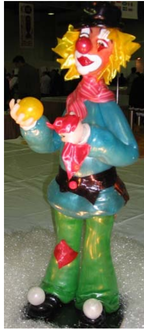
5. ábra Húzott és fúvott karamellból készült díszmunka