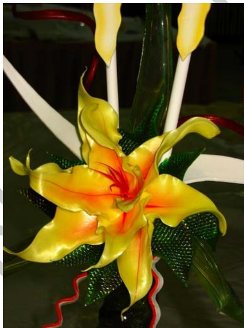
1.ábra Karamell virág

Nem is olyan régen (120–150 éve) még hatalmas luxusnak számított a cukor otthoni használata. Napjainkban pedig már szinte elképzelhetetlen nélküle az élet. A cukrászok az édesítésen kívül még díszítéshez, dekorációk készítéséhez használják a cukrot. Sok ember el sem tudja képzelni, hogyan tudnak a cukrászok "egyszerű" kristálycukorból csodaszép díszeket készíteni. Szeretnéd megismerni a titkot?