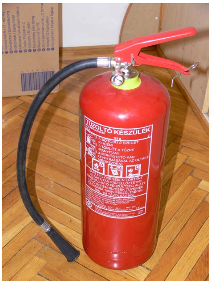
12. ábra. Beütőszeges tűzoltó készülék

Erőteljesen rá kell ütni a beütő szegre. A gáz kiáramlása hallható, ekkor keveredik az oltóanyaggal és fellazítja azt. Pár másodperc után a készülék üzemképes lesz. A palackon található tömlő végén elhelyezett pisztolyt a tűzre irányítva, annak lenyomásával kilövell az oltóanyag.