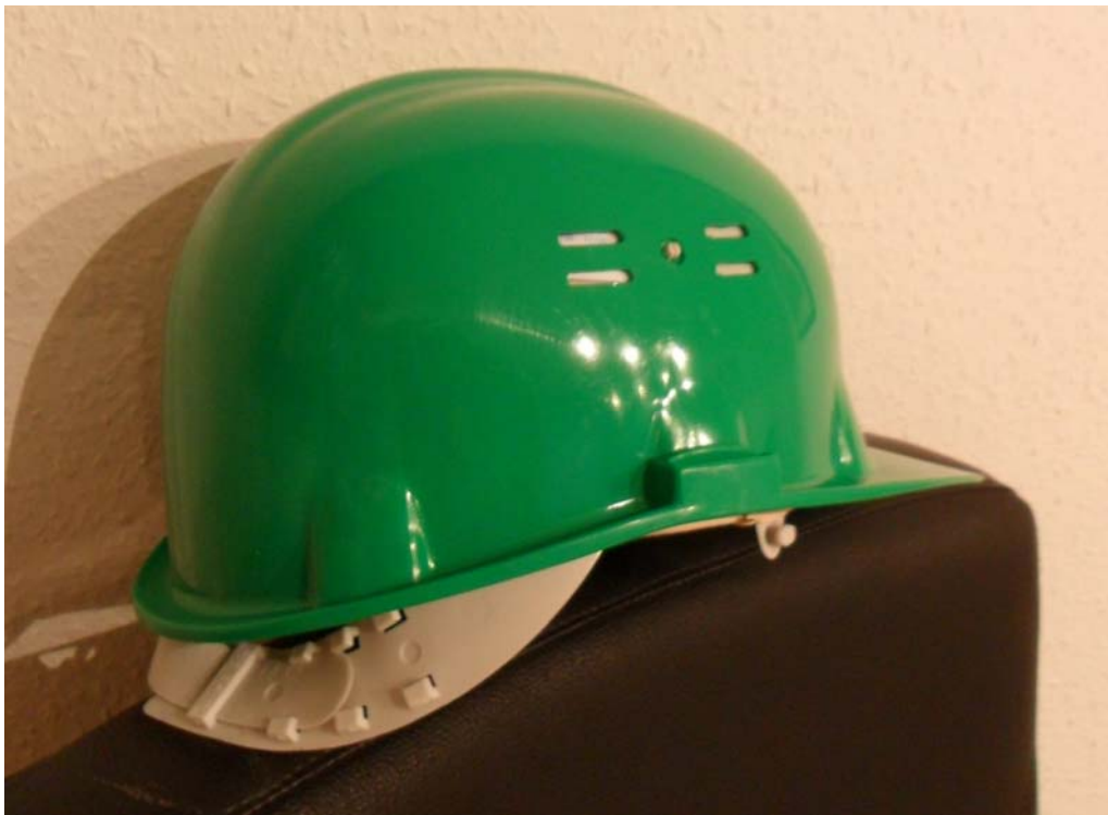
2. ábra. Védősisak