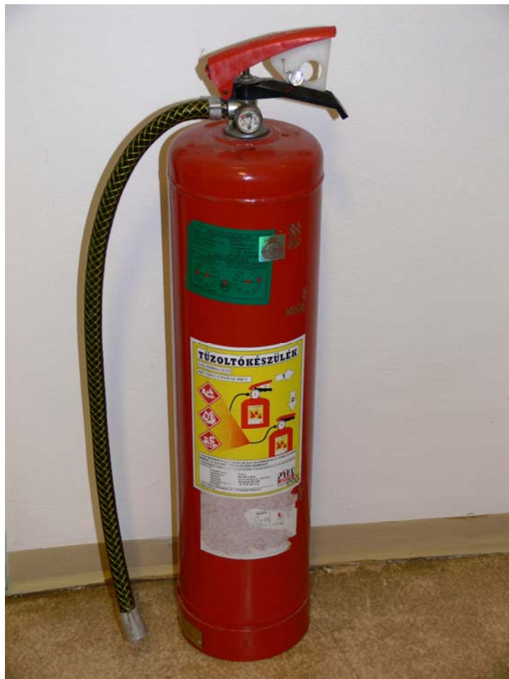
13. ábra. Fejszelepes indítású készülék

A palack tetején van a hordozó fogantyú, ezen található az indító kar, melynek – a biztosító szeg eltávolítása utáni – lenyomásával elindul az oltóanyag. A tömlő végét a tűzre kell irányítani a másik kézzel. E típusú készülékeken található egy nyomásmérő óra is, mely a palackban uralkodó pillanatnyi nyomás értékéről tájékoztat bennünket.