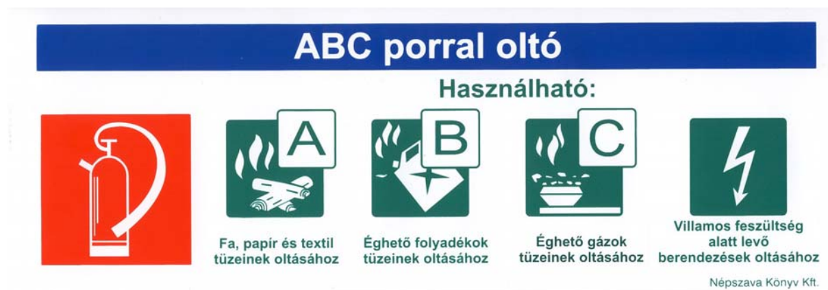
11. ábra. ABC por töltetű tűzoltó készülék táblája a készülék felett

A tűzoltó készülékeket, felszereléseket, a tűzjelző és oltóberendezéseket a hatályos jogszabályban, szabványokban foglalt biztonsági jellel, utánvilágító vagy világító biztonsági jellel kell megjelölni.