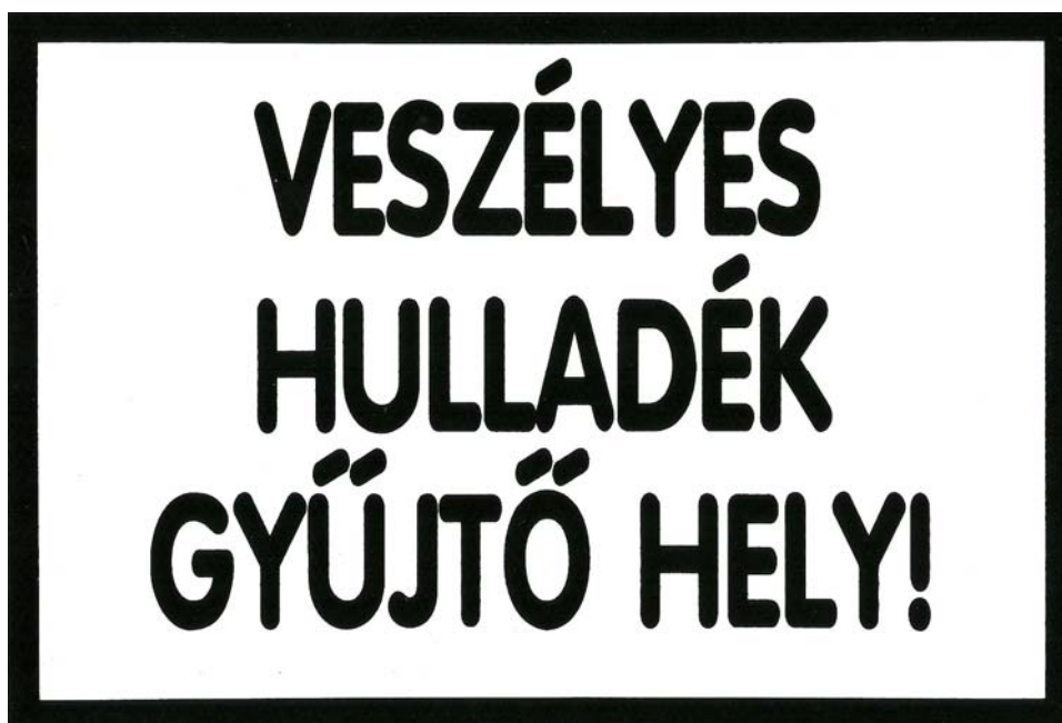
14. ábra. Veszélyes hulladék gyűjtőhely jelölése

Hulladékgyűjtő udvar: a lakosságtól származó, továbbá a termelőnél kis mennyiségben keletkező (500 kg/év) veszélyes hulladékok gyűjtésére szolgáló létesítmény, ahol a veszélyes hulladék legfeljebb 1 évig tartható.