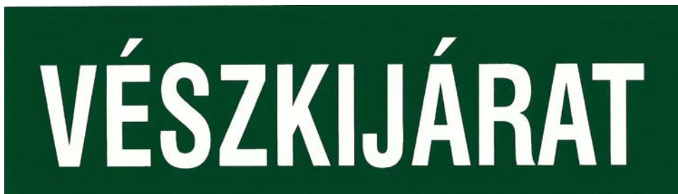
4. ábra. Vészkijárat szabályos jelzésére szolgáló tábla

Közérzetünk, munkavégzésünk hatékonysága szempontjából nagyon fontos tényező a munkahelyi hőmérséklet. Hideg (pl. hűtőkamrában, hűtőpult közelében, téli időszakban szabad téren) végzett munka során a munkáltatónak a hideg elleni védelem céljából megfelelő ruházatot, lábbelit, védőitalt (meleg teát), melegedésre alkalmas helyen munkaszünetet kell biztosítania.