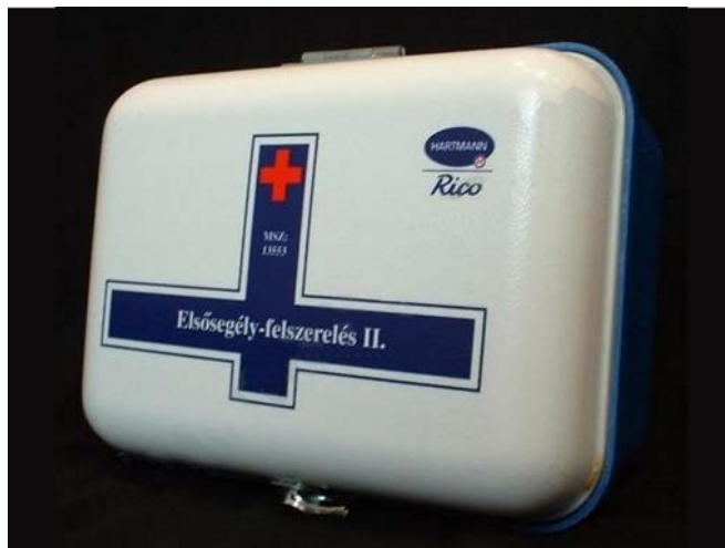
5. ábra. Munkahelyi elsősegély-felszerelés

A munkahelyek munkavédelmi követelményeinek minimális szintjéről szóló rendelet 6 előírásai szerint: