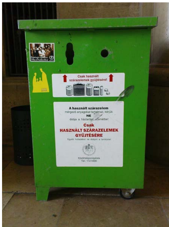
15. ábra. Veszélyes hulladék gyűjtő

A gyűjtés során esetleg bekövetkezhető, a környezetet veszélyeztető üzemzavar, illetve baleset következményeinek csökkentésére és elhárítására intézkedési tervet kell készíteni.