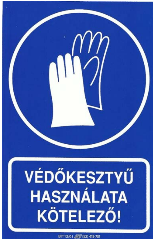
3. ábra. Védőkesztyű kötelező használatát jelző tábla