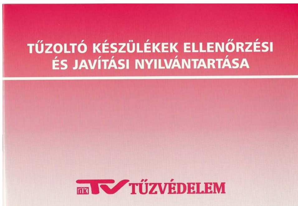
10. ábra. Tűzoltó készülék napló

A tűzoltó készülékeket, felszereléseket, a tűzjelző és oltóberendezéseket a hatályos jogszabályban, szabványokban foglalt biztonsági jellel, utánvilágító vagy világító biztonsági jellel kell megjelölni.