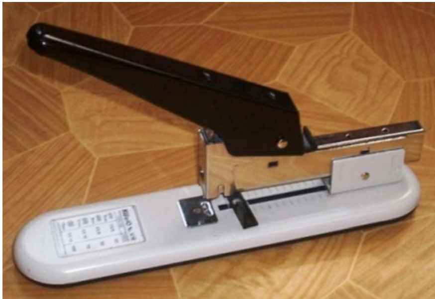
15. ábra. Ipari tűzőgép

Amikor egy-egy vastagabb mappát szeretnénk összekapcsolni, ipari tűzőgépek segíthetik a munkánkat, ezekkel több lapot (10–50db) is összekapcsolhatunk egyszerre