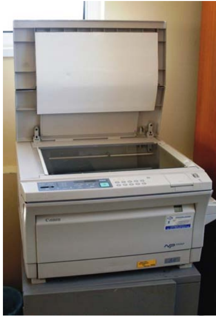
4. ábra. Asztali fénymásoló