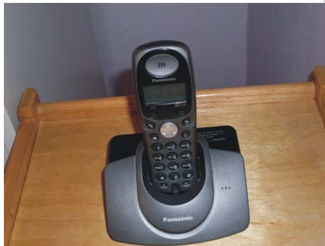
3. ábra. Vezetékes telefon

A vezetékes telefonok elengedhetetlenek egy működő vállalkozás esetében. Ezek a telefonok már nemcsak telefonálásra használhatók. Előnyük , hogy faxolásra, üzenetrögzítésre, hívás-átirányításra is alkalmasak. Sokszor egyetlen telefonkészülék telefonközpontként is üzemelhet. Egyre elterjedtebbek az ISDN-vonalak. A távközlési szolgáltató egy vezérszámot és további hívószámokat biztosít a vállalkozások részére. A vezérszám a központ üzemkiesése esetén is működik. Ma már az ISDN elsősorban azon felhasználók számára jó választás, akik két - vagy a vonal teljesítményétől függően - több telefonvonalat kívánnak használni, mivel egy ISDN-vonal fenntartása olcsóbb, mint két, illetve a vonal tudásának megfelelő számú önálló analóg előfizetés díja. Hátrányuk , hogy ezeket a készülékeket nem lehet tetszőleges helyre elhelyezni, mivel a telefonzsinór és a vételezési hely befolyásolja ezt. Amennyiben megváltozik a vállalkozás székhelye, külön kell kérni a telefonvonalak áthelyezését.