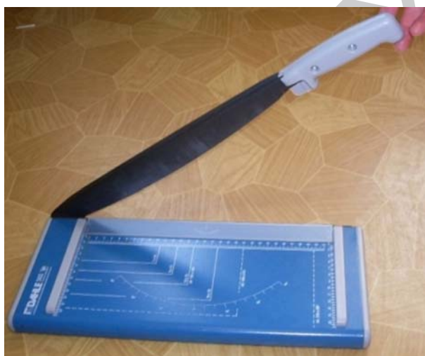
18. ábra. Karos vágógép

Az iratok nagyon sok félek lehetnek nagy segítség a hosszított karú tűzőgép, olyan dokumentumoknál melyet csak ezzel tudunk összetűzni.