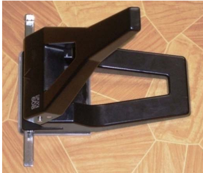
13. ábra. Kétlyukú lyukasztó

Az iratok archiválásánál fontos szerepet töltenek be az irattárolók, hiszen egy ügyben többoldalas dokumentációra is szükség lehet. Ilyenkor fontos, hogy egy iratmappába kerüljön minden egyes dokumentum és ne vesszen el egyetlen egy lap sem. A lefűzhető genothermek, gyorsfűzők, gumis mappák, iratvédő tasakok, iratrendezők.