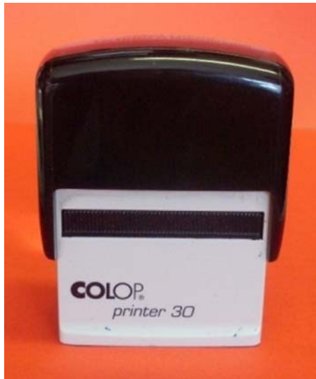
21. ábra. Négyzet alakú bélyegző