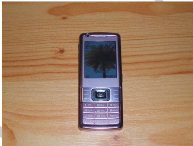
2. ábra. Rádióhullámú telefon Samsung SGH-L700

Ma már a mobiltelefonok világát éljük, szinte minden felnőttnek van mobiltelefonja, és a gyerekek körében is egyre fiatalabb kortól jellemző a saját mobiltelefon. Előnye mindenesetre az, hogy bárhová magunkkal vihetjük és használhatjuk. A modern telefonok már nemcsak telefonálásra alkalmasak, hanem saját feljegyzések készítésére, határidőnaplóként, internetezésre, konferenciabeszélgetések lebonyolítására stb. Hátrányként talán az róható fel, hogy bizonyos területeken, ahol nincs a szolgáltatók által sugárzott megfelelő térerő, nem használhatók, illetve bizonyos időnként fel kell tölteni az akkumulátoraikat és ehhez áramforrásra van szükség.