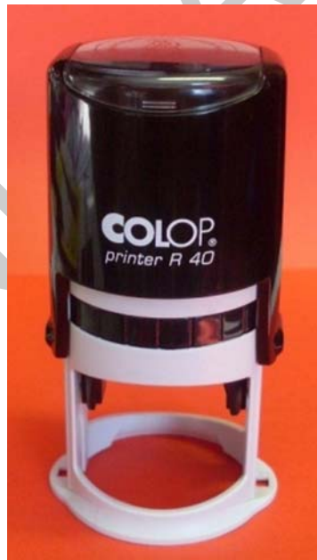
20. ábra. Kör alakú automatabélyegző

A cégek minden esetben rendelkeznek bélyegzővel, ezek használatával és a hivatalos aláírásokkal tudják hitelesíteni saját dokumentumaikat. A pecsét szövegei törvény vagy rendelték által szabályozottal, de készíthetnek a gazdálkodó szervezetek saját csak a vállalkozáson belül használt pecsétet is. A pecsétet elzárt helyen kell őrizni, hogy illetéktelenek ne tudják azokat felhasználni.