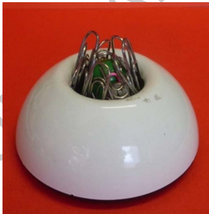
16. ábra. Gemkapocstartó

Amikor egy-egy vastagabb mappát szeretnénk összekapcsolni, ipari tűzőgépek segíthetik a munkánkat, ezekkel több lapot (10–50db) is összekapcsolhatunk egyszerre