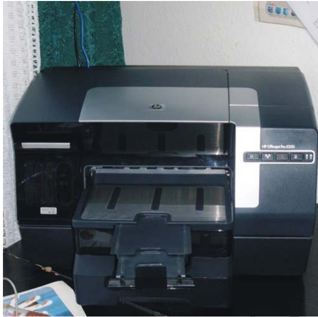
6. ábra. Tintasugaras nyomtató