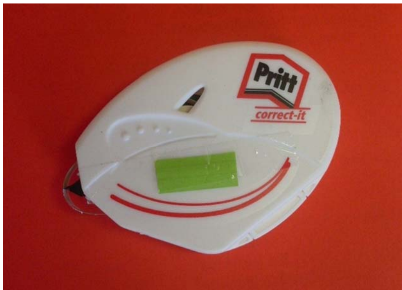
9. ábra. Hibajavító roller "PRITT"

A titkárnők, menedzserasszisztensek napi munkájukhoz az irodatechnikai gépeken kívül rendkívül sokféle egyéb segédeszközt használhatnak. Ezek az eszközök megkönnyíthetik az iratok közötti eligazodást, a jegyzetelést és a minél gyorsabb visszakeresést.