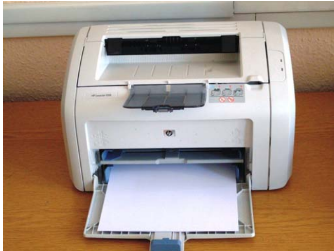
7. ábra. Lézernyomtató

A lézernyomtatók legfontosabb alkatrésze a toner, mely tartalmazza a nyomtatás során használt festéket. Hátrányuk , hogy közülük néhányat nem lehet utántölteni, hanem újat kell vásárolni, viszont ezek árai elég magasak. Ezekben a nyomtatókban azonban ajánlatos csak olyan papírt használni, amelynek a csomagoláson fel van tüntetve, hogy a lézeres nyomtatókra nem károsak. A nyomtatás minőségét dpi-ben (pontok száma hüvelykenként) adják meg a gyártók, a manapság használatos nyomtatóknál ez az érték nincs 600 alatt. Előnyük viszont, hogy egyetlen tonerrel több ezer oldalt ki lehet nyomtatni, nagy teljesítményűek és gyorsak, pontosak, jó minőségű nyomtatást tudnak előállítani.