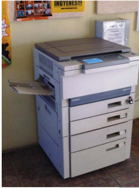
5. ábra. Nagy teljesítményű fénymásoló