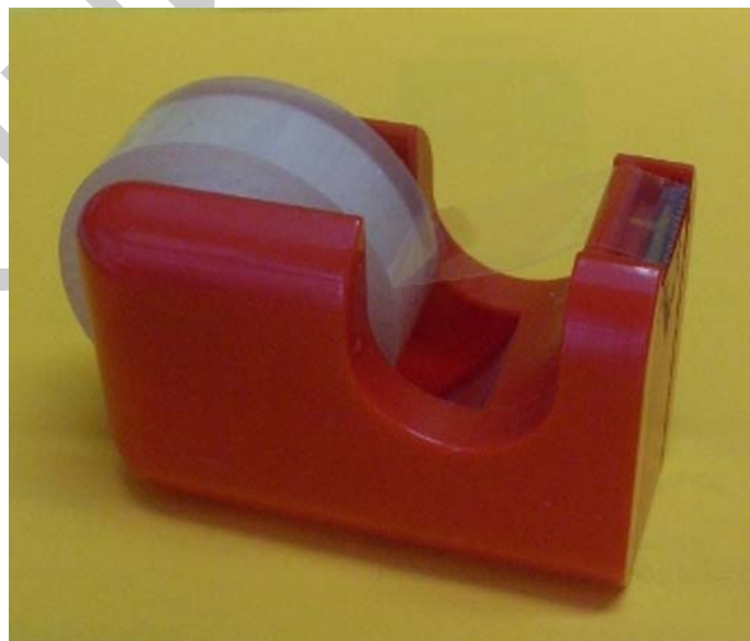
12. ábra. Cellux tépő ragasztószalaggal

Az iratok kezelése közben szükség van ezekre a tárgyakra is. Napjainkban egyre modernebb fajtáival találkozhatunk az üzletek polcain. A környezet védelme is egyre nagyobb szerepet játszik az előállításuk során.