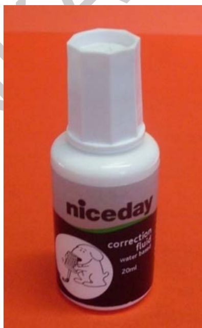
10. ábra. Hibajavító folyadék

A titkárnők, menedzserasszisztensek napi munkájukhoz az irodatechnikai gépeken kívül rendkívül sokféle egyéb segédeszközt használhatnak. Ezek az eszközök megkönnyíthetik az iratok közötti eligazodást, a jegyzetelést és a minél gyorsabb visszakeresést.