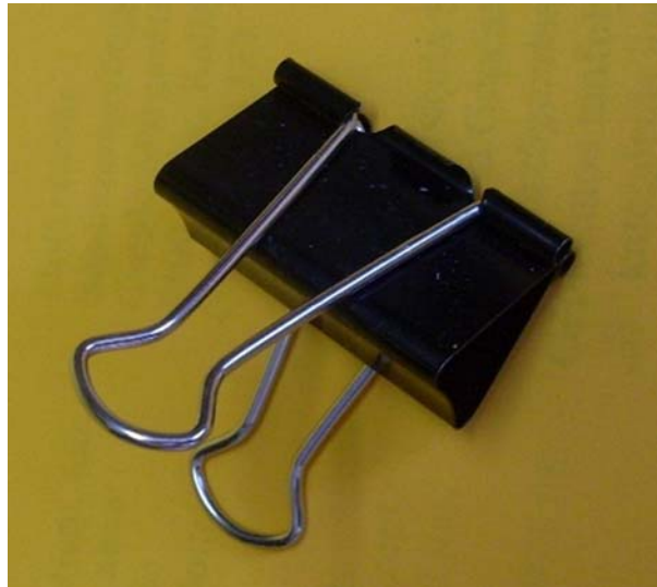
11. ábra. Binder kapocs

Az iratok kezeléséhez elengedhetetlenül szükségesek. A tollak, ceruzák, radírok, filctollak, rostiron, zselés tollak, flipchart markerek, táblafilcek, stb. Az íróeszközök megfelelő minősége is fontos, hiszen a feljegyzések egyes iratokon akár több évig is olvashatónak kell maradniuk. Az azonnali jegyzeteléshez pedig többféle íróeszközre is szükség lehet nap, mint nap.