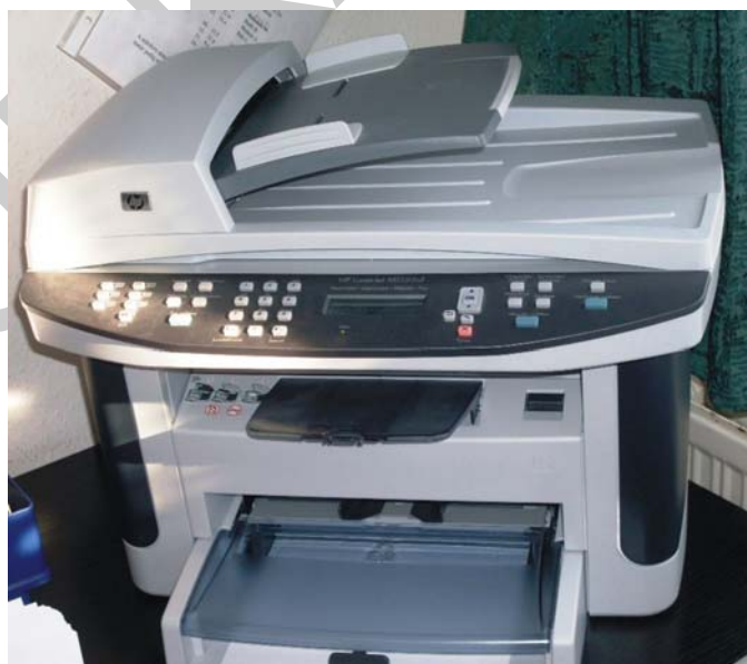
1. ábra. Multifunkciós fax

A multifunkciós faxok nem csak az alaptevékenységükre használhatók, hanem a tervezők és a gyártók egyéb funkciókkal is ellátták. Ezekkel az eszközökkel faxolhatunk, nyomtathatunk, másolhatunk és szkennelhetünk is. A modern irodatechnikai eszközök nélkülözhetetlen tartozéka, melyek már fekete és színes nyomtatáshoz egyaránt használhatók. Előnye, hogy egyetlen berendezéssel több műveletet el tudunk végezni. Négy gép helyett csupán egyet kell megvásárolni, így helyet takaríthatunk meg, illetve pénzt is spórolhatunk. A multifunkciós faxok a szkennereket is kiválthatják, hiszen ez a funkció már be van építve a korszerű multifunkciós faxgépekbe.