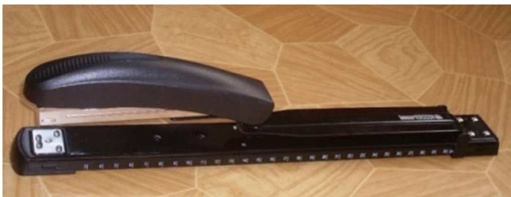
17. ábra. Tűzőgép hosszított karral

Az iratok nagyon sok félek lehetnek nagy segítség a hosszított karú tűzőgép, olyan dokumentumoknál melyet csak ezzel tudunk összetűzni.