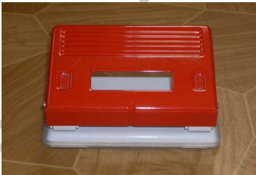
14. ábra. Kis, irodai lyukasztó

Az iratok archiválásánál fontos szerepet töltenek be az irattárolók, hiszen egy ügyben többoldalas dokumentációra is szükség lehet. Ilyenkor fontos, hogy egy iratmappába kerüljön minden egyes dokumentum és ne vesszen el egyetlen egy lap sem. A lefűzhető genothermek, gyorsfűzők, gumis mappák, iratvédő tasakok, iratrendezők.