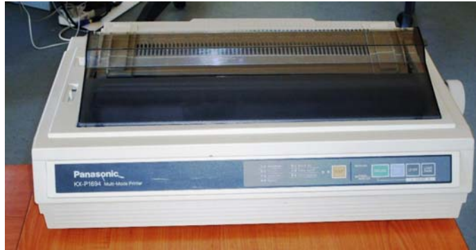
8. ábra. Mátrixnyomtató