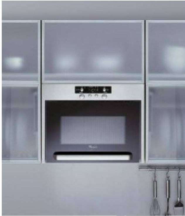
17. ábra. Konyhabútorba építhető inox kivitelű mikrohullámú készülék 17

A kereskedelmi forgalomban olyan készülékekkel is találkozhatunk, melyek úgynevezett kombinált mikrosütők. Oldalukon kenyérpirítóval, vagy tetejükön elektromos főzőlappal rendelkeznek.