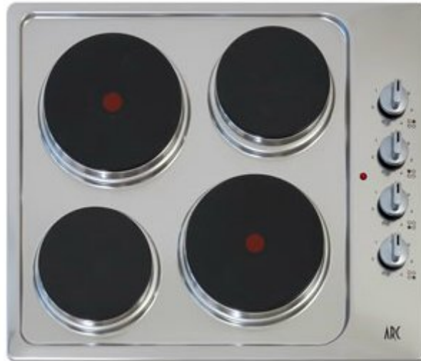
5. ábra. Elektromos főzőlap inox felülettel 5

Az elektromos főzőlapok alatt a hagyományosnak számító nemesacél felületű, öntöttvas főzőzónákkal rendelkező készüléket értjük. Ezek használata nem energiatakarékos. Csak abban az esetben gazdaságos az üzemeltetésük, ha a főzésnél számolunk a maradék hővel, vagyis még azelőtt kikapcsoljuk a főzőlapot, mielőtt az étel elkészült volna. Tisztításuk sem túl egyszerű, ám a gázfőzőlapokhoz képest még mindig könnyebb.