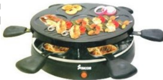
14. ábra. Hatszemélyes, kör alakú raclette grill 14

A hőkezelés módja szerint kombinált hőátadású készüléknek számít a raclette grill . Az ezzel való sütés családi, társas összejövetelek programja is lehet. A 4–8 személyes grillezőn mindenki saját maga készítheti el egyéni ízlésének megfelelő ételét. A raclette készülékek kaphatók szögletes és kerek kivitelben is. Lapos tállal, bordás lappal, egyes típusokat ínyenc kőlappal látnak el.