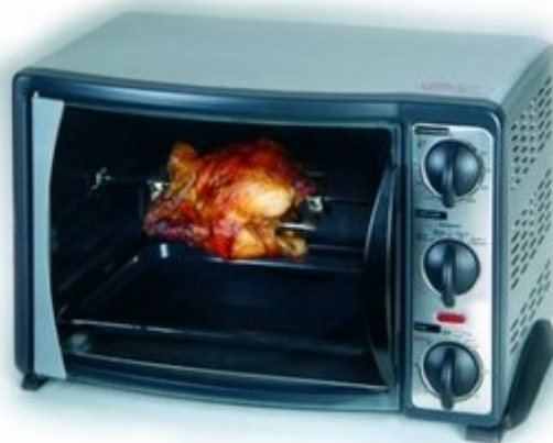
13. ábra. Inox kivitelű forgónyársas grillsütő 13

A sugárzó hőátadással működő készülékek közül legismertebb a forgónyársas grillsütő , mely hús sütésére alkalmas. Ezeket a termékeket időzítővel, hőmérséklet szabályozóval, vagy teljesítményszabályozókkal látják el. A könnyű tisztíthatóság érdekében öntisztító zománcbevonattal rendelkeznek. A sugárzó hőátadású grillezők magas, 600–800°C között működnek.