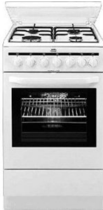
1. ábra. Gáztűzhely1

Hátrányként értékelhető, hogy a konyha higiénijája közepes, valamint a tűzhely tisztítása is közepesen nehéz. A mai készülékeket bimetál vagy termoelektromos égésbiztosítóval látják el, így ha a láng kialudt, a gázáramlás megszűnik, ezáltal biztonságosabb a tűzhely.