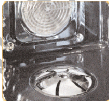
11. ábra. Gőzsütővel kombinált beépíthető sütőkészülék belülről 11

A beépíthető készülékek vásárlása esetén hívjuk fel a vevő figyelmét a következőkre: