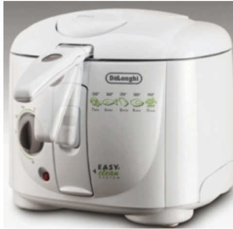
19. ábra. Fritőz készülék 19

Energia és olajtakarékosak azok a fritőzök, melyek döntött kosárral rendelkeznek. A közelmúltban jelent meg az a típus is (actifry), amelyik szinte néhány kanál olajban képes elkészíteni az ételt. Az egyedülálló rendszerben, melyben a forró levegő a főzőtérben és a keverőlapátok mentén kering, 1 kg hasáburgonya elkészítéséhez csak 1,4 cl, egyszer használatos olajra van szükség, végeredményként pedig egyenletesen átsült hasábokat kapunk, amelyek zsírtartalma csupán 3%.