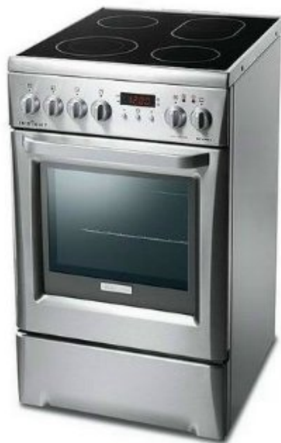
2. ábra. Villanytűzhely inox kivitelben, üvegkerámia főzőlappal

Kezelésük egyszerű és kényelmes. Hátrányuk azonban, hogy a hőfok lassabban szabályozható, mint a gáztűzhelyek esetében, valamint drágábbak is. Felmelegedése és lehűlése is több időt vesz igénybe. A modern sütők szabályozása egyszerű, mivel külön állíthatjuk be a kívánt hőmérsékletet és a sütési időt.