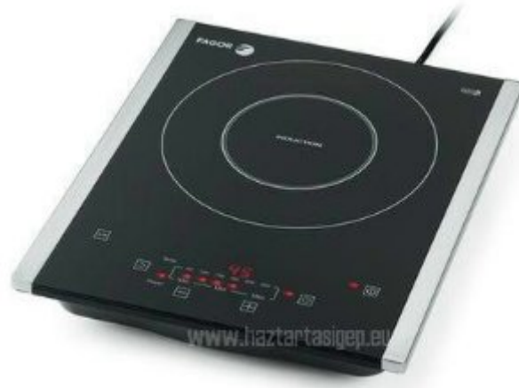
8. ábra. Hordozható indukciós főzőlap

A háziasszonyok szerint fontos, hogy könnyen és gyorsan lehessen tisztán tartani a főzőedényeket, és a főzőfelületet. Tekintettel arra, hogy ennél a technológiánál a főzőfelület soha nem forrósodik fel annyira, mint a hagyományos tűzhelyek esetén, az étel nem tud ráégni a felületre, ezért a kerámiafelületet és az edényeket is könnyű tisztítani. Nem beszélve arról, hogy felhasználó is sokkal hűvösebb hőmérsékletű környezetben készítheti el a főtt étkeket.