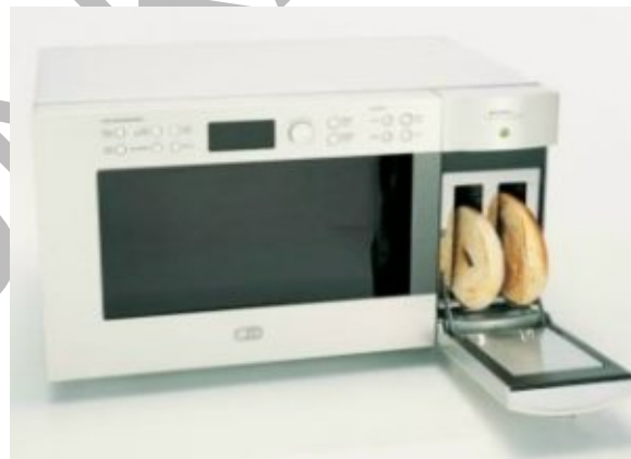
18. ábra. Kenyérpirítóval kombinált mikrohullámú sütő 18

A kereskedelmi forgalomban olyan készülékekkel is találkozhatunk, melyek úgynevezett kombinált mikrosütők. Oldalukon kenyérpirítóval, vagy tetejükön elektromos főzőlappal rendelkeznek.