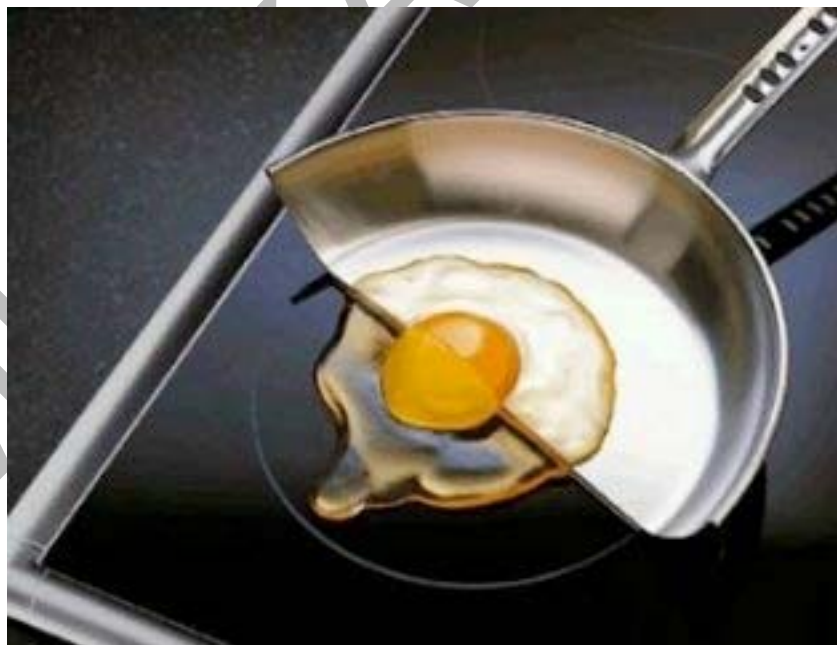
7. ábra. Az indukciós főzőlap csak ott melegít, ahol érintkezik a főzőedényel

Az indukció lényege, hogy az elektromos áram indukálása, előidézése a mágneses térerősség változtatásával, vagy a vezető mozgatásával a mágneses térben jön létre. Azaz, ha fémet helyezünk a mágneses mezőbe, akkor hő keletkezik. Teljesítményfelvétel, vagyis főzés csak akkor, és ott van, ahol az edény érintkezik a főzőfelülettel.