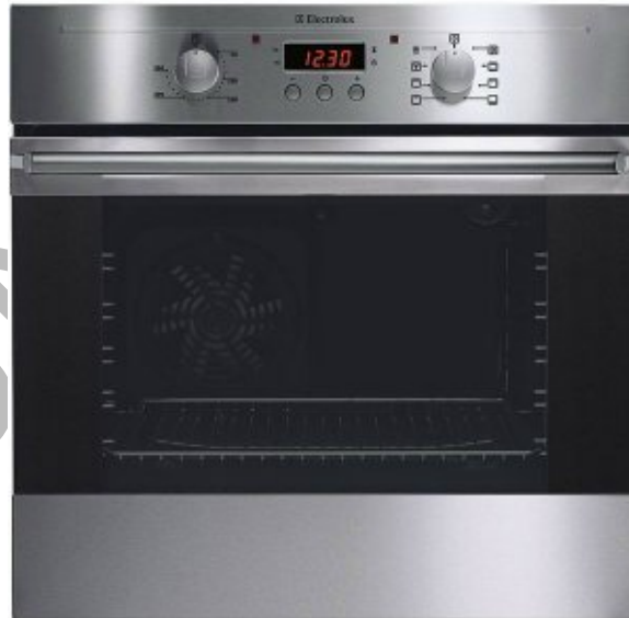
9. ábra. Beépíthető sütő inox kivitelben

A beépíthető sütők között – csakúgy, mint a tűzhelyek esetében – találkozhatunk gáz, és elektromos üzemelésűekkel, ám itt is az elektromos sütő az elterjedt.