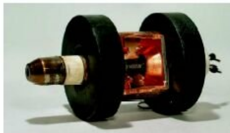
15. ábra. A magnetroncső 15

Az elektromágneses rezgés keltésére magnetroncsövet használnak.