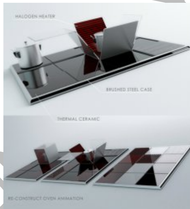
12. ábra. Sütő-főző készülék a jövőből 12