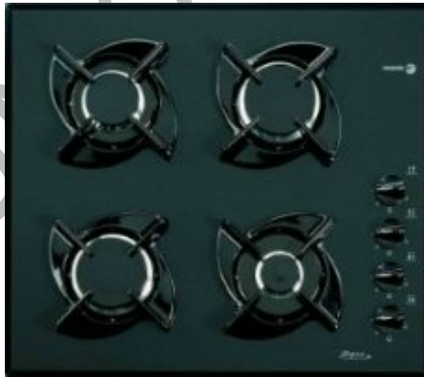
4. ábra. Gázfőzőlap üvegkerámia felülettel 4

A tradíciók kedvelői előszeretettel választják a gáz főzőlapokat. Az égőfejek teljesítménye jól szabályozható, így hőleadásuk azonnali. Nincs szükség speciális edényre a használatukhoz. A gyors melegedésnek és lehűlésnek köszönhetően az elektromos főzőlapoknál gyorsabbak. Ma már léteznek gázfűtéses kerámialapok is. Így egyesítik a gáz és az üvegkerámia főzőlapok előnyeit, vagyis a gyors, egyszerű használatot, és könnyű tisztíthatóságot.