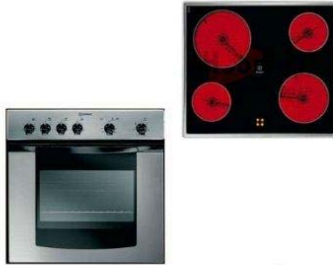
3. ábra. Beépíthető szett, üvegkerámia főzőlappal 3