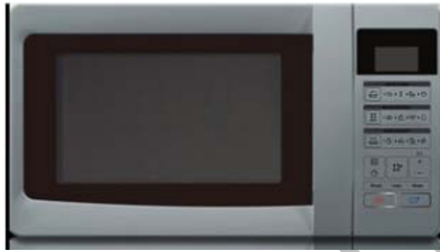
16. ábra. Érintőpaneles mikrohullámú készülék ezüst színben 16

A mikrók egy része mechanikus programórával rendelkezik, ám ez egy idő után elkophat, és a melegítési időt sem tudjuk pontosan beállítani. Ezért érdemesebb digitális programórájú készüléket ajánlani a vevőnek. Találkozhatunk elektromos kapcsolóval, vagy érintőpanellel. A digitális programóra előnye a pontosabb időbeállítás, és a tartósság. Az érintőpaneles készülékeket könnyű tisztán tartani, hiszen nincsenek kiemelkedő gombok. Valamennyi digitális programórás készülék rendelkezik digitális órával.