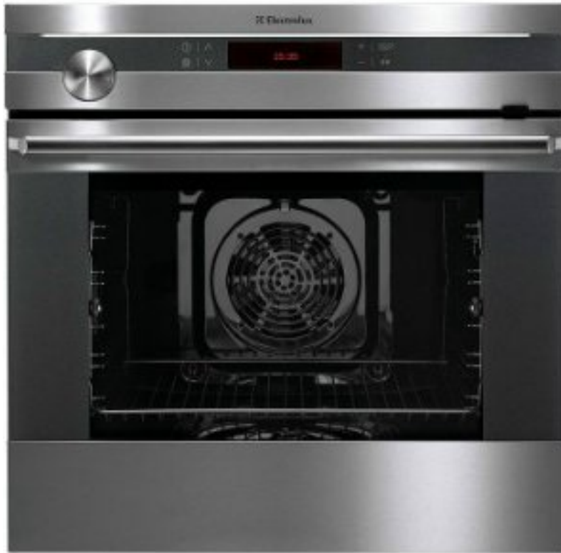
10. ábra. Gőzsütővel kombinált beépíthető sütőkészülék kívülről 10