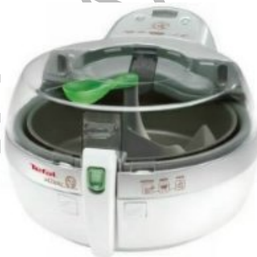
20. ábra. Actifry rendszerű olajsütő 20

Energia és olajtakarékosak azok a fritőzök, melyek döntött kosárral rendelkeznek. A közelmúltban jelent meg az a típus is (actifry), amelyik szinte néhány kanál olajban képes elkészíteni az ételt. Az egyedülálló rendszerben, melyben a forró levegő a főzőtérben és a keverőlapátok mentén kering, 1 kg hasáburgonya elkészítéséhez csak 1,4 cl, egyszer használatos olajra van szükség, végeredményként pedig egyenletesen átsült hasábokat kapunk, amelyek zsírtartalma csupán 3%.