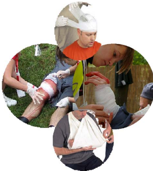
3. ábra. Baleseti sérülések ellátása kötözéssel

A baleset fogalma: A baleset az emberi szervezetet ért olyan egyszeri külső hatás, amely a sérült akaratától függetlenül, hirtelen vagy aránylag rövid idő alatt következik be és sérülést, mérgezést vagy más (testi, lelki) egészségkárosodást, illetőleg halált okoz.