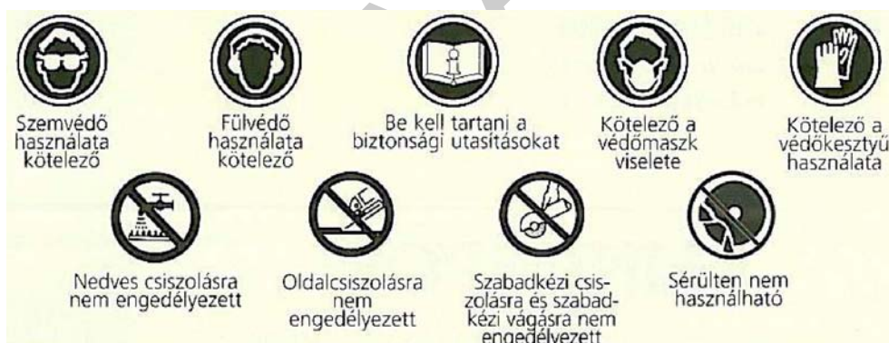
9. ábra. Jelölések értelmezése a köszörű- és vágótárcsákon