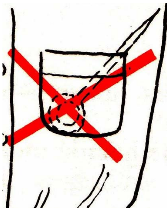
5. ábra. Rajztűt, kést, csavarhúzózt és más éles, vagy hegyes szerszámot ne tegyünk zsebre