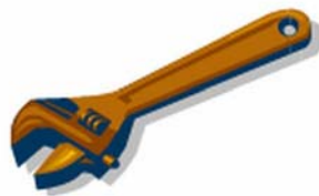
4. ábra. Csavarhúzó veszélyes és helyes használata