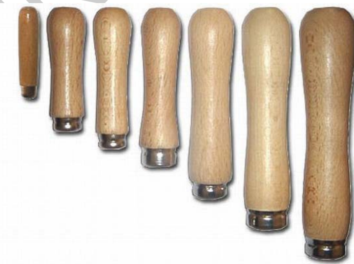
7. ábra. Különböző méretű reszelőnyelek