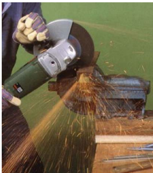
8. ábra. A köszörüléskor keletkezett szikra tüzet, robbanást is okozhat