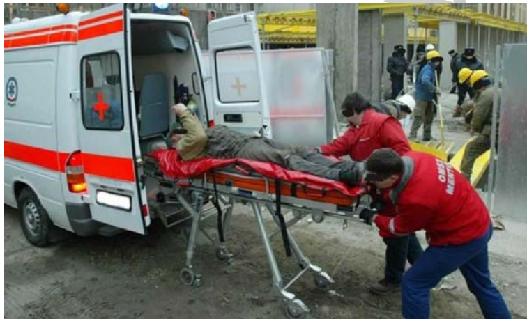
2. ábra. Senki sem akarja így elhagyni a munkahelyét!

A kéziszerszámok és a kézi kisgépek használata balesetveszéllyel jár amit helyes használattal és a megfelelő egyéni védőeszközök alkalmazásával előzhetünk meg. Fontos figyelembe venni azt is, hogy a helytelen használat során nem csak magunkat, hanem másokat is veszélybe sodorhatunk, és arra is figyelmet kell fordítanunk, hogy ne okozzunk anyagi károkat.