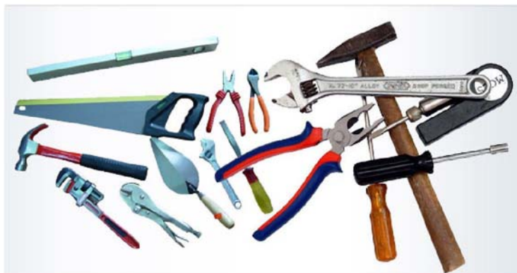
1. ábra. Kéziszerszámok, melyek szakszerűtlen használat esetén veszélyessé válhatnak

Ön egy olyan munkahelyen dolgozik, ahol mindennapos feladatként kell a gépekkel végzett műveletek előkészítésekor, vagy azokat követően kéziszerszámokkal, kézi kisgépekkel a munkadarabok megmunkálását elvégezni. Az egyik leggyakoribb feladat a forgácsolás során keletkezett sorja eltávolítása, de kisebb furatok fúrását, felületek tisztítását, csiszolását is gyakran kell kézi műveletekkel végezni. Munka közben szívesen használják a kisgépeket, amelyek jelentősen megkönnyítik a munkát, de nagy teljesítményük és erejük, magas fordulatszámuk miatt sok balesetet okoztak már, amit könnyen el lehetett volna kerülni. A helyes használattal gazdaságos lesz a munkavégzés, és baleset sem fog történni. az erre vonatkozó szabályokat foglaljuk össze ebben a fejezetben.