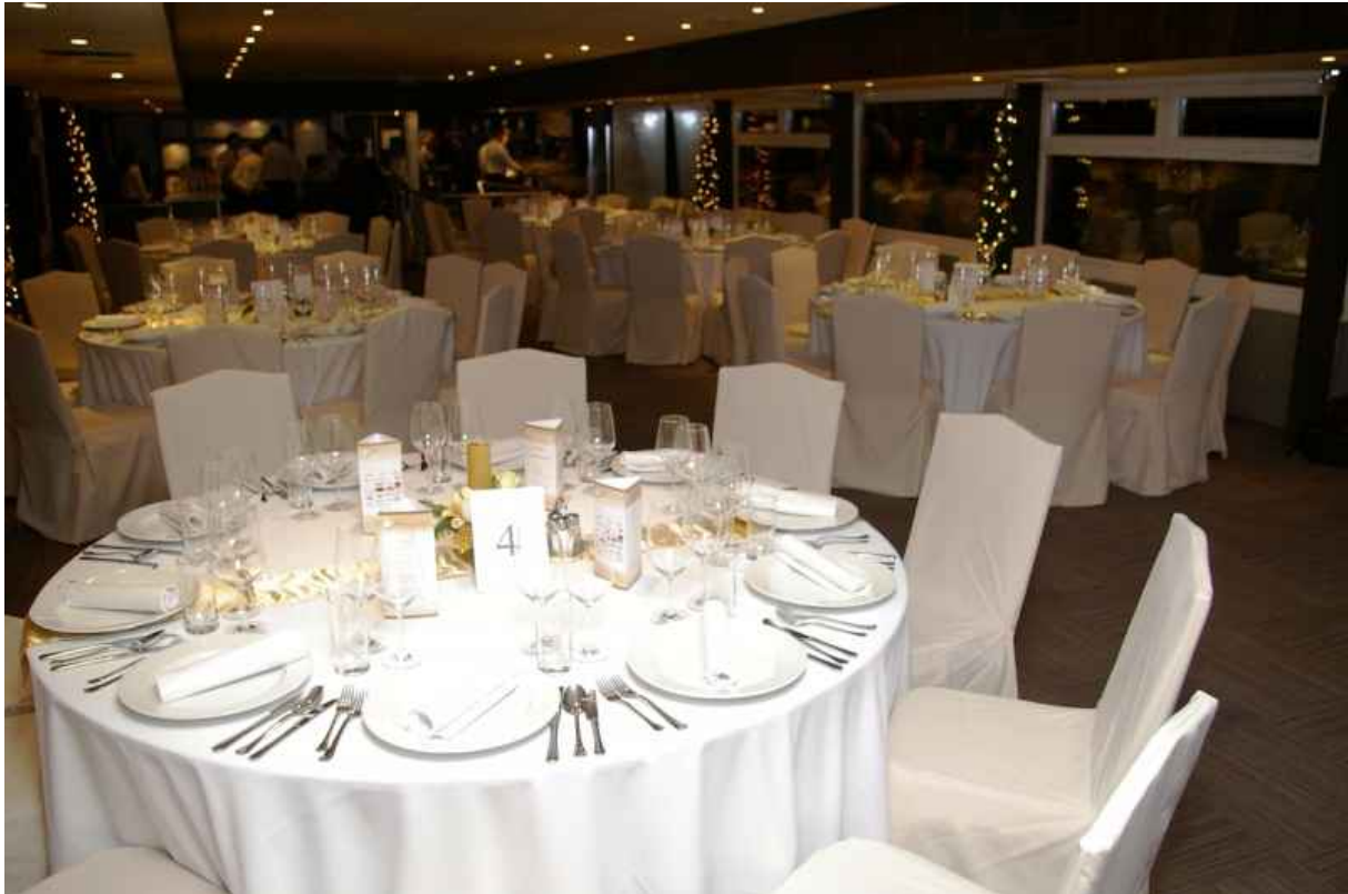
15. ábra: Karácsonyi parti dekorációja 4

A szilveszteri rendezvényeken marcipánokból készített szerencsepatkók, rózsaszín malacok lehetnek az asztaldíszek. A mennyezetről papír girlandok, lampionok függhetnek, az oszlopokat is díszítjük.