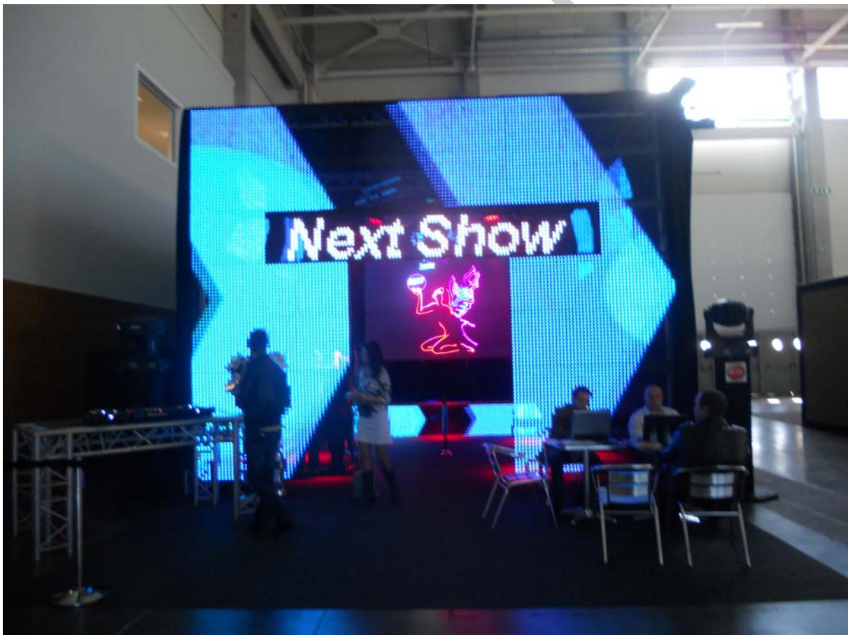
6. ábra: Feliratok kivetítése

A plakátok, tájékoztató feliratok számára függesztett, vagy állványos táblákat használhatunk. Ezeket a táblákat felhasználhatjuk a vendégek köszöntésére például az előadó mögött, a terem falán, valamint a bejáratnál. Helyettesíthetjük a táblákat a feliratok kivetítésével is.