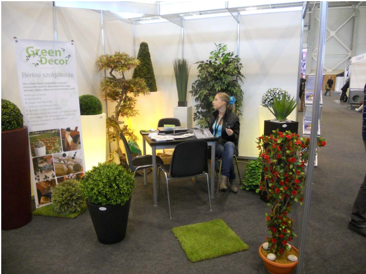
14. ábra: Cserepes virágok selyemből

Ma már nemcsak élővirágot alkalmaznak teremdíszítésre, hanem az eredetire megszólalásig hasonló selyemvirágokat is, amelyeket nem kell gondozni, s nem érzékenyek a szélsőséges fényviszonyokra, a huzatra sem.