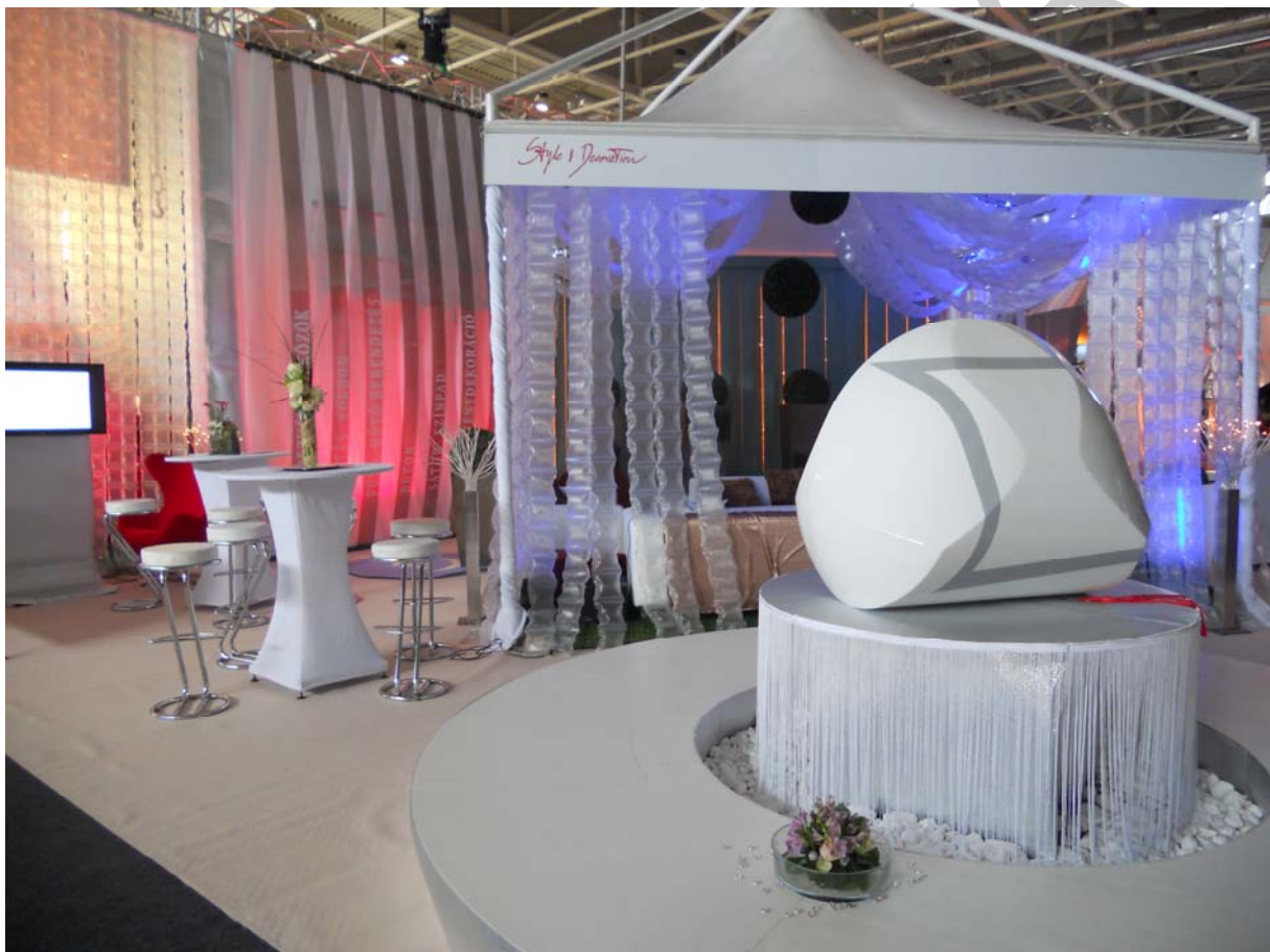
16. ábra: A Gömböc