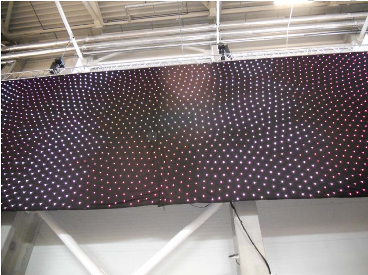
7. ábra: Világítással csillagos égbolt varázsolható az esti rendezvény fölé

Figyelmet kell szentelni a világítási megoldásokra is. Alkalmazhatók tompított fények, színes lámpák, megvilágíthatók az asztalok külön-külön is. Felfüggeszthetünk tükörlabdákat, illetve üzeneteket vetíthetünk a falra, a színpad háttérére stb.