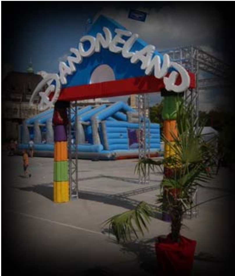
11. ábra: Családi nap dekorációja 2

A helyszín megválasztása is emlékezetessé teheti az eseményt. Ezek az alkalmak általában a tavasztól ősziig terjedő időszakokban kerülnek megrendezésre. Jó idő esetén a táj a legszebb dekoráció. Ilyenkor sátrakkal fel kell készülni a rossz időre is.