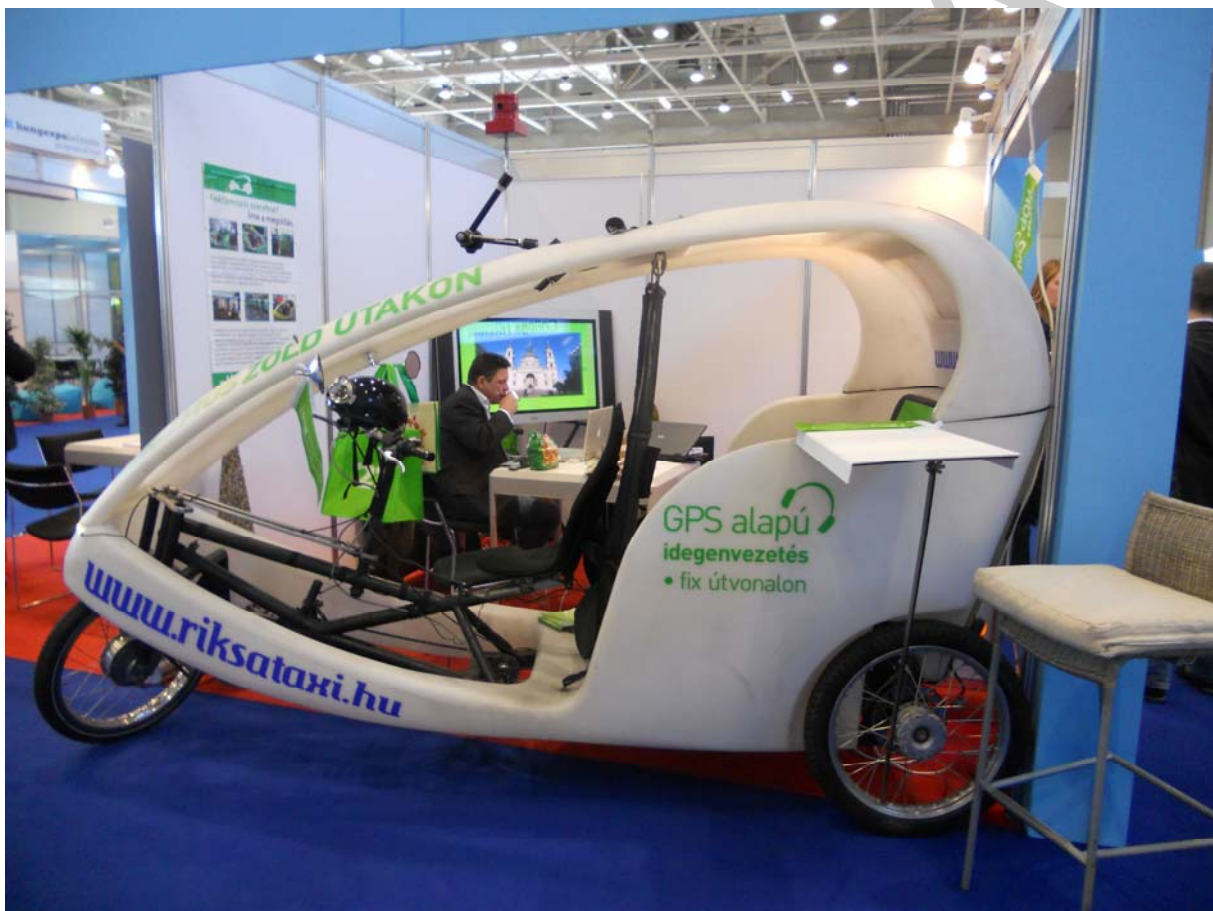
1. ábra: A vendégek szállításának egy látványos megoldása a riksataxi

Az emlékezetes, a médiafigyelem központjába szánt esemény rendezésekor célszerű más, olyan vállalatokkal társulni, akiknek szintén jól jön a hírverés. Ilyen például, ha a fogadás szervezésekor egy olyan cukrászattal társulunk, akik különleges tortákat készítenek, vagy olyannal, akik veterán autókön szállítják a vendégeket az esemény színhelyére, de szóba jöhet a bort biztosító pincészet is. Divatos butikot választhatunk helyszínnek fogadás, vacsora szervezésére, utána divatbemutatóban gyönyörködhetnek a vendégek, megismerve a cég új kollekcióját stb. Számtalan ötletes megoldáshoz nyerhetünk társakat, ezáltal megosztva a költségeket.