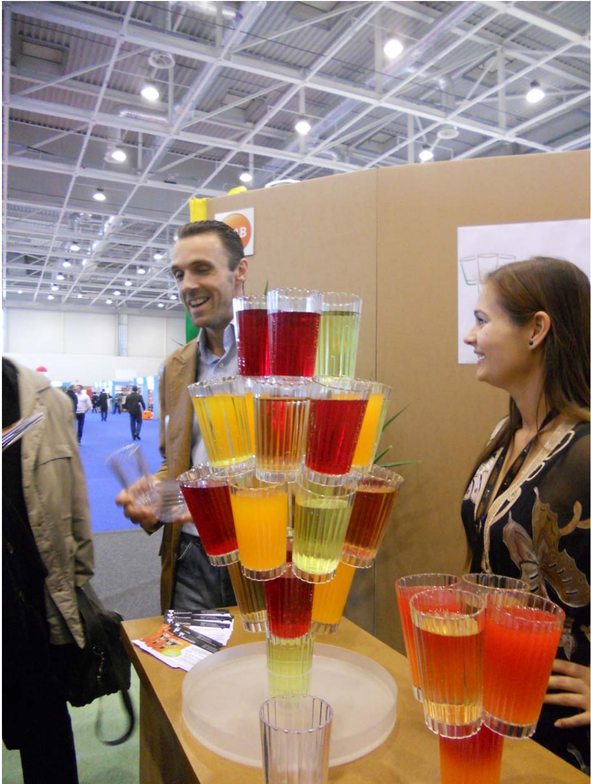
17. ábra: Mágikus poharak, tetszés szerint tornyozhatók

7. Rendezvényszervező cégek igénybe vétele: