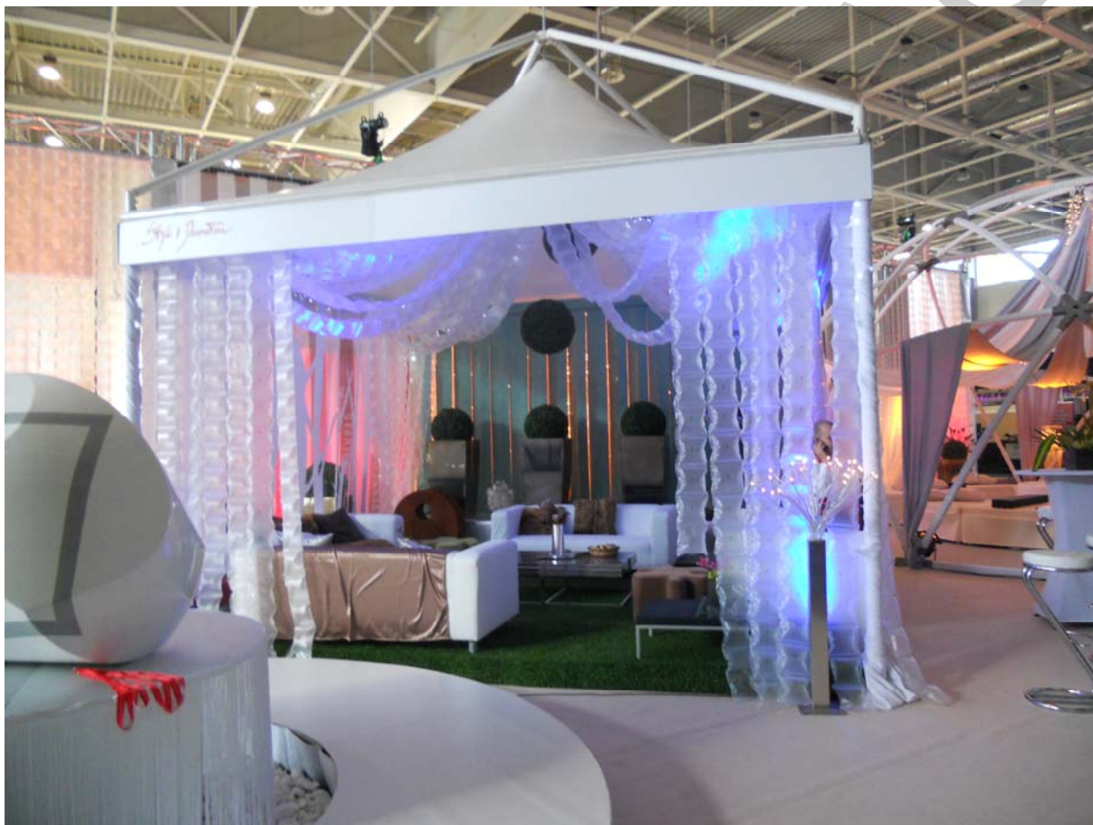
2. ábra Romantikus hangulatú rendezvénysátor

A rendezvény dekorációjának igazodnia kell a rendezvény stílusához, pl. a romantikus stílusú rendezvény dekorációjának a meghittséget, a gyengédséget, a puhaság, a melegség érzetét kell keltenie.