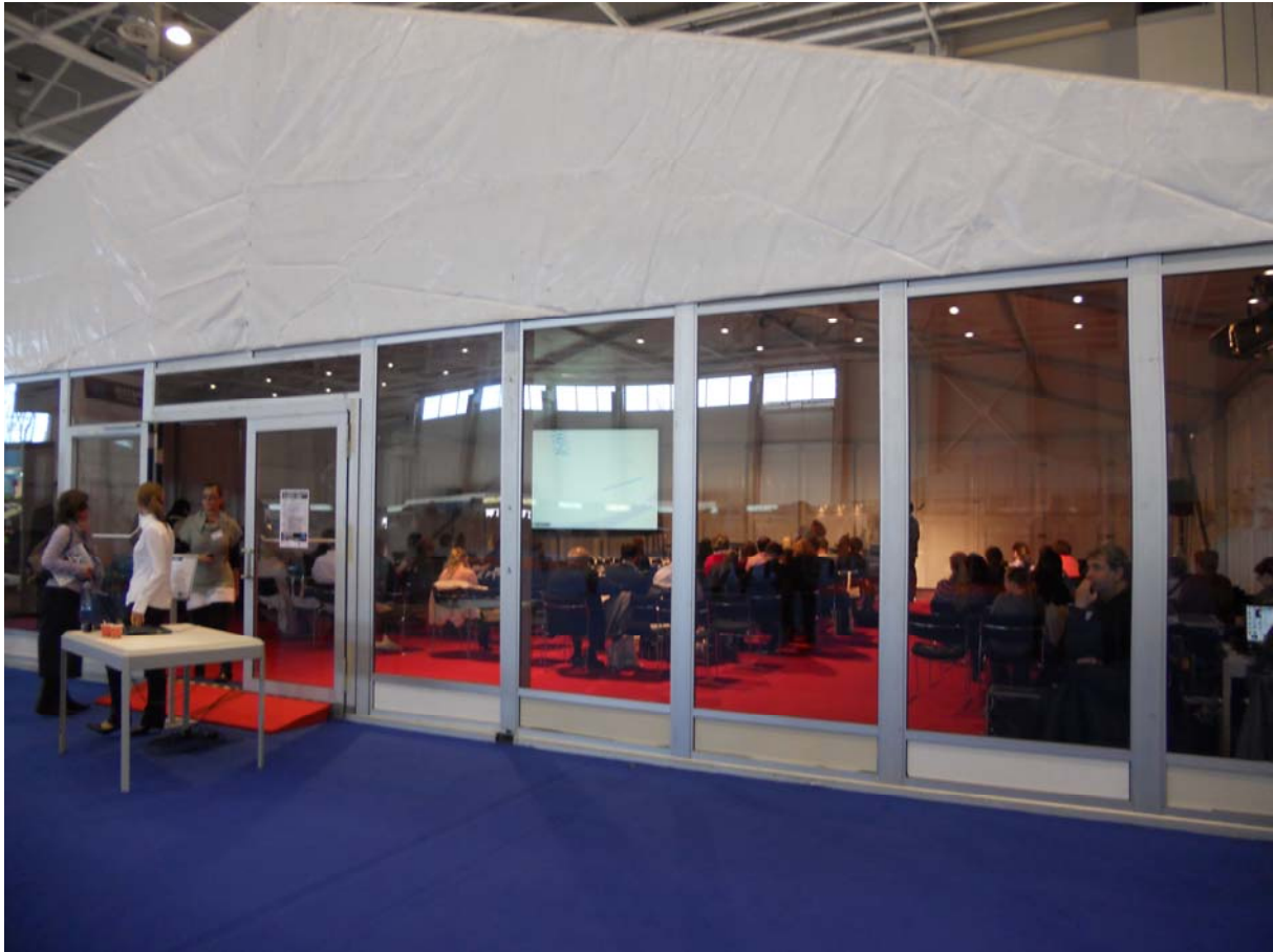
9. ábra: Kongresszusi sátor

Ezekon az eseményeken a dekoráció kevésbé hangsúlyos, a rendező cég megnevezése, logója, szlogenje szerepelhet táblákon, kivetítőkön.