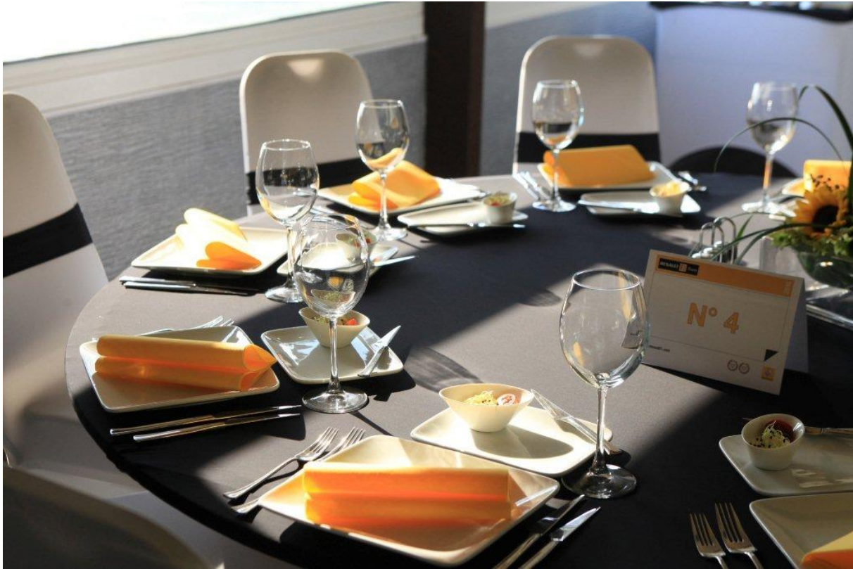
13. ábra: Díszítés asztaldekorációja 3

Gyertya (mécses): főként esti rendezvényeken alkalmazzák a terített asztalokon, vagy büféasztalokon. Meghittséget árasztanak. Olyan gyertyatartókban kell elhelyezni, melyek a porcelán készletek, vagy az evőeszközök tartozékai, így azokkal harmonizálnak. A gyertyák színe, alakja legyen összhangban az alkalommal, a cég színeivel. Fontos, hogy a gyertyák ne legyenek illatosak, ugyanakkor cseppmentesek és hosszantartó égésűek legyenek. Alkalmazásukkor fokozottan ügyelni kell a tűzvédelemre.