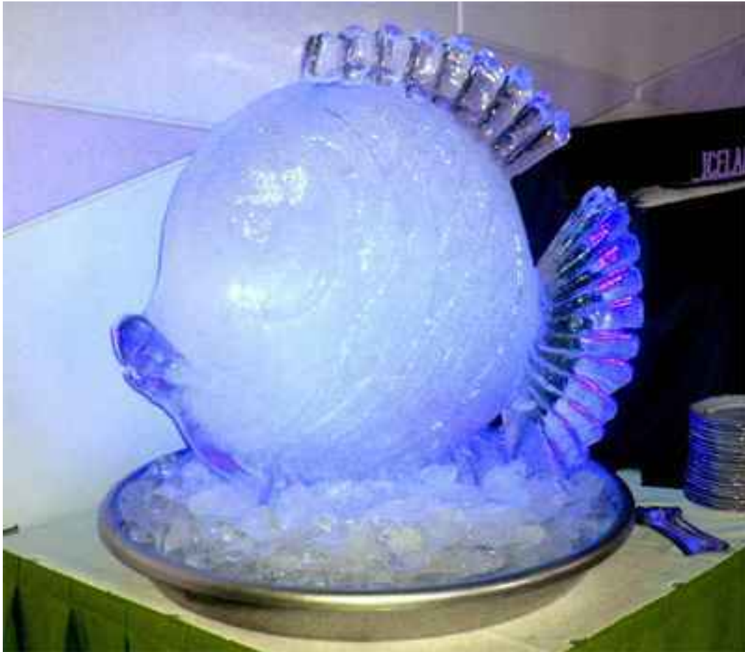
5. ábra: Jégszobor 1

Figyelembe kell venni a rendezvény célközönségét is: a dekorációt igényeikhez, ízlésükhöz, elvárásaihoz kell igazítani.