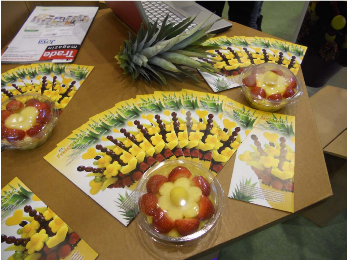
8. ábra: Gyümölcsökből faragott ajándékok