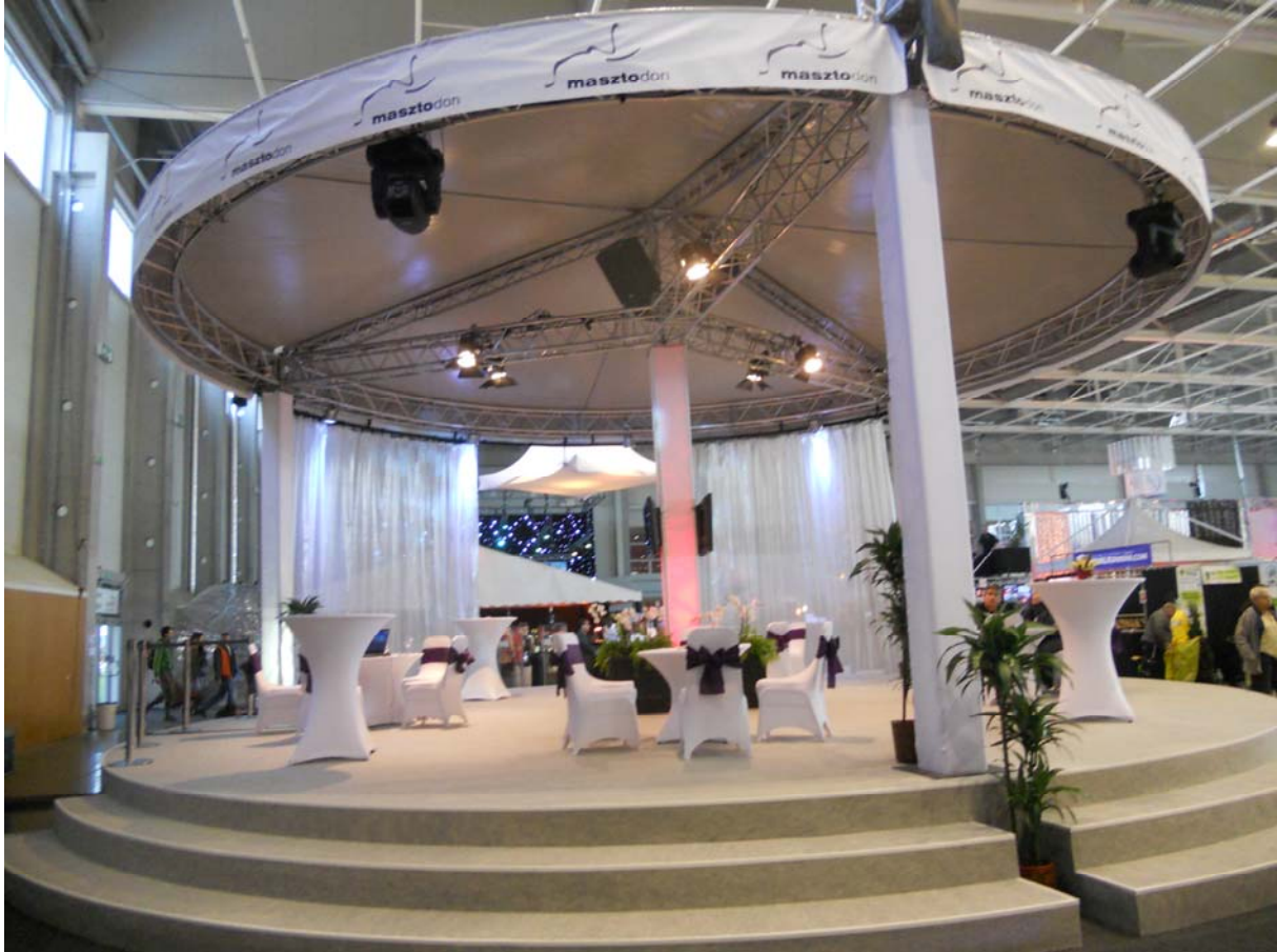
4. ábra: Kültéri rendezvény dekorálása

Az, hogy kül- vagy beltéri rendezvényről van szó, szintén befolyásolja a dekorációt.