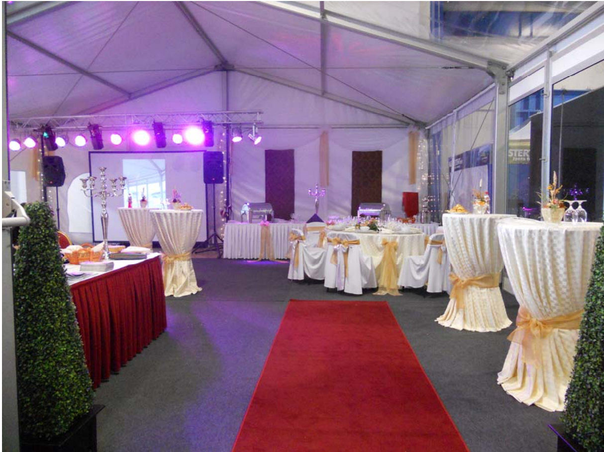
12. ábra: Fogadás dekorációja

Koktélparti új üzleti kapcsolatok, ismeretségek kötésének alkalma. Az étkezés visszafogott, elegáns.