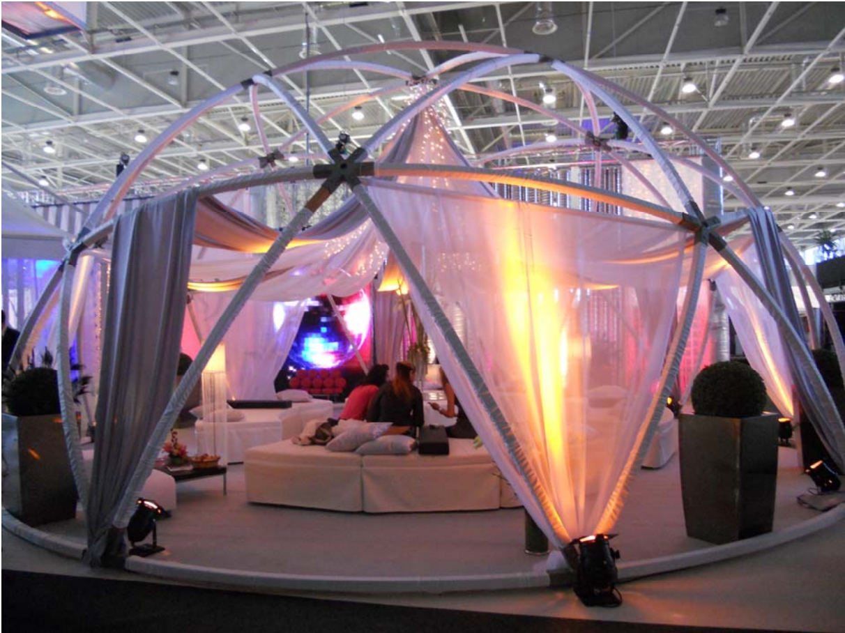
3. ábra: Romantikus hangulatú rendezvénysátor

Az esemény stílusa befolyásolja a meghívók, az étlap, a parkoló- kártyák megtervezését, a helyszínt, a virágok, a díszítés kialakítását, a zene, a szórakoztató programok szervezését, sőt még a vendégek öltözködését is. Vannak olyan rendezvények, ahol előírják, milyen öltözékben kell megjelenniük a vendégeknek. Pl. retro öltözékben, jelmezben, a hatvanas évek, vagy a húszas évek divatjának megfelelően stb.