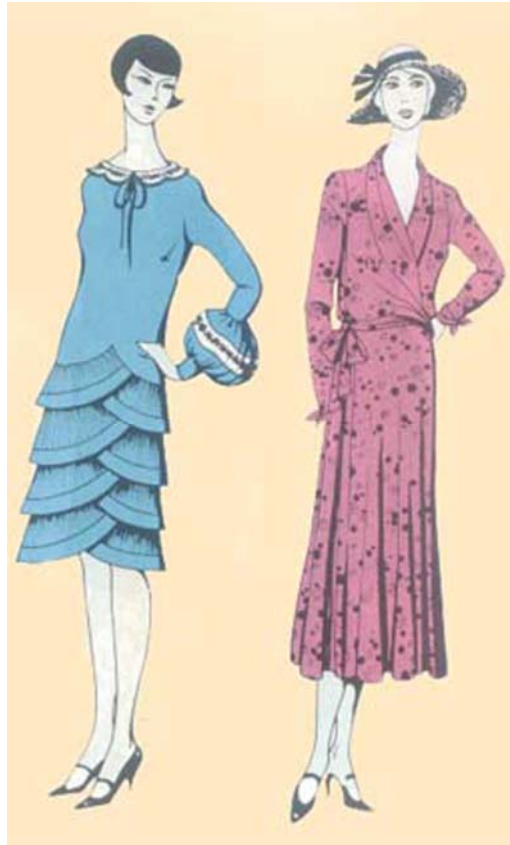
1. ábra Régi divatlap kép'