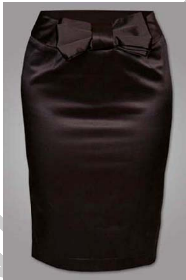
20. ábra Lefelé szűkülő "ceruza" szoknya 20