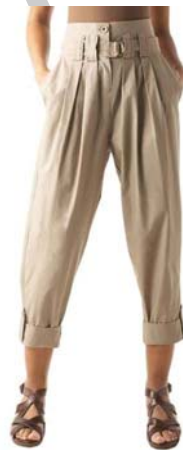
16. ábra Magasított derekú, bőségráncokkal ellátott nadrág különleges övrésszel 16