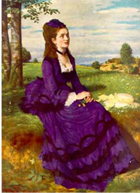
7. ábra Lila 7