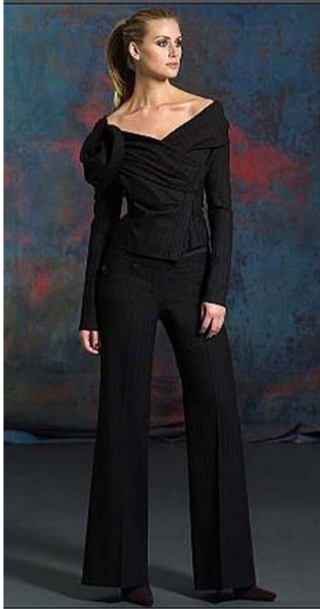
15. ábra Lefelé bővülő, élre vasalt szárú csípőnadrág 15