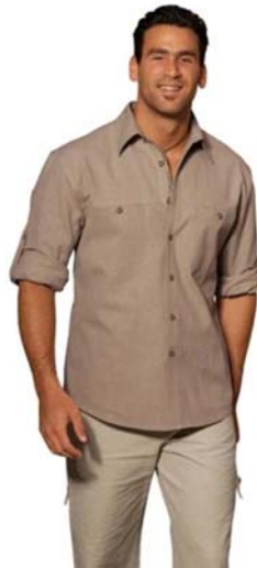
26. ábra Férfi rövid ujjú ing 27

Az ing szinte minden férfinak, fiúnak jól áll, elengedhetetlen darab a férfi ruhatárában. A fiatalok általában nadrágon kívül, az idősebbek a nadrágba tűrve hordják, de öltönyhöz, elegáns viseletként nem ajánlott kívül hordani. A rövidlábúak számára kevésbé előnyös a nadrágon kívül hordott hosszabb fazon, mert tovább rövidíti a lábat, a kívül hordott ing viszont vékonyít, segít eltakarni a pocakot, nagyobb feneket.