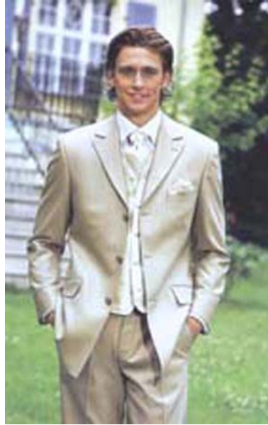
2. ábra Beige 3