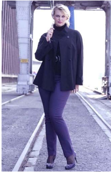
14. ábra Szűk, a láb vonalát követő nadrág 14