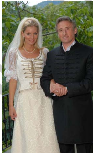
38. ábra Magyaros öltözet esküvőre 39