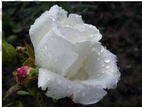
3. ábra Fehér

Tiszta, mindenhez illő, klasszikus szín. A fehér optikailag nagyít, kiemel, ezért azokon a testrészeken ajánlott a viselése, amelyeket hangsúlyozni szeretnénk. A kevésbé modell alkatúak karcsúsított ruhadarabokat viseljenek ebben a színben. Kiegészítőkkel bármilyen haj- és bőrszínhez viselhető, de leginkább világos hajszínhez ajánlott. Nadrágként, szoknyaként viselve számtalan színű felső választható hozzá. Minden ruhadarabhoz (szoknya, felső, nadrág, top, póló, kabát) ajánlható szín.