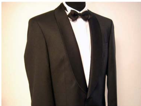
35. ábra Szmoking 36