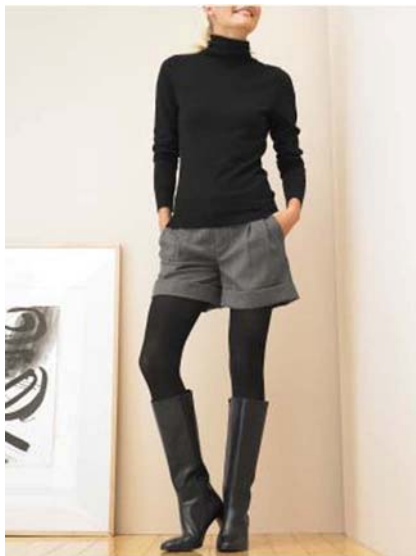
17. ábra Női rövidnadrág télre 17

A nadrágon elhelyezhetünk különböző zsebeket. A zseb minden testalkathoz ajánlott, mert megtöri a derékrész monotonitását.