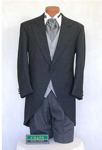
37. ábra Zsakett 38