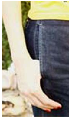
19. ábra Svédzseb 19