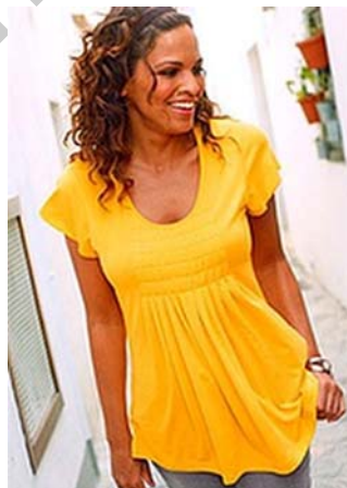
23. ábra Egy hétköznapi blúz 24

Az ing a férfiak viselete, a blúz pedig női ruhadarab. Lényeges különbség a kettő között a gombolásban van: az ing balról jobbra, a blúz jobbról balra gombolódik. A blúzok azonban ma már nem csak gombos változatban készülnek, gyakorlatilag a legkülönbözőbb fazonú női felsőket is a blúzok közé sorolják.