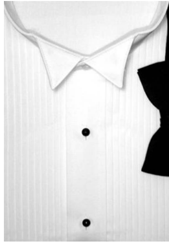
27. ábra Hagyományos szmoking ing 28

Az ingek gallérja lehet álló, vagy lehajtott, a gallér vége lehet szögletes, vagy lekerekített. A lehajtott gallérnál alkalmazható a legombolt változat is.