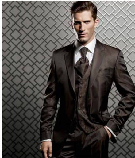
32. ábra Háromrészes öltöny karcsúsított zakóval 33

Gombolása lehet egysoros, vagy kétsoros. Az egysoros a gyakoribb, mert ez szinte minden alkaton jól áll, míg a kétsoros erősít, így inkább a vékonyabbaknak előnyös. A gombok száma ritkábban 1, jellemzően 2, vagy 3. A legelső gombot mindig, minden gombot pedig leüléskor illik kigombolni.