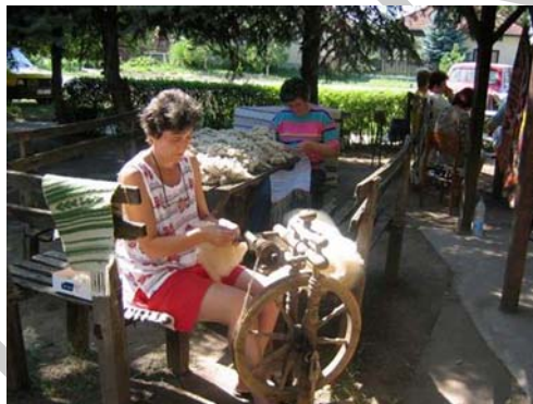
39. ábra Gyapjúsál fonása 40

A selyem és a gyapjú állati eredetű, az alapanyagok között nem a legolcsóbb, de jó minőségű ruhákat készíthetünk belőlük. A selyem lágy, kissé csúszós, és erős alapanyag. Vastagságától függően lehet könnyű, vagy nehéz. Felhasználható blúzok, ingek, de akár ágyneműk készítésére is. A gyapjú előnye, hogy meleg és rugalmas, főként kötöttáruhoz, öltönyökhöz használják. Tisztítása viszont nem egyszerű, mert könnyen összemegy.