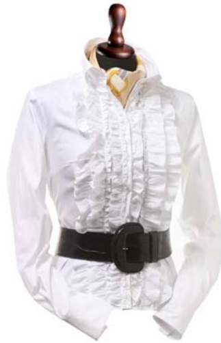
25. ábra Egy klasszikus zsabós blúz 26

Az ing szinte minden férfinak, fiúnak jól áll, elengedhetetlen darab a férfi ruhatárában. A fiatalok általában nadrágon kívül, az idősebbek a nadrágba tűrve hordják, de öltönyhöz, elegáns viseletként nem ajánlott kívül hordani. A rövidlábúak számára kevésbé előnyös a nadrágon kívül hordott hosszabb fazon, mert tovább rövidíti a lábat, a kívül hordott ing viszont vékonyít, segít eltakarni a pocakot, nagyobb feneket.