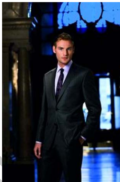
29. ábra Egy klasszikus öltöny 30

A női és férfi ruházat elegáns darabja a blézer, illetve a zakó. a kereskedelemben kapható külön darabként, de jellemzőbb kosztüm és öltöny részeként nadrággal, illetve szoknyával. A zakók és blézerek fazon-választékát a hossz, a derék fazonja, a gallér, a gombolás, a zseb és a díszítések határozzák meg.