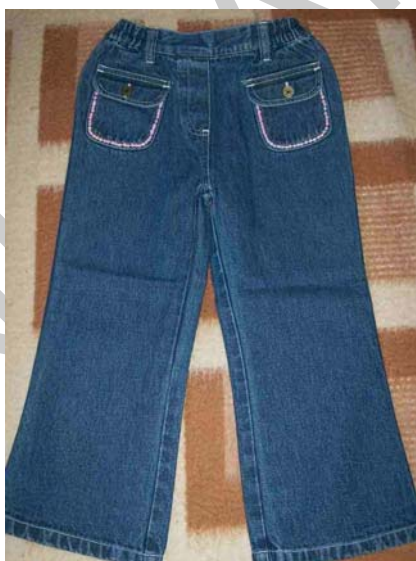
18. ábra Gumisderekú gyermeknadrág díszített zsebbel 18

A nadrágon elhelyezhetünk különböző zsebeket. A zseb minden testalkathoz ajánlott, mert megtöri a derékrész monotonitását.