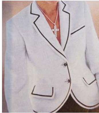
30. ábra Karcsúsított blézer 31

Ha V-alakú dekoltázst, vagy duplasoros gombolást alkalmazunk, az tovább nyújtja az alakot. Szintén karcsúbb hatást eredményeznek a hosszanti szabásvonalak mentén elhelyezett díszítések, varrások. A vékony, jó alakú nők testmagasságtól függetlenül viselhetnek rövid állású, kevéssel derék alatt végződő blézert. Nekik jól áll az egyenes fazonú, dzseki szerű és a karcsúsított szabású kosztümkabát is. A gombok száma is fontos. Az egygombos fazon szinte mindenkinek jól áll, a kétgombosnál már az alacsonyabbak, illetve a teltebbek számára előnyösebb, ha csak az egyik gombot gombolják be. A többgombos fazon a magasabb, vékony hölgyeknek áll igazán jól.