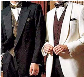
33. ábra Egysoros és kétsoros gombolás 34

Gombolása lehet egysoros, vagy kétsoros. Az egysoros a gyakoribb, mert ez szinte minden alkaton jól áll, míg a kétsoros erősít, így inkább a vékonyabbaknak előnyös. A gombok száma ritkábban 1, jellemzően 2, vagy 3. A legelső gombot mindig, minden gombot pedig leüléskor illik kigombolni.