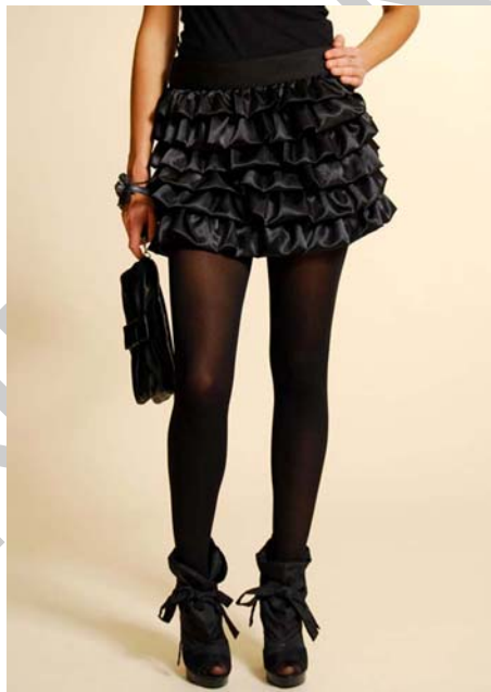
22. ábra Fodros szoknya 22