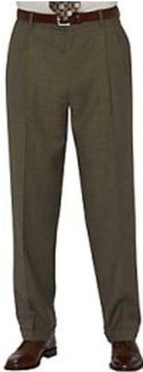
13. ábra Klasszikus fazonú, svédzsebes férfinadrág 13

A nadrág szárára a következő variációk különböztethetők meg: