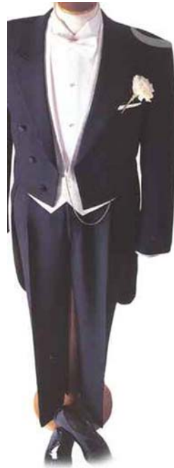
36. ábra Frakk 37