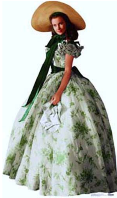
12. ábra Zöld 12

A fenti ismertető nem örökérvényűek, a divattól, és a vevő egyéniségétől függően változhatnak a javasolt színek. Ezért is fontos a személyre szabott ajánlás, a ruhapróba. Alapszabály, hogy eladóként nem szabad egyértelműen állást foglalni egy-egy ruha mellett vagy ellen. Inkább javaslatokat, általános megállapításokat tegyünk, esetleg újabb szín, színárnyalat ajánlásával segítsük a jó választást.