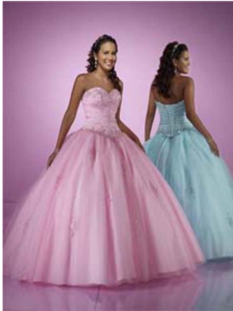
9. ábra Rózsaszín 9