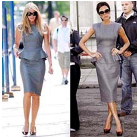
11. ábra Szürke 11

A szőke, közép szőke, világosbarna hajszerűeknek ajánlott, főleg ha barnás- vagy pirospszgás az arcbőrük. Előnyös még, ha a szem színe kék, vagy szürke. Jól mutat fehérrel, élénkzölddel, a narancs változataival, pinkkel, késsel. Érdekes variációk (főleg ezüstszerű esetén): feketével, éj késsel.