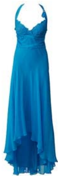
5. ábra Kék 5

A kék klasszikus feketével és fehérrel, különleges: ezüsttel, lilával, más kék árnyalatokkal KRÉM