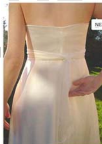
6. ábra Krém 6

Finom, elegáns, nőies szín. Az ilyen színű ruha viselője diszkréten bájos, nőies lehet. Ajánlott meleg barna, szőke hajhoz, de más hajszínekhez is hordható.