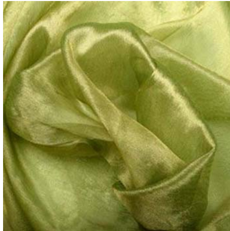
40. ábra Műszálas anyag (organza) 41

Az akril és az olefin például a gyapjúhoz hasonló. A poliészter nagyon erős, nem gyűrődik, formatartó, könnyen mosható, gyorsan szárad, de nem nedvszívó. A fonala hasonlít a gyapjúra vagy a selyemre, gyakran keverik ezekkel a szálakkal illetve más természetes szálakkal (kevert szálas anyag). Tökéletes vászonanyag, ha pamutszállal keverik. A poliamid (nejlon) is erős, kevésbé nedvszívó, de a legfontosabb, hogy nagyon rugalmas.