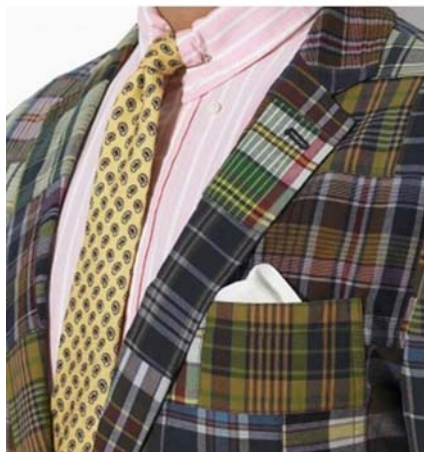
34. ábra Különleges pachwork (foltvarrásos) zakó 35