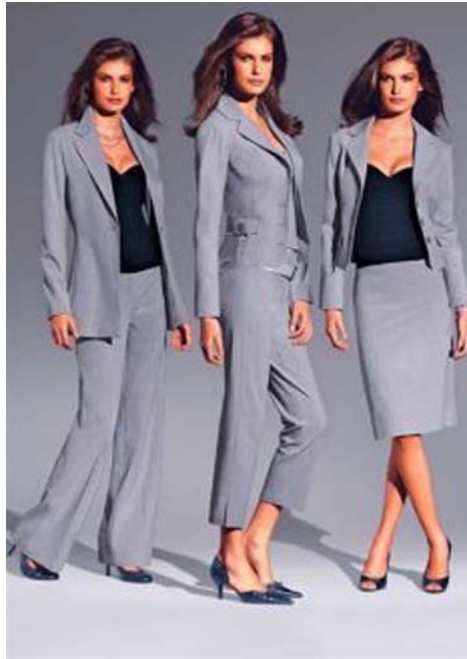
31. ábra Női kosztümök 32

Vékony alakon jól mutat a rövid állású, éppen csípőig érő blézer. Aki körtealkatú, illetve felsőrésznél nagyobb konfekcióméretű szoknyát visel, az inkább hosszított szabású blézert, hordjon, mivel ez ellensúlyozza a szélesebb alsótestet. Mostanában megengedett a stílusok keverése; elegáns, karcsúsított vonalú bársonyblézert felvehetünk farmernadrághoz is. A Chanel kosztümök stílusát idéző, rövid szövetkabátkák szintén társíthatók lezserebb ruhaneműkkel, akár farmerral. A military stílusú, sok zsebes, vállapos, öves kiskabátok pedig színben harmonizáló, bő szoknyával is hordhatók.