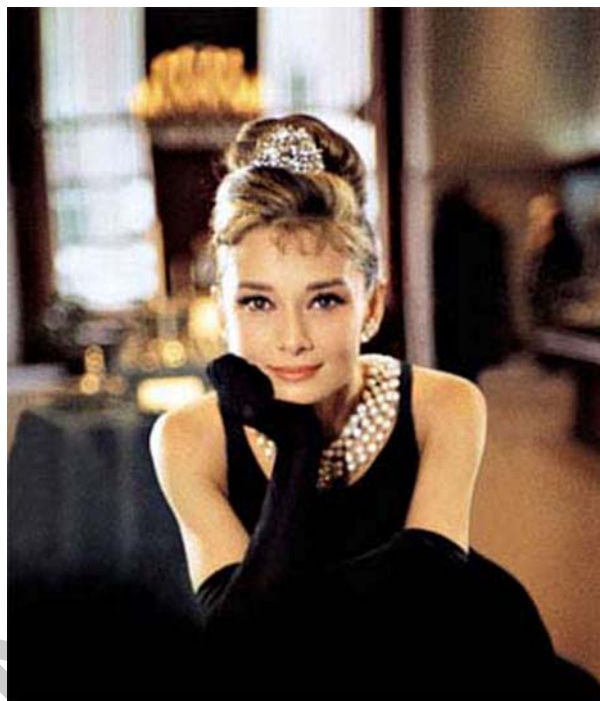
4. ábra A klasszikus fekete 4

Klasszikus, elegáns, de komor szín. Optikailag zsugorít, így mindenki bátran viselheti. A fehérhez hasonlóan minden ruhadarab készülhet belőle. A barna bőrszín kiemeli, a világos a bőrszín esetén az arc közelében érdemes kerülni. Legjobban a szőke, barna, vörös hajszínhez ajánlott. Ha túl sokat viselünk belőle, nyomasztó lehet, ronthatja a hangulatunkat.