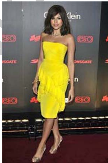
10. ábra Sárga 10

Figyelemfelkeltő, kedvelt, vidám szín. A szőkék mellett legjobban a sötét hajsínűeknek ajánlott. Javasolt színkombinációk: fehér-sárga, zöld-sárga, narancs-sárga, piros-sárga. Vibráló: lila-sárga, fekete-sárga.