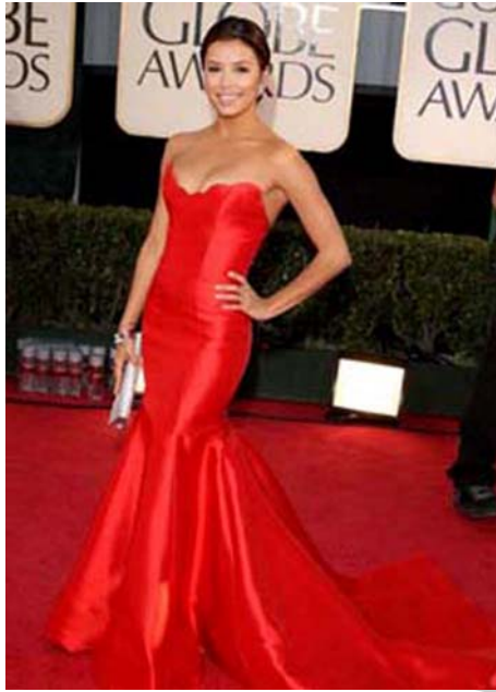
8. ábra Piros 8