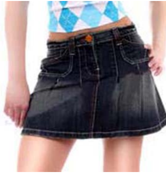
21. ábra Csípőszoknya 21