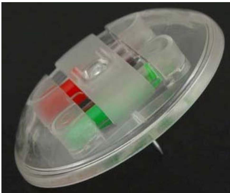
4. ábra Tintapatronos etikett 4

Az etikettet csak az erre a célra kifejlesztett hatástalanítóval lehet biztonságosan eltávolítani. Ekkor a festéktartály nem sérül és a termék használhatóvá válik. A megoldás nagy előnye, hogy nem igényel riasztórendszert és külön figyelőszolgálatot. Viszonylag alacsony költségű beruházással megvalósítható és a működtetés költsége is minimális.