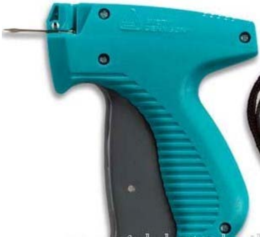
12. ábra Szálbelövő pisztoly zsineges rögzítéshez 13

A kemény etikett olyan műanyag vagyondédelmi eszköz, ami nem tartalmaz feliratot, két részből áll, és leggyakrabban tűvel rögzíthető a két rész egymáshoz, illetve az etikett az áruhoz.