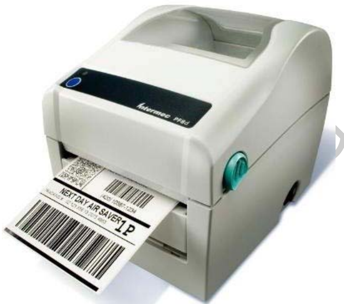
11. ábra Ál-vonalkódos címke 12

A másik jellemző rögzítési mód a pánt, vagy zsineg alkalmazása. Ilyenkor legtöbbször a többi függőcímkéhez kapcsolják, illetve azzal együtt rögzítik a vagyonvédelmi címkét is, ezért a címke a függőcímkékre jellemző tartalommal kerül nyomtatásra. Tartalmazhatja például az üzlet adatait, vagy külön az anyagösszetételt, méretet, árat, vagy más kapcsolódó információt.