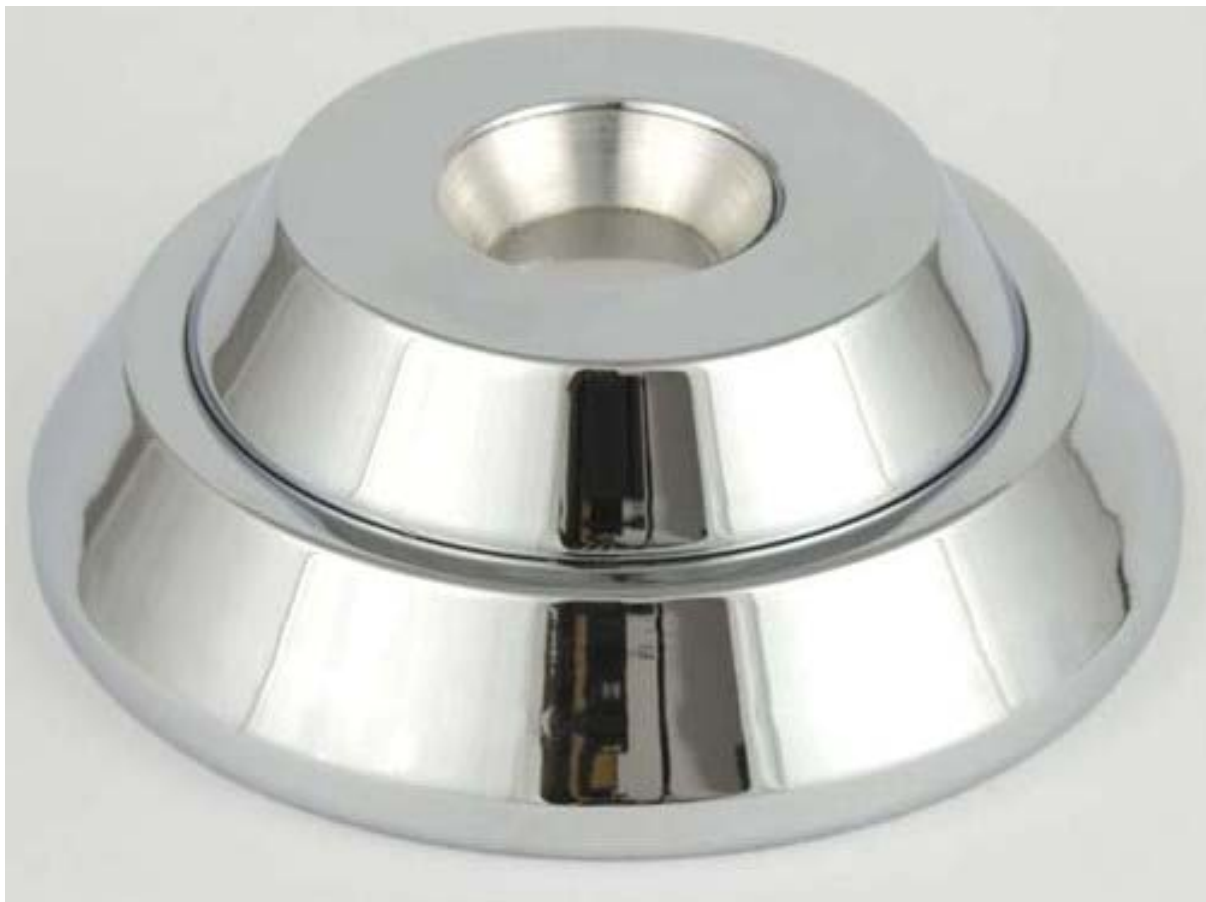
6. ábra Etikett nyitó 6

A címkék és etikettek eltávolítására, hatástalanítására úgynevezett nyitókat vagy deaktivátorokat alkalmaznak az üzletek. Ezek segítségével a pénztáros lehetővé teszi az áru zavartalan kivételét az üzletből. A hatástalanítóknak is sok fajtája ismert. Megtalálhatók közöttük a nagyméretű, asztalra helyezhető vagy pultba süllyeszthető változatok, szerelhetjük a falra, de kis pénztártér esetén választhatjuk a kézi változatot is.