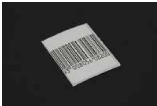
13. ábra Kemény etikett 14

Az etikettek, címkék felrakása az áruelemek készítés része. Akkor vigyük ki az árut az eladóterbe, ha már mindegyiken elhelyeztük a szükséges áruvédelmi eszközt, illetve a gyártó forráscímkével ellátta.