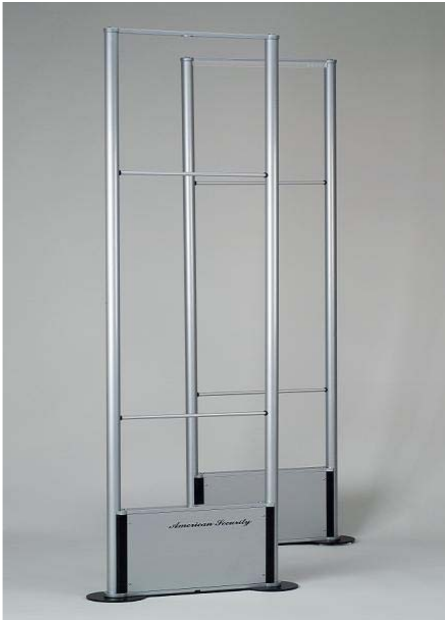
8. ábra Áruvédelmi antenna 8