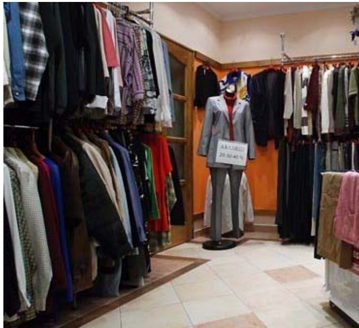
3. ábra Önkiszolgáló értékesítési mód 3

Jól alkalmazható és vagyonbiztonsági szempontból is előnyösebb az önkiválasztó értékesítés . Cipőknél több helyen kedvelt megoldás, hogy minden fazonból csupán egy méretet, vagy több méretben, de csak fél pár cipőt helyeznek ki. A választás után kérheti a vevő a neki megfelelő méretet, illetve a cipő másik felét is.