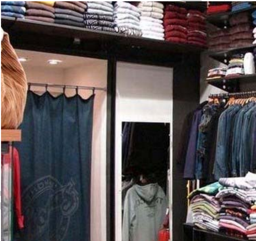
2. ábra boltbelső próbafülkévéle

A konfekció-, kötött- és divatáru üzletekben fontos szervezési feladat a próbafülke fokozott figyelemmel kísérése . Nagyobb forgalmú üzleteknél jellemző, hogy a próbafülke környékén külön eladó dolgozik. Ő segíti a tájékozódást, esetleg várakozás közben tanácsot ad a vevőnek. Egyre több helyen ellenőrzik és korlátozzák a bevihető darabszámot. A vevő a nála lévő ruhadarabok számának megfelelő kártyát kap, amit próba után vissza kell adnia. Ezzel könnyen ellenőrizhető a bevitt és kihozott mennyiség. Ha nem adunk a vevőnek kártyát, akkor is előnyös, ha a próbafülke környékén mindig tartózkodik egy eladó. A vevők tájékoztatása mellett figyelemmel kísérheti a próbafülke körüli mozgásokat, ami a vevők elégedettségét és a vagyonbiztonságot is növeli.