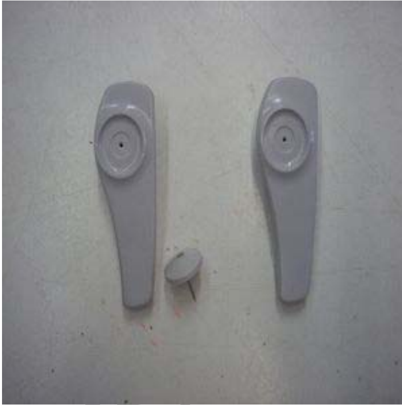
10. ábra Etikett-nyomtató 11

Fontos, hogy a rögzítés ne legyen eszköz nélkül könnyen oldható, és a rögzítés helye azonos fajta ruházati termékeknél azonos helyen legyen. Ezzel segítjük az eladók és a pénztárosok munkáját, így hatástalanításkor pontosan tudják, hogy melyik terméknél hol keressék a címkét. Ezen kívül figyelni kell arra is, hogy az áruvédelmi eszköz ne rontsa a termék összképét, ne akadályozza a ruha felpróbálását.