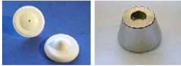
14. ábra Etikett és a hozzá tartozó nyitó 15

A kemény etiketteket minden esetben el kell távolítani a termékről. Ez az adott etiketthez kialakított etikett-nyitóval történik. Ugyanígy a tintapatront is a hozzá tartozó nyitóval kell eltávolítani.