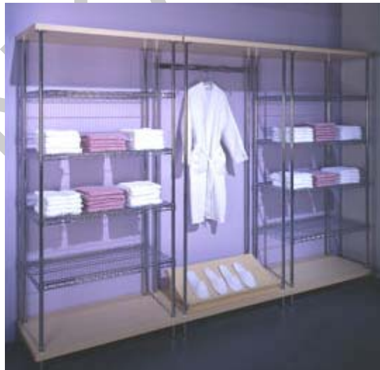
1. ábra A magas polcokat a fal mellé tegyük!

A bolti lopások megakadályozásának leghatékonyabb eszköze a megelőzés. Ez elérhető azzal is, hogy megfelelően alakítjuk ki az üzlet belső rendjét. Az árutároló, bemutató eszközöket úgy helyezzük el, hogy az üzlet egyes pontjairól nagy területet beláthassunk. Ruházati üzletekben a magasabb állványokat, sztendereket, a falak mellé érdemes elhelyezni. Ezeken tárolhatunk hajtogatott és vállfás árukat. Középre inkább alacsonyabb állványokat, sztendereket, felülről nyitott pultokat helyezzünk el, mert a magas berendezési tárgyak, árubemutató eszközök csökkentik a tér beláthatóságát, ráadásul még nyomasztóan is hatnak.