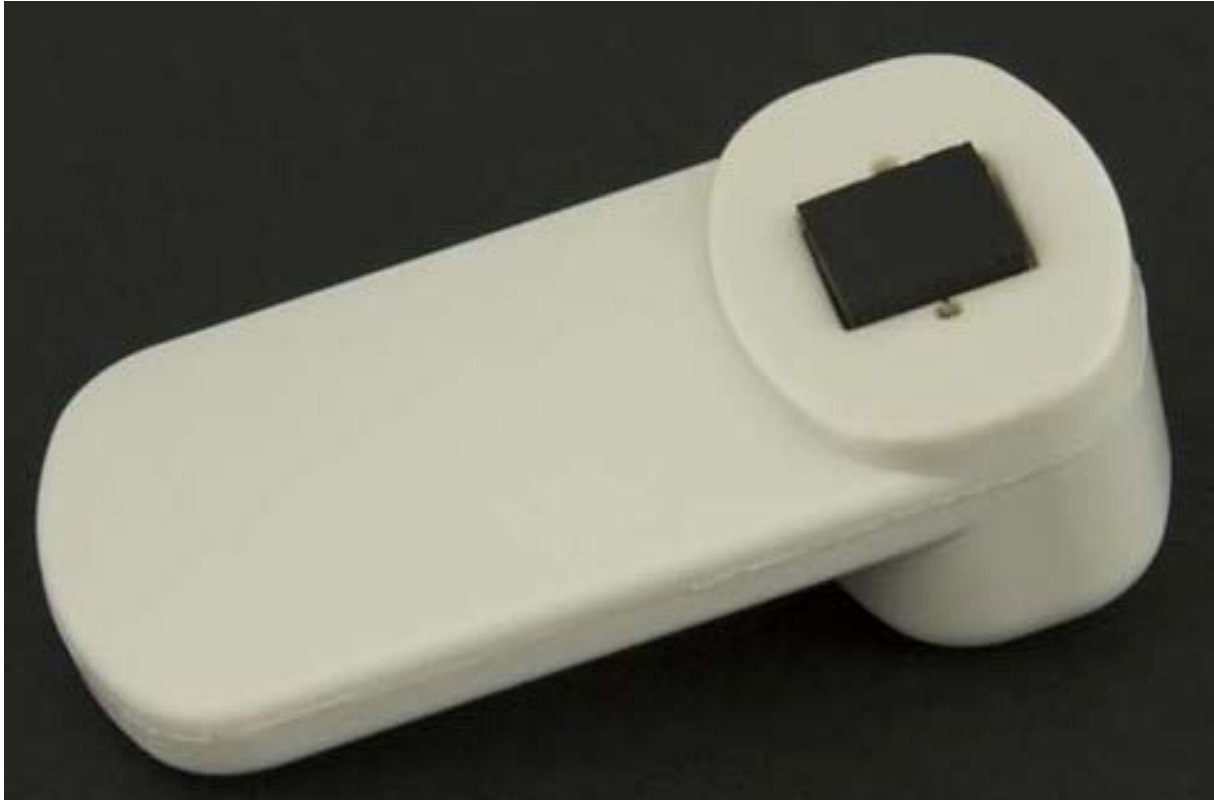
5. ábra Műanyag etikett 5

A címkék lehetnek egyszer használatosak, amit a termékhez tájékoztató címke, vonalkód, álvonalkód vagy más címke formájában kapcsolunk, és a dekódolás után a termékkel együtt elhagyják az üzletet. Ezek egyszerű kivitelűek, papír alapúak, az áruhoz műanyag szállal vagy zárgombbal rögzíthetők, de kaphatók öntapadós változatban is. A szaknyelv ezeket a címkéket hívja puha címkének.