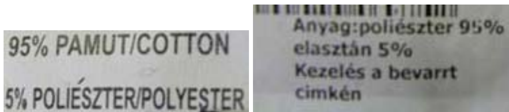
6-7. ábra. A bevarrt címkén és a függőcímkén eltér a nyersanyag-összetétel 6