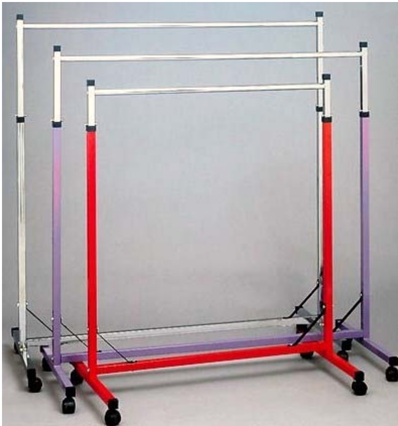
3. ábra. Sztenderek 3

Az átvétel során szükség lehet olyan berendezési tárgyakra, amin az árut elhelyezzük, ezért érdemes előkészíteni, szabaddá tenni megfelelő méretű polcot, pultot, szükség esetén sztendert. A polcon a hajtogatott árukat, a sztenderen a vállfás árukat tárolhatjuk az átvétel alatt (ami segítheti az árumozgatást is). A pulton, vagy asztalon számolhatjuk a termékeket, vagy kiteríthetjük a minőségi átvételhez.