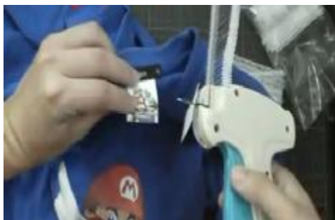
5. ábra. Címkézés 5