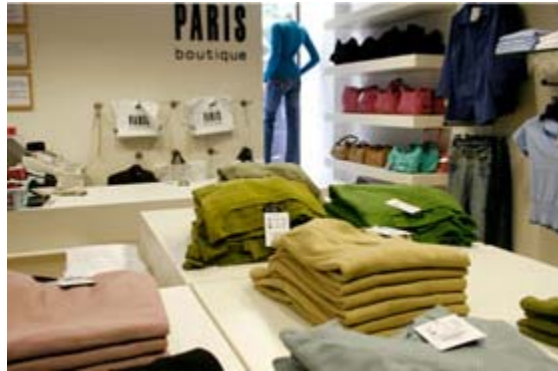
1. ábra. Áruátvétel eladótérben 1

Ha a konfekció árukat egy kis butikban értékesítjük, ami csupán egy eladótérből áll, akkor az átvételt ott kell megszervezni. Az előkészítés során végig kell gondolni, hogy mikor a legalkalmasabb az átvétel lebonyolítása. Ideális esetben nyitvatartási időn túl vesszük át az árut, de a gyakorlatban előfordul, hogy az áruátvétel idejére ideiglenesen bezárják az üzletet. Ekkor ki kell választani azt az időt, amikor a legkevesebb vevő várható. Ez a megoldás csökkenti a bolt presztízsét, ezért lehetőség szerint kerüljük el.