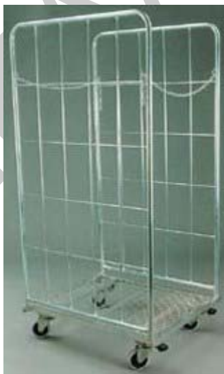
2. ábra. Rolly kocsi 2

Konfekció termékek üzleten belüli mozgatására jellemzően a három-, vagy négykerekű kézikocsit alkalmazzák, vagy az oldalfallal rendelkező rolli kocsit.