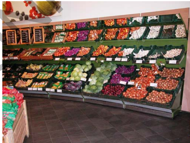
5. ábra. Lédig áruk a zöldség osztályon