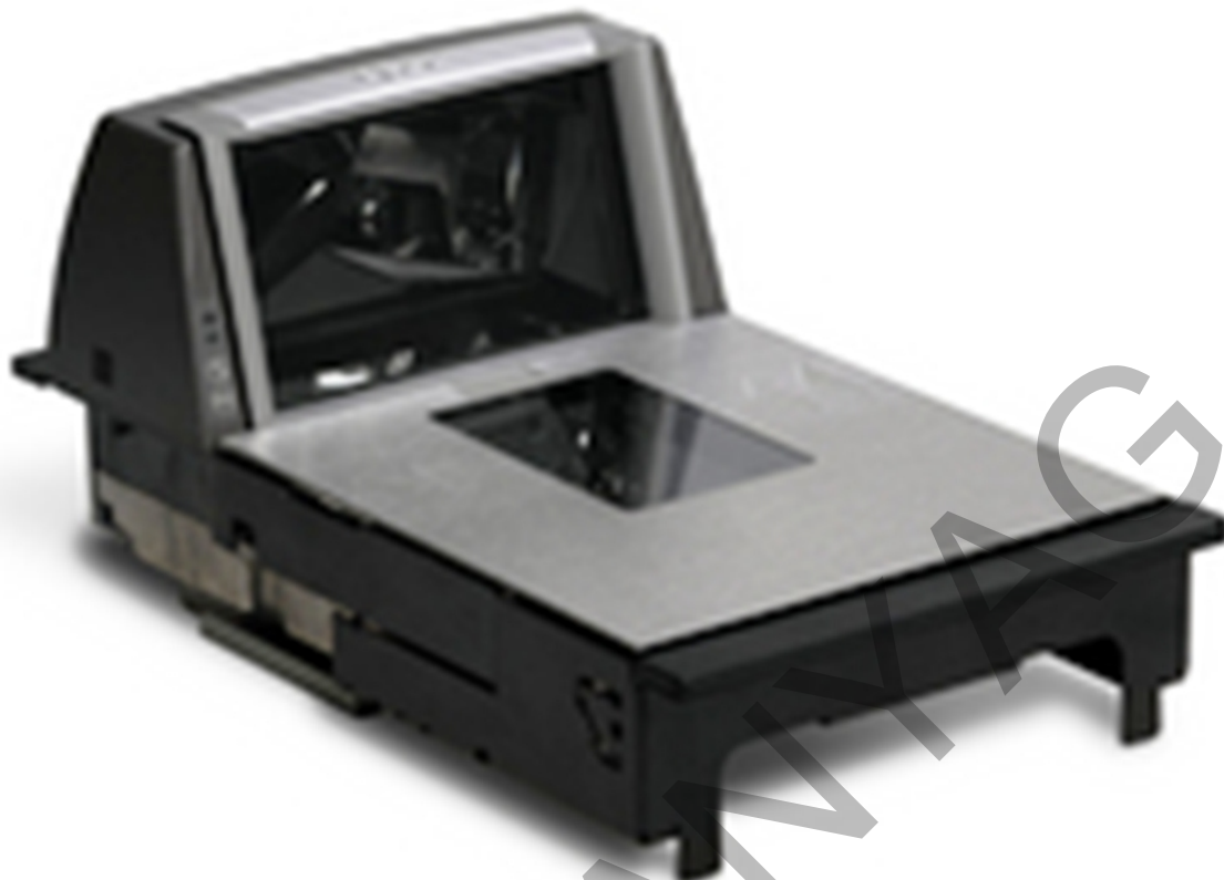
23. ábra. Pultba építhető mérleg szkennel funkcióval 20