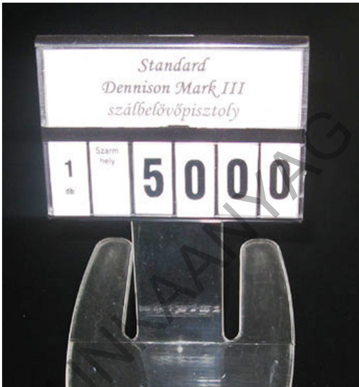
9. ábra. Árkazetta lédig áruk árfeltüntetéséhez 8

Átmeneti engedmények esetén, a megváltozott áron kívül jól látható feliratokon arról is tájékoztatni kell a vevőket, hogy meddig vásárolhatnak a kedvezményes áron.