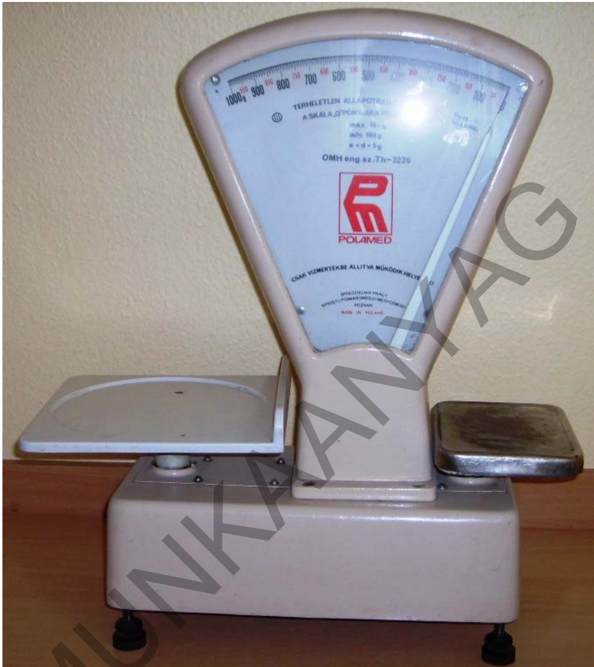
14. ábra. Billenősúlyos asztali mérleg

Az ún. felrakósúlyos gyorsmérleg a súlyok felrakását maga végzi, ha a talapzaton lévő csavart elforgatjuk.