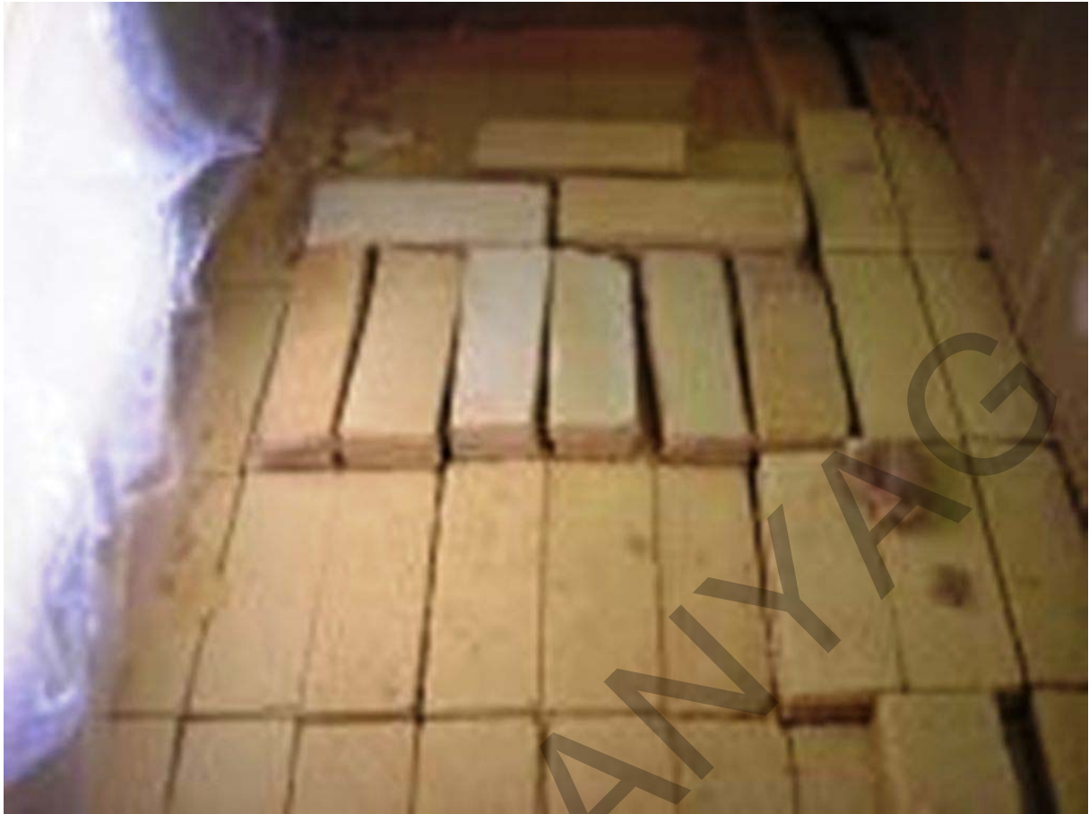
1. ábra. Lédig nápolyi 3