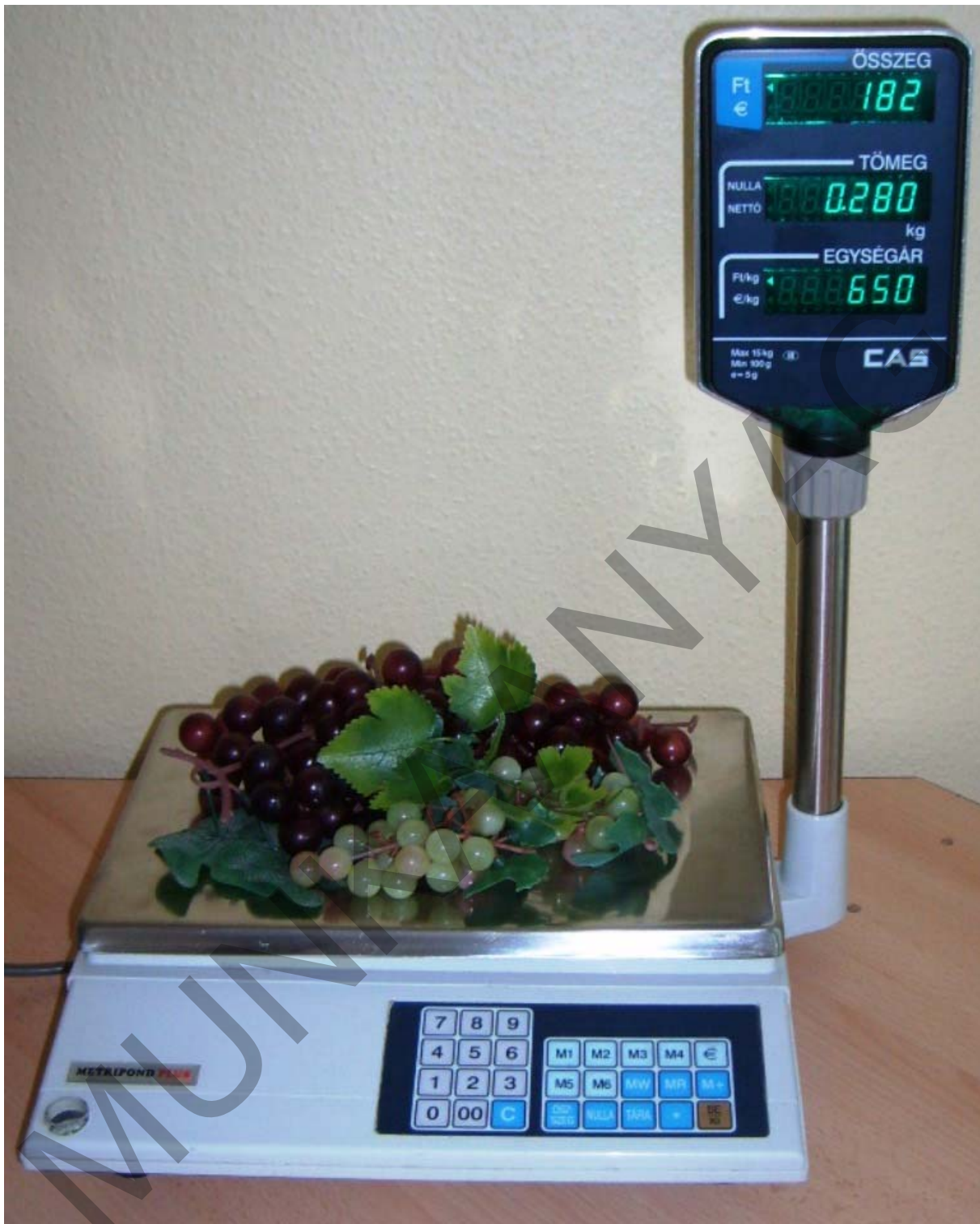
15. ábra. Digitális tornyos mérleg