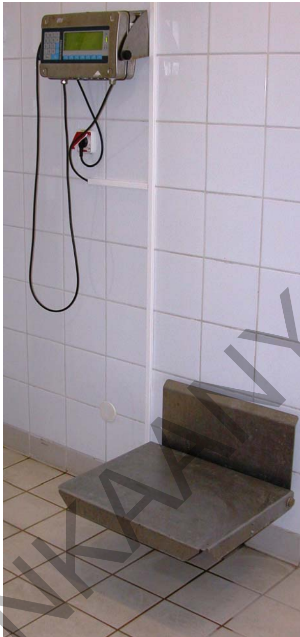
13. ábra. Tőkehús előkészítőben található elektronikus mérleg