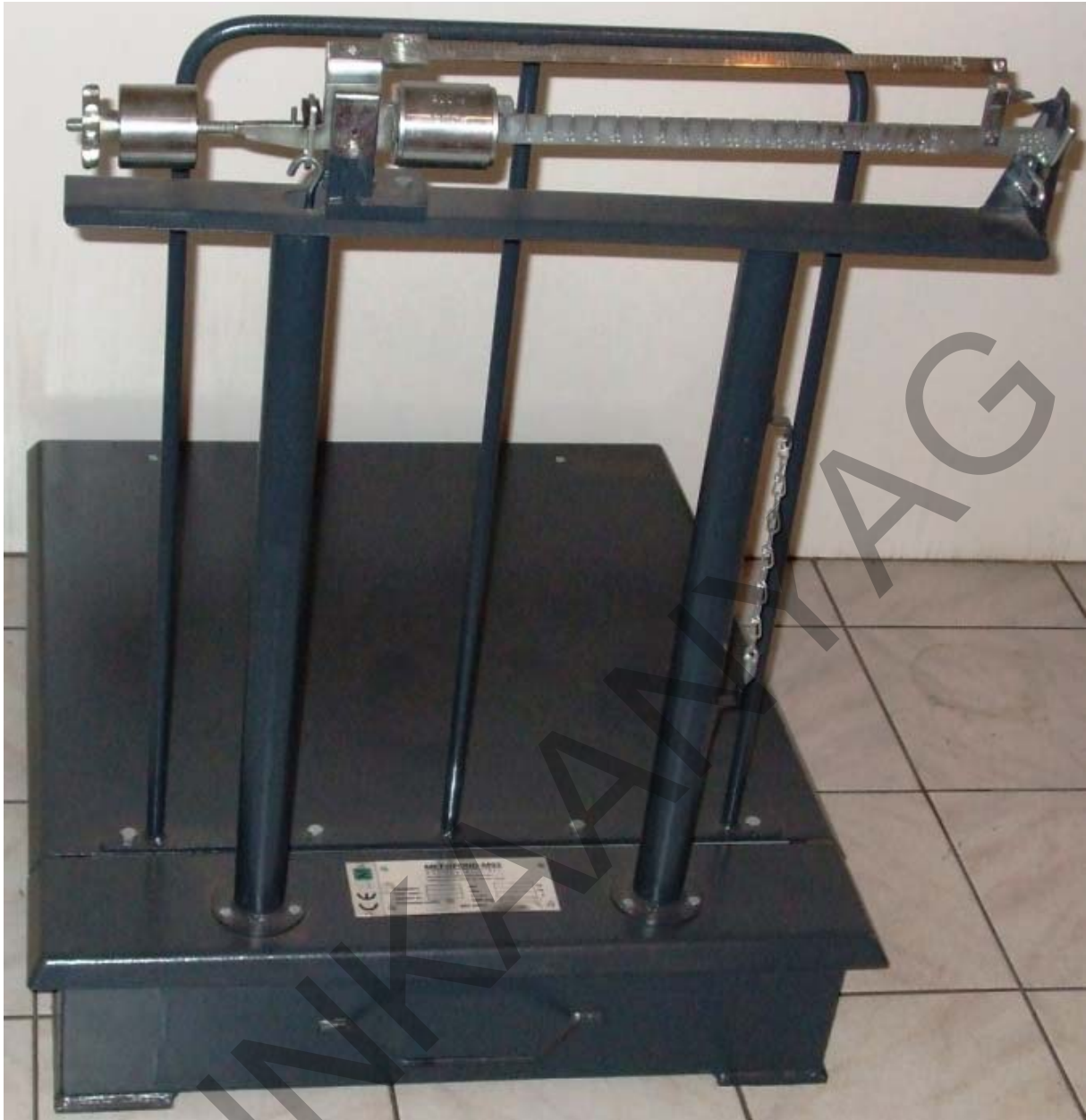
10. ábra. Tolósúlyos raktári mérleg 12