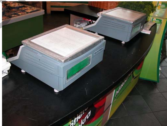
27. ábra. Lédig zöldség-gyümölcs mérésére alkalmas mérleg