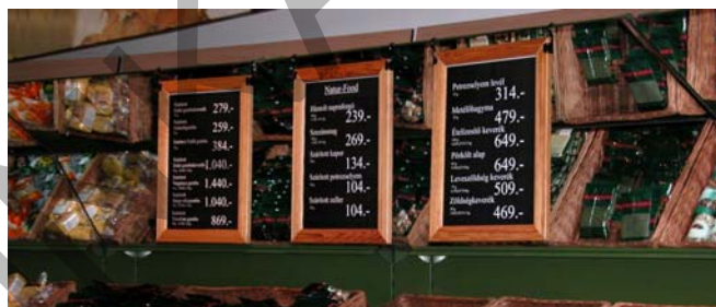
8. ábra. Árfeltüntetetés lédig áruk esetében függesztett ártáblákon

Egyes termékeken az ár – a termék jellegéből adódóan – egyedileg nem tüntethető fel (például: zöldség-gyümölcs áruk, töltelékes áruk, stb.) ilyenkor az adott áruféleség felett vagy mellett elhelyezett feliratok tájékoztatják a vásárlókat az árról.