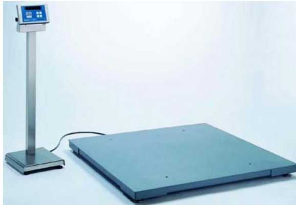
12. ábra. Digitális kijelzővel rendelkező raktári lapmérleg – padlóba süllyeszthető 14