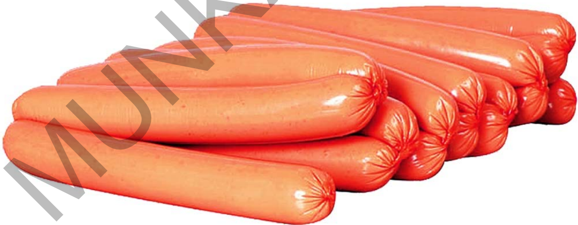
3. ábra. Lédig Pick virslis 5