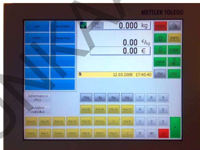
22. ábra. Két kijelzős érintőképernyős mérleg 19