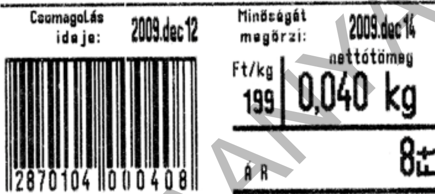
17. ábra. Automata mérleg által készített árcímke 16