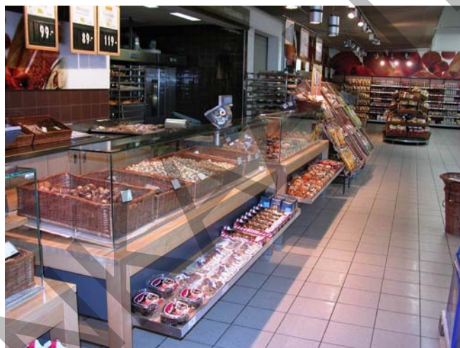
7. ábra. Lédig áruk a pékáru osztályon