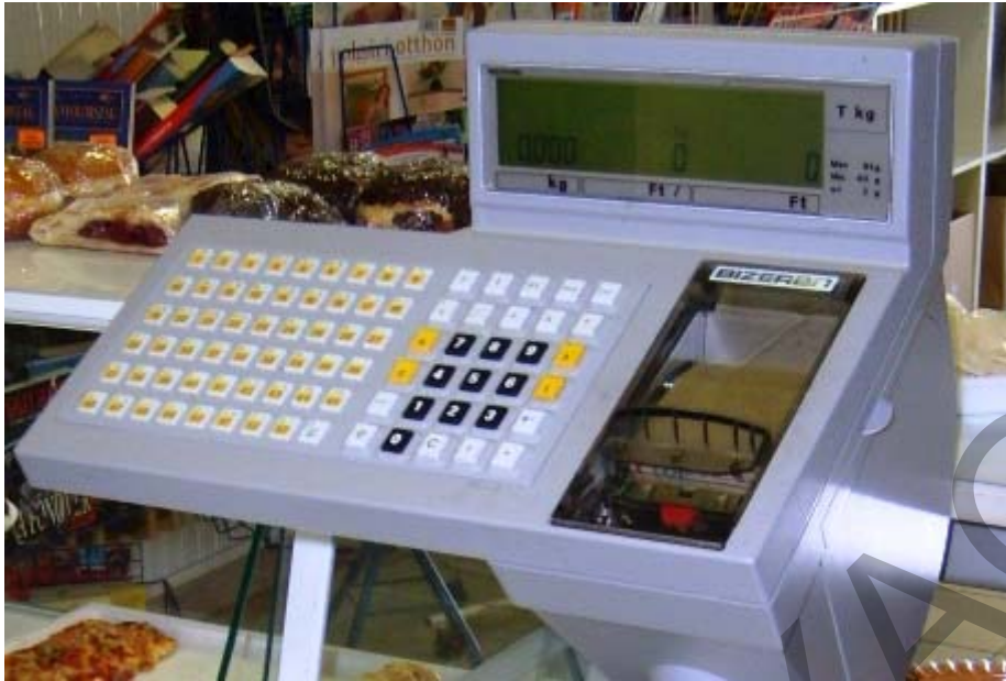
25. ábra. Elektronikus mérleg billentyűmezője