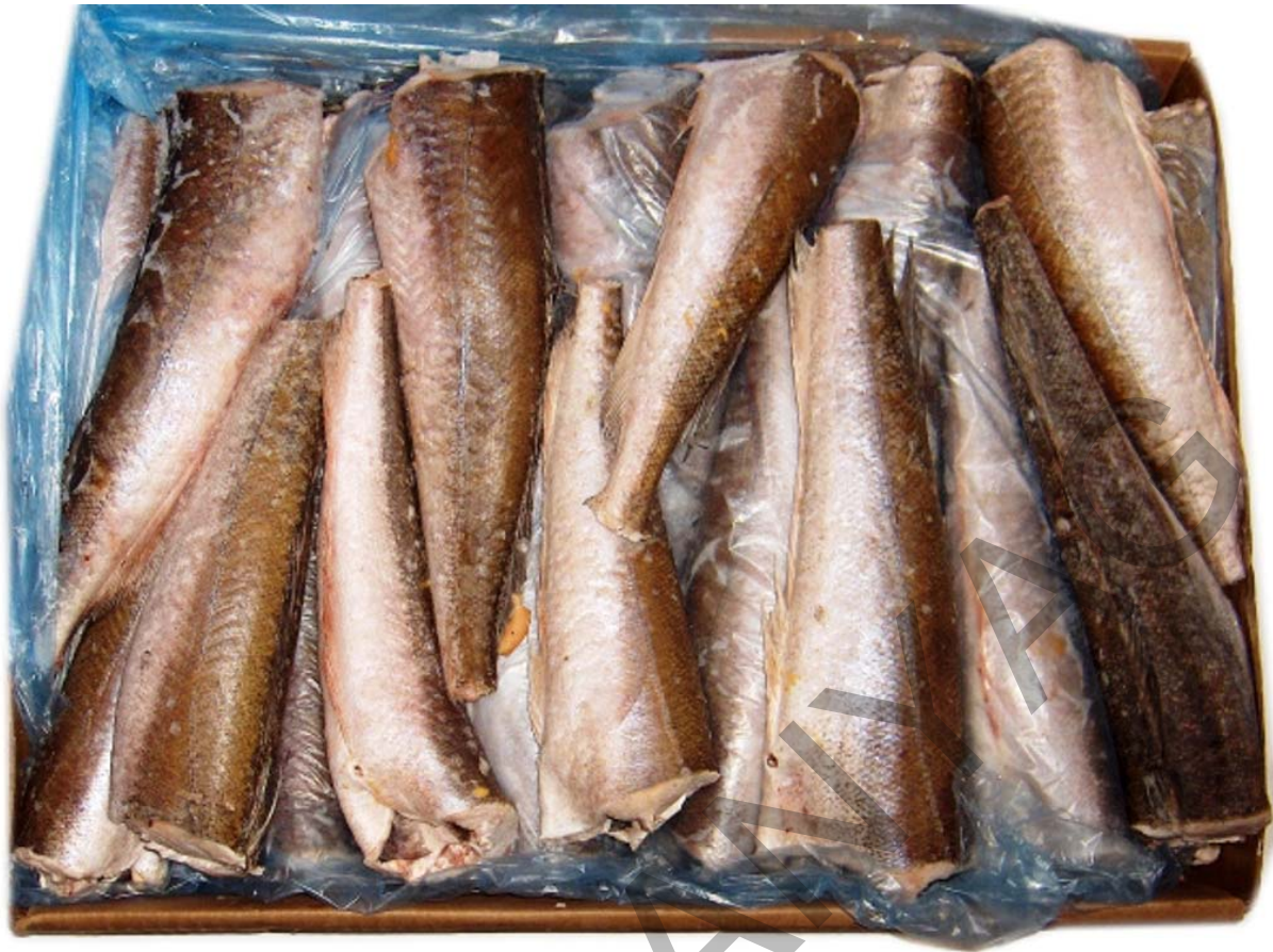
2. ábra. Hekk törzs 300-500g/db lédig fagyasztott 4