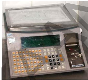
26. ábra. Lédig áruk mérésére szolgáló mérleg (nem tornyos kivitel)