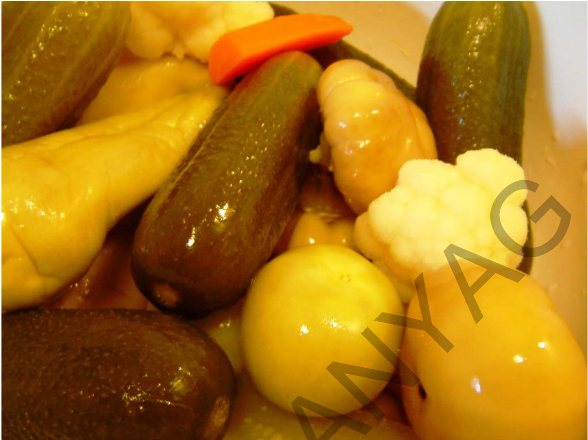
4. ábra. "Kimérős" lédig savanyúság 6