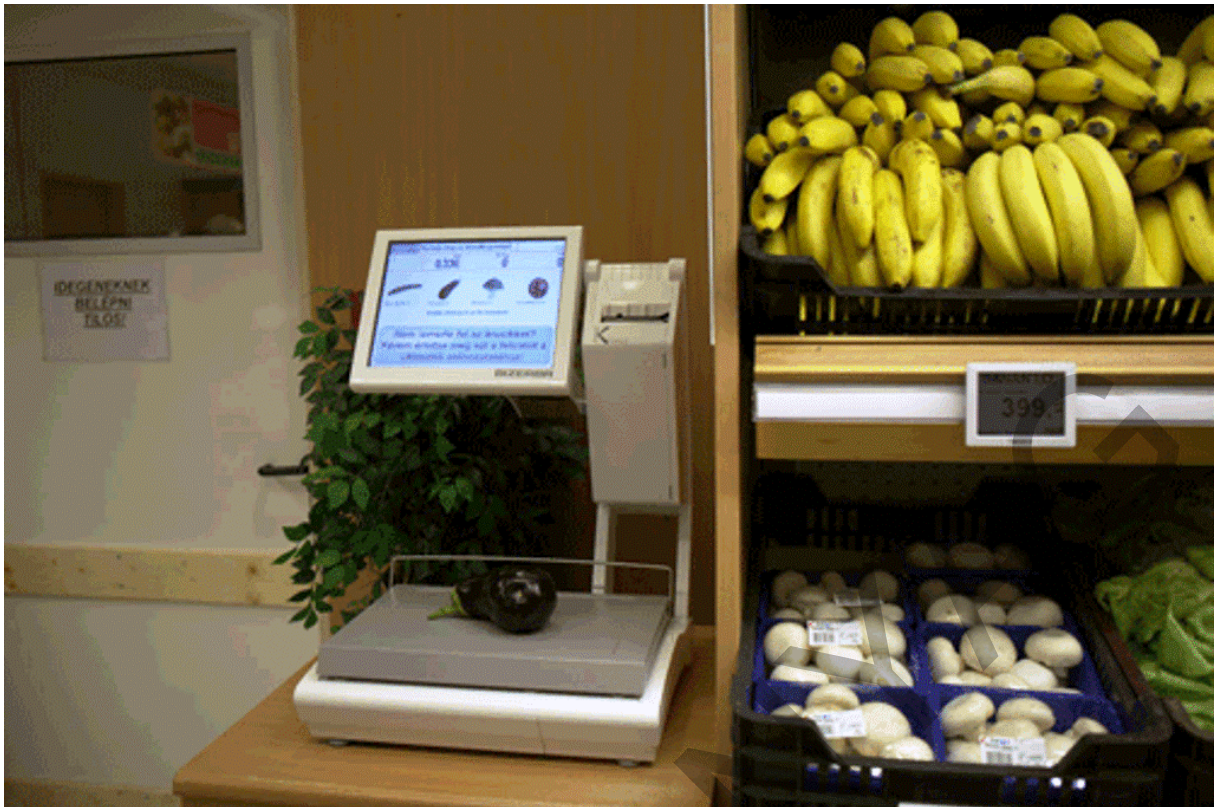
21. ábra. Alakfelismerős önkiszolgáló mérleg 18