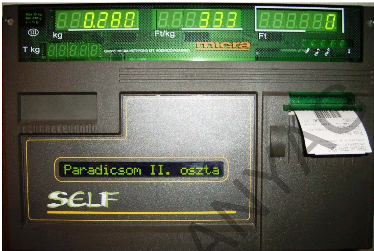
20. ábra. Az elkészült (vonalkóddal ellátott) árcímke