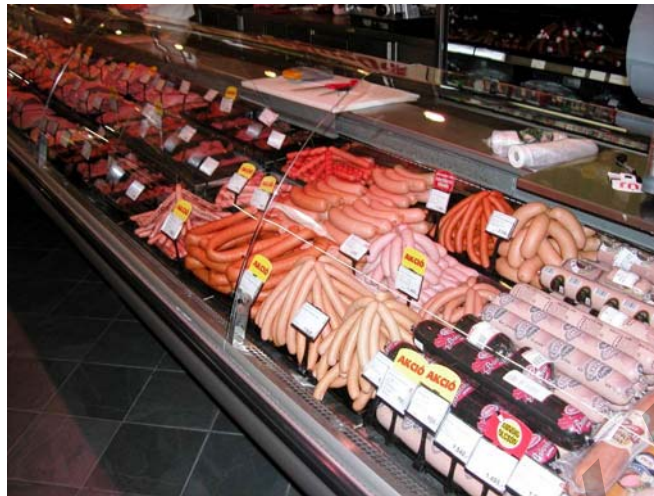
6. ábra. Lédig áruk a hentesáru osztályon