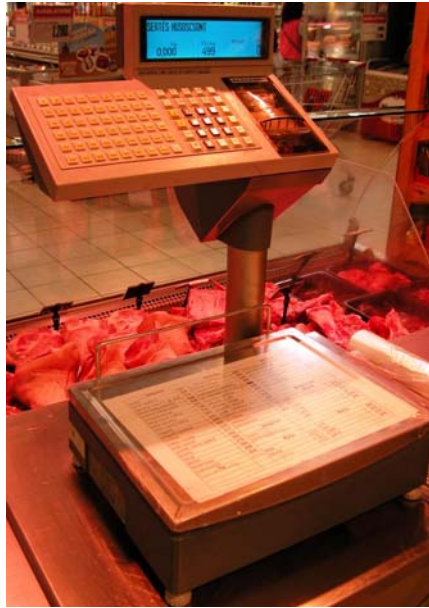
16. ábra. Árcímkét készítő asztali mérleg

Az automata elektronikus mérlegeket akár a vevő is kezelheti. Ezek a fizetendő összeg megállapításán és a digitális kijelzésén túl blokkot adnak (öntapadós címkét) áraznak, illetve nyomtatnak, memóriájukban egységárakat (50–250 árat is) tárolnak.