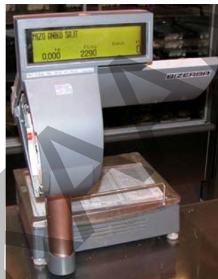
24. ábra. ábra Árcímkét készítő Bizerba mérleg