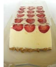
1. ábra Eszterházy – Eperkrém – Parfé torta