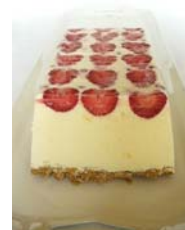
1. ábra Eszterházy – Eperkrém – Parfé torta