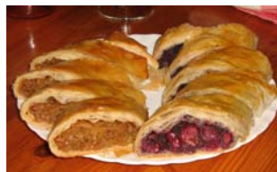
7. ábra Rétesek