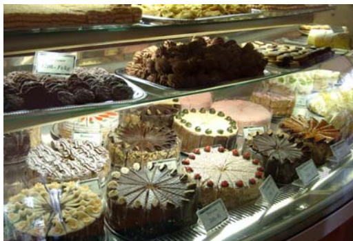
17. ábra Süteményes hűtőpult

A fagylaltot, kimérve árusító üzleteknek fagylaltkönyvet kell vezetniük. Ez szabályos napló, amelyben pontosan fel kell tüntetni a fagylalt származási helyét, előállításának módját, mennyiségét, hőkezelési adatait, azt is, hogy helyben készült-e vagy odaszállították. Az eltarthatóság időpontját is meg kell jelölni, napra, órára pontosan.