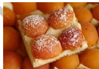
8. ábra Mákos – Meggyes – Barackos pite