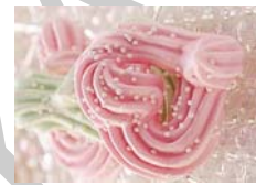
11. ábra Néró - Hókifli - Habcsók