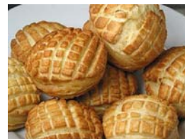
10. ábra Burgonyás – Tökmagos – Tepertős pogácsa