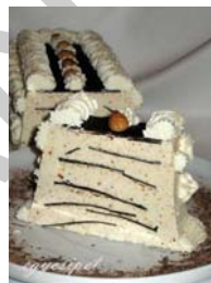
14. ábra Jégkrém – Parfé