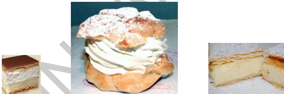
5. ábra Francia krémes – Képviselő fánk – Krémes