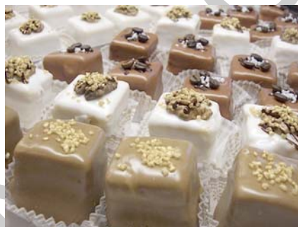
3. ábra Piramis szelet – Ízeseb rolád – Mignon