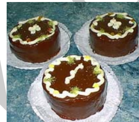
2. ábra Napi – Alkalmi – Zsúr torta