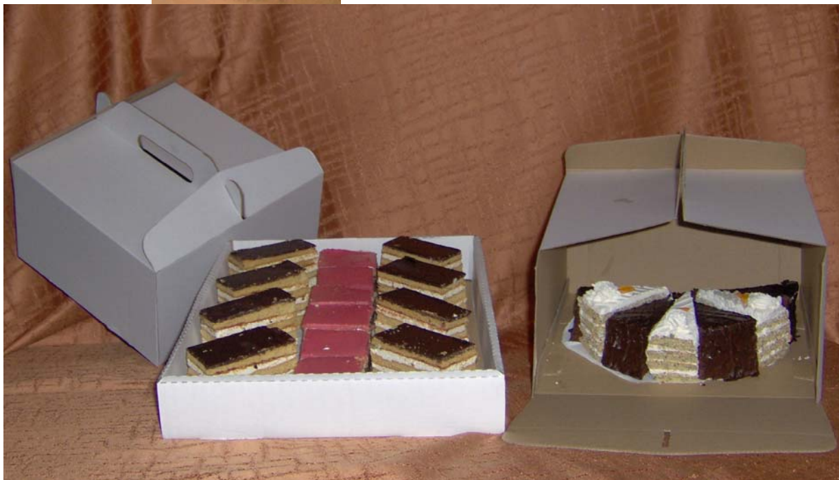
16. ábra Csomagolás dobozba