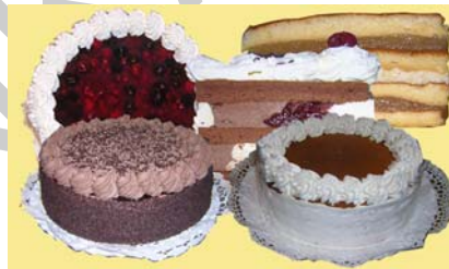
15. ábra Diabetikus sütemények

Diabetikus jelzővel csak olyan készítmény hozható forgalomba, amelynek szénhidrát tartalma egyharmaddal kevesebb a vele azonos tömegű, nagyságú és fajtájú nem diabetikus készítmény szénhidrát tartalmánál. A nem csomagolt diabetikus termékek szénhidrát tartalmát az üzletben kötelesek a sütemény neve, ára mellé jól láthatóan kitenni. Minderre azért van szükség, mert az orvosok a cukorbeteg részére állapotuktól függően, előírják, hogy naponta hány g szénhidrátot fogyaszthatnak. Az üzletben a betegnek kell eldöntenie, hogy melyik süteményből hányat fogyaszthat a napi szénhidrátmennyiség túllépése nélkül.