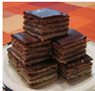
9. ábra Isler – Linzer koszorú – Gerbeaud