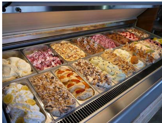
13. ábra Fagylaltos pult

A visszaolvadt fagylalt könnyen fertőződhet: ha ezt a levet újra fagyasztják, mintegy „konzerválják” a fertőző góccokat, és fogyasztás esetén bekövetkezik a rettegett fagylaltmérgezés. Ilyen esetben a fagylaltkészítő helyet és kiszolgáló üzletet a hatóság azonnal bezárja és büntetéssel sújtja a fagylalt készítőjét.