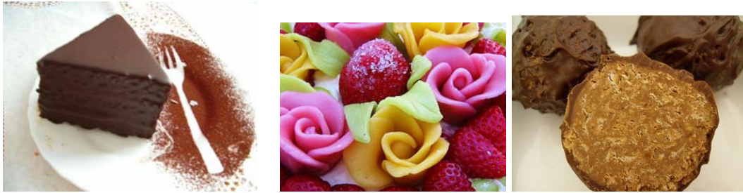
4. ábra Grillázs csemege – Marcipán virágok – Bambi csemege