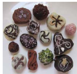
12. ábra Bonbonok – bonbondesszertek