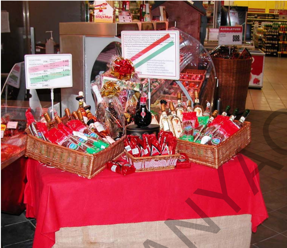
5. ábra Hungarikum sarok az Interspar áruházban