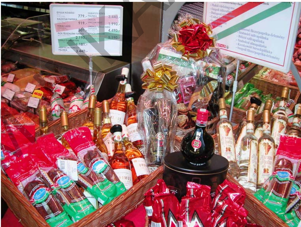
6. ábra Hungarikumok a bemutató asztalon