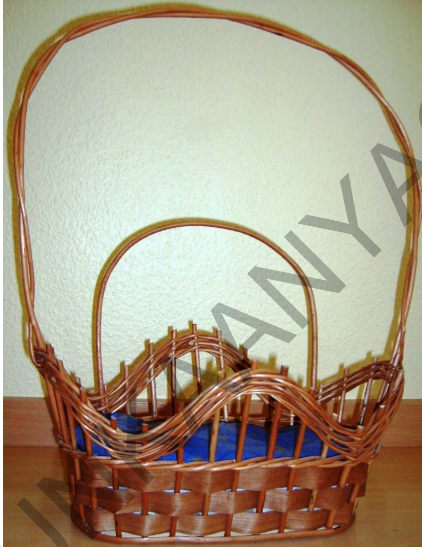
8. ábra Fonott vesszőkosár – ajándékkosárhoz