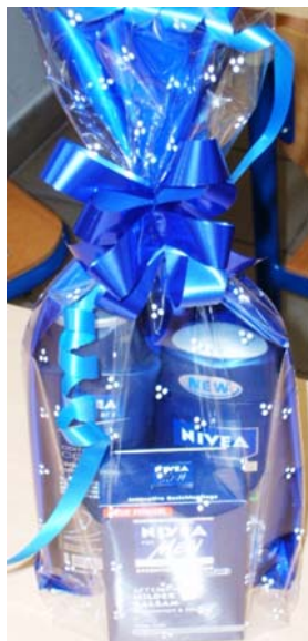
1. ábra Előre csomagolt férfi illatszer csomag

A ajándécsomag készítése/díszcsomagolás készítése általában a kereskedelmi egységeken a vevő kérésére történik. Vannak olyan egységek, ahol előre elkészített ajándécsomagokból, előre díszcsomagolt desszertekből és márkás, különleges italárukból, női és férfi kozmetikai cikkekből és illatszerekből is válogathatunk.