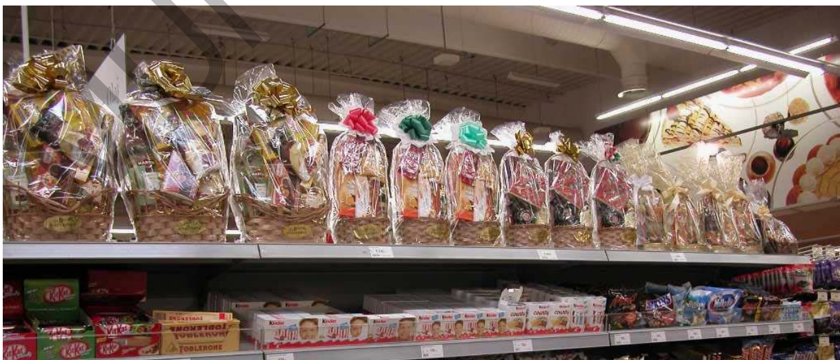
3. ábra Előrecsomagolt ajándékkosarak az Interspar áruházban

Leendő eladóknak ajánlom, az idősebb kollegáktól való ismeretszerzést. Figyeljük meg tanulóként az idősebb tapasztaltabb munkatársakat, hogy készítik ezeket a csomagokat és kosarakat. Nézzük meg – figyeljük meg a szakmai fogásokat, és saját csomagolási munkánknál használjuk fel ezeket a "trükköket" és ötleteket.