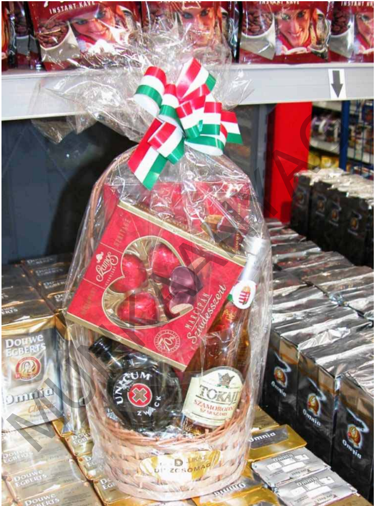
7. ábra Hungarikumokból összeállított ajándékosár