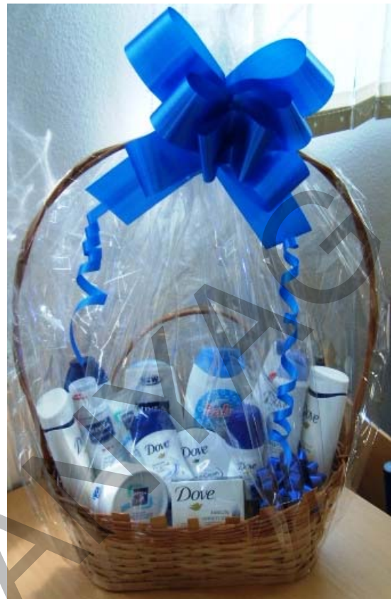
4. ábra Illatszerekből/Kozmetikumokból összeállított ajándékkosarak