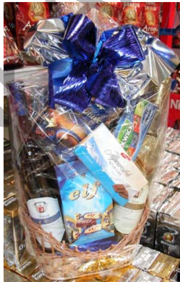
9. ábra. Az így elkészült kosarunk