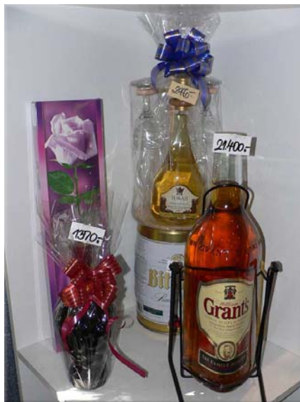
2. ábra Előre csomagolt italárak 2

A díszcsomagolást végezheti a kereskedelmi egység is, de jellemzően például ünnepek előtt maguk a gyártók is ünnepi csomagolásban, díszdobozokban hozzák forgalomba áruikat például: Corvinus Kalocsai különleges fűszerpaprika 250g. díszdobozban, Tokaji Aszú 3 puttonyos borkülönlegesség 500ml ajándék pohárral, stb.