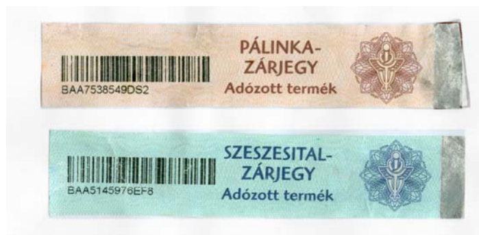
1. ábra. A pálinka és a szeszesital zárjegye

A zárjegy a terméknek azon a legkisebb csomagolási (kiszerezési) egységén legyen felragasztva, amelyben a termék a fogyasztóhoz kerül. A zárjegyen feltüntetett szövegnek és sorszámának olvashatónak, a vonalkódnak teljes terjedelmében láthatónak kell lennie.