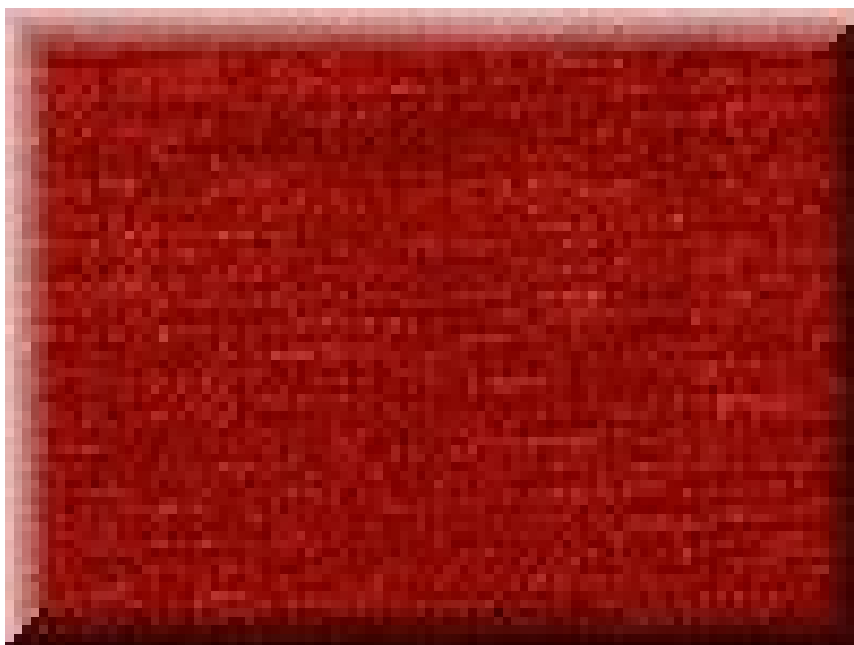
1. ábra. Gobelint bútorszövet 1

Ezek jacquard mintázatú, gyapjú típusú bútorszövetek. Gazdag virág-, illetve levélmintázattal készült tarkánszőtt szövetek, amelyek előállítása rendszerint sűrű vászonkötéssel történik. Külsőjükben, megjelenésükben a kézi szövésű gobelint próbálják utánozni. Esztétikus, mutatós szövetek, amelyeket főleg antik-és stílbútorok bevonására használnak fel.