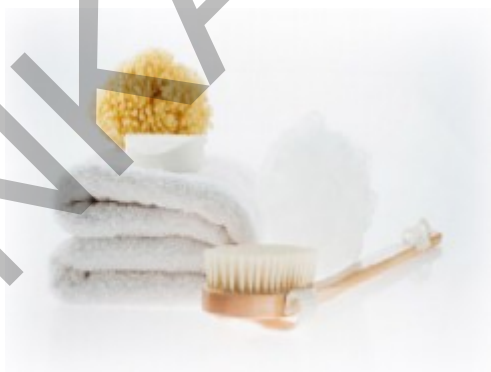
3. ábra. Törülköző és egyéb kiegészítő termékek 3

A törülköző használati tárgy és a fürdőszoba díszé is egyben. A fürdőhelyiségben található csempével harmonizáló színű törülközők választásával fokozhatjuk az esztétikai hatást.