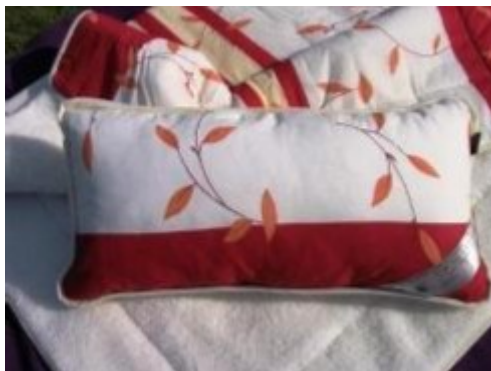
2. ábra. Ágyneműgarnitúra 2

Szintén 100 százalékban természetesek és antiallergének a selyempaplanok, amelyekről azt állítják, hogy stresszoldó hatásúak. A selyempaplan népszerűsítésére szolgáló cégek szerint ez a selyem 18-féle aminosavat tartalmaz, ráadásul olyat, amelyek az emberi test számára nélkülözhetetlenek. És ami a mai kor emberének nagyon fontos tényező: állítólag ebben a selyemben lévő aminosavak megelőzik az öregedést és nyugtatják az idegrendszert is. De a selyemből készült paplanok, amellett, hogy az egyik legdrágább árfekvésű termékek csak nyári melegben ajánlottak, mert a bőrrel érintkezve úgynevezett hűvös érzetet keltenek.