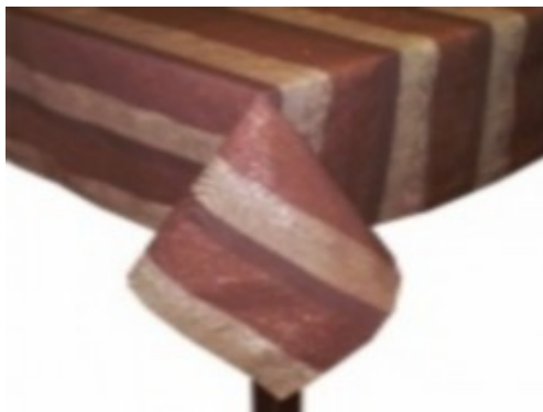
4. ábra. Dekor aszalterítő 4

Néhány éve nálunk is nagy divatját éli az aszalterítő+asztalközép változat. Ez azt jelenti, hogy az általában négyzet alakú asztalneműhöz színben és mintázatban harmonizáló asztalközép tartozik. Régebben ezt csak vendéglátóipari helyeken alkalmazták, de az utóbbi években már kiskereskedelmi forgalomba is kaphatóak.