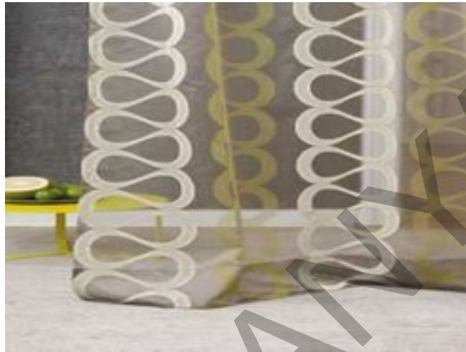
1. ábra. Voilé függöny 1

A voilé a legolcsóbb és emiatt a legkedveltebb fényáteresztő függönnyefajta, a szivárvány minden színében kapható, nyomott mintás és hímzett változatban is. Könnyen kezelhető, jó fényáteresztő tulajdonságú.