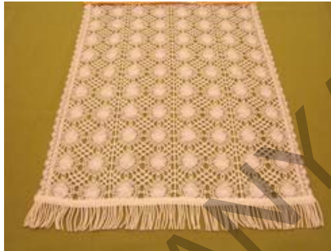
3. ábra. Klöpli függöny 3

A klöpli a vert csipkéből származik, csak éppen gyári készítésű, éppen ezért megvehető árkatégoriát képvisel, igaz nem tud olyan egyedi darab lenni, mint kézzel készített fajtája.