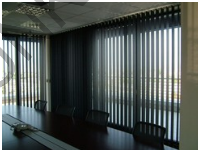
4. ábra. Motoros szalagfüggöny 4

A szalagfüggönyöket lakástextil üzletben is meg lehet vásárolni, de legnagyobb részüket-mivel beszerelésük némi szaktudást is igényel- redőny-reluxakészítő kisiparosok forgalmazzák, akik a garanciális felszerelést is elvégzik.