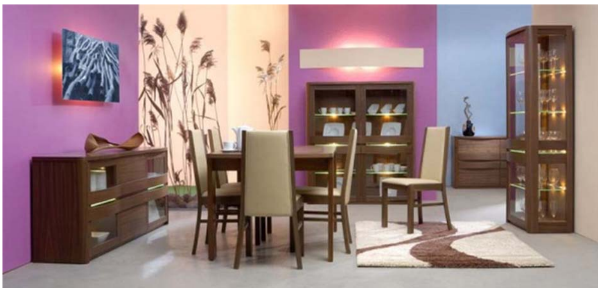
14. ábra. Komplet modern étkező 14