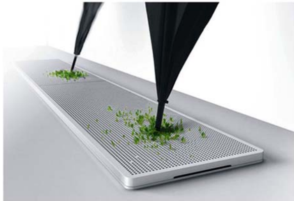
2. ábra. Több mint tárgy. Esernyőtartó, mint kedves kreatív ötlet: az esernyőben behozott víz növénykét táplálja 2