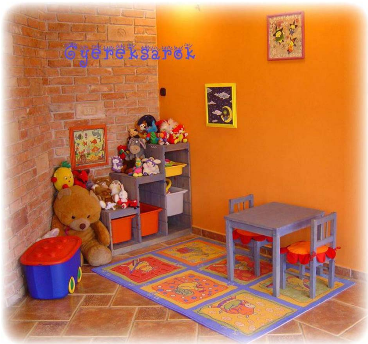
34. ábra. Gyereksarok 34

Ebben az életkorban a gyerekük-idejük nagy részét a padlón játszva töltik. A padló anyaga lehet padlószőnyeg, parketta, hajópadló vagy parafa, szőnyeggel ellátva. A szőnyeg hátoldalát érdemes ellátni csúszásmentesítővel. Fontos a bútorok elhelyezése. Praktikus, ha a bútorok a falak mentén helyezkednek el, hogy megmaradjon a szoba közepén lévő tér a játéknak. A játékok elhelyezésénél fontos, hogy a picik önállóan elővehessék, és el is tudják rakni a holmikat. A rajzolás, gyurmázás minden kisgyerek kedvelt tevékenységi formája, ehhez válasszunk jól letisztítható kisasztalt és székeket (34. ábra).