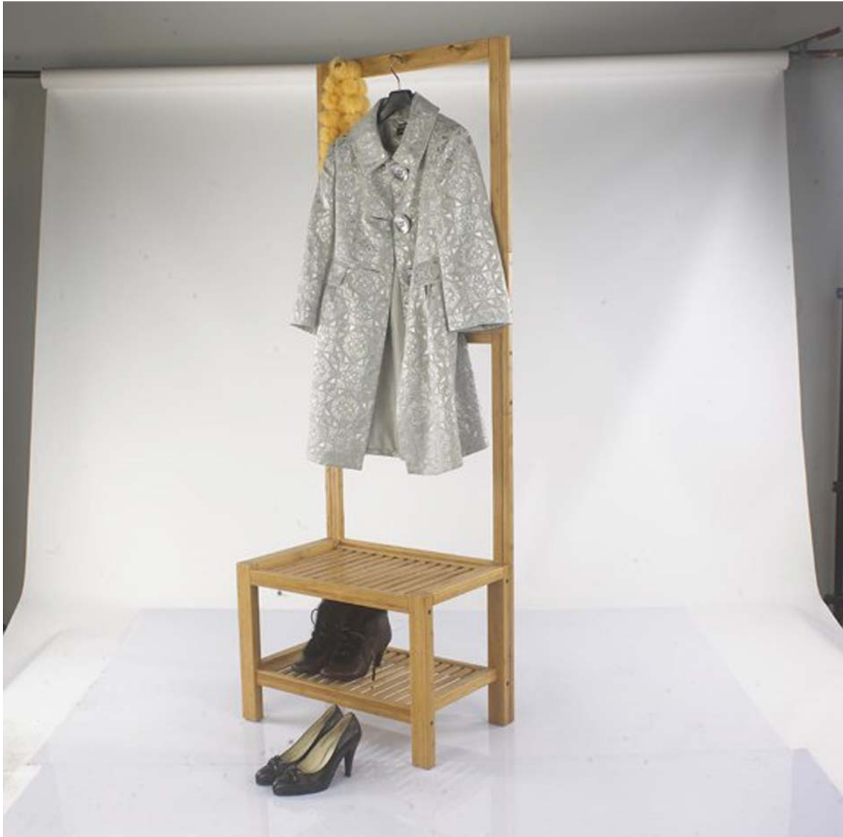
4. ábra. Előszoba-mininál: tényleg csak a legszükségesebb... 4