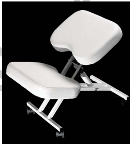
21. ábra. Térdeplőszék- nem mindenkinek jön be... 21