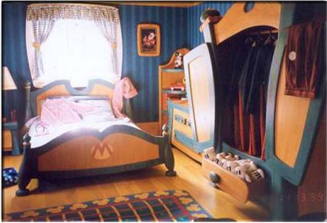
31. ábra. Sok szülő vágya az álom-gyerekszoba. Kamaszkorban már kicsit kínos lesz... 31

Ezek a játékos tárgyak természetesen fontosak a gyermek életében, de mivel a gyerekek igénye és világa gyorsan változik, ezért biztosak lehetünk benne, hogy hamar unalmassá válnak hosszútávon nem praktikusak, és nem is szolgálják a gyerek fejlődését egy időszakon túl. Hacsak nincs pénzünk a gyerekszoba bútorozásának 1–2 évenkénti teljes cseréjére, praktikusabb a szobát a gyerek korának és fejlődésének megfelelő dekorációkkal díszíteni csupán. Szűkebb pénztárcával hosszútávon mindenképpen a moduláris felépítésű, többfunkciós bútorzaté a jövő, amely praktikusán változtatható, mérete átalakítható, könnyen bővíthető. Egy jól választott fejleszthető gyerekbútor az óvodás kortól a kamaszkorig elkísérheti a gyermeket–biztonságot adó állandóságot nyújtva, anélkül hogy a berendezés a kamaszkori barátok előtt kínossá válna (31. ábra).