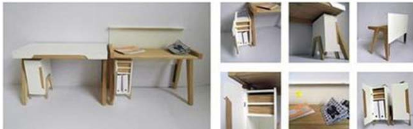
17. ábra. Frappáns megoldás az összecsukható, elrejtethető otthoni iroda 17

A jól megválasztott bútorzat és azok kényelmes elhelyezése, évekre meghatározza munkavégzésünk ritmusát és hangulatát, illetve ezen keresztül a hatékonyságunkat, és egészségi állapotunkat is. Egy íróasztal akkor jó, ha fel sem kell kelniünk a székből, minden a kezünk ügyében van. Az ergonómia szabályai szerint, legyen minden karnyújtásnyira. Ezért népszerűek az L-alakban elrendezett íróasztalok (18. ábra). Ebben kényelmesen dolgozhatunk, mivel elérhető egyik kézzel a telefon, másikkal az írógép. Csökken a balesetveszély, az egészségkárosodás és nő a termelékenység.