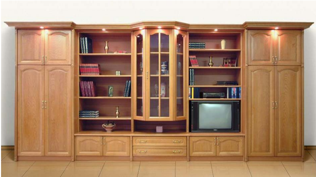
11. ábra. Hagyományos, zárt sorolású nappali szekrénysor 11

Szekrényre szükségünk van, de lehetőség szerint ne nagyméretű darabok uralják a teret (11. ábra). Egyre gyakrabban kerül a nappaliba a család számítógépe az internetes kapcsolattal. Nem igényel nagy helyet, de térbeli elkülönülést mindenképp. Próbáljuk meg részben takarni valamilyen bútorral, szerelt falszakasszal, paravánnal, hogy kevésbé zavarja a helyiségben tevékenykedő többi családtagot! A népi hagyományok nagy étkezőkonyhája szinte teljesen eltűnt a mai modern otthonokból. Nagyon gyakran egyterű a konyha-étkező-nappali, ami hangulatos is, és nagyon sok praktikus oldala van ennek az elrendezési formának, mindenképp jelezzük azonban a funkciók határait. A konyha-ebédlő közé kerülhet étkezőpult, alacsony fal, térbeállított bútor is. A főzés közben keletkező szagokat mindenképp ki kell vezetni egy elszívóval a kinti térbe. A nappali berendezése nem lezárt folyamat egy családban. Folyamatosan alakul a gyerekek növekedésével, életmódunk változásával, újabb és újabb tárgyak vásárlásával.