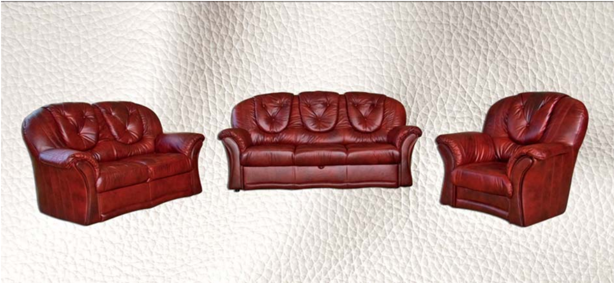
8. ábra. A magyar lakáskultúra mindmáig meghatározó eleme a 3+2+1 fölállású, nehézkes-lehetőleg bőr- ülőgarnitúra 8