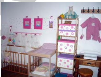
33. ábra. A legszükségesebbek. Elég, ha praktikus és kedves. 33

Érdeemes a csecsemő szobáját úgy kialakítani, hogy az ne legyen túl „babás”, hogy majd a gyermek három–négy éves korában is jól érezze magát a kialakított színek és díszítőmotívumok között. A pár hónapig tartó időszakban szinte csak nyugalomra és anyai szeretetre, gondoskodásra van szükség. Alapbútorként olyan berendezési tárgyakat válasszunk, amelyek bővíthetők, és legalább iskoláskorig kiszolgálják az igényeket. Első és legfontosabb a babaágy. Színe, formája egyéni ízléstől függ, de természetes anyagú matracot válasszunk. Praktikus a pelenkázó használata is, mert kíméli a kismamát, nem kell lehajolnia babaápolás közben. Egy kényelmes fotel is jó szolgálatot tesz szoptatáskor. A csecsemő ruhájának szánt első tárolóbútor beszerzésekor már érdemes kissé előre gondolkodni, legalább az iskoláskor határáig.