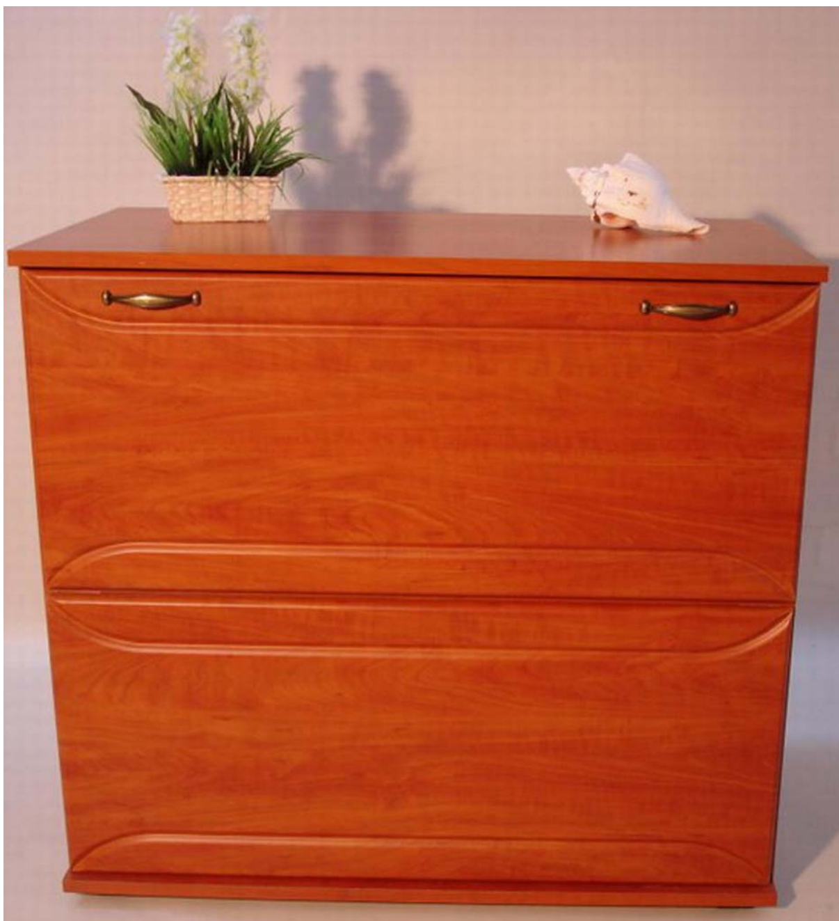
24. ábra. Önálló ágyneműtartó szekrény- nehéz elrejteni... 24