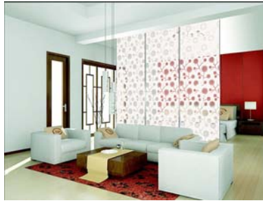
7. ábra. Nappali és hálószoba egy térben?

Az alapterület és a sokféle tevékenység függvényében úgy kell elhelyeznünk a kiválasztott vagy már meglévő bútorokat, hogy a funkciók jól elkülönüljenek, és ne zavarják egymást, de szükség esetén kapcsolódhassanak is. A helyiségben a közlekedési útvonalak és a nyugalmi helyzetek teremtenek egyensúlyt. Így válik áttekinthetővé a tér. Mindenképp választanunk kell legalább egy fókuszpontot, egy olyan központi helyet, ami már a belépéskor megragadja a figyelmet, magához vonz, szinte hívogatja a családtagokat és a vendégeket is. Fókuszpont lehet pl. a kandalló, egy kellemes ülőbútor együttes, esetleg egy szép és értékes gyűjtemény is, melyhez esetleg egy jól választott érdekes bútor ad keretet. Ezen túlmenően a pihenő vagy ülőbútorok határozzák meg – már csak méretüknél fogva is – a berendezést. Jó ha ezek mobilizálhatók, szükség esetén könnyedén áthelyezhetők. Nem kell ragaszkodnunk a megszokott 3+2+1-es kanapé-fotel összeállításhoz (8. ábra). Összeállíthatunk beszélősarkot csak fotelekből vagy csak kanapéból is. Ügyelnünk kell azonban arra, hogy minden személynek egyenrangú ülőhelyet biztosítsunk. Akkor tudunk jól beszélgetni, ha nem ülünk túl sokan egymás mellett, mert így nem látjuk a másikat.