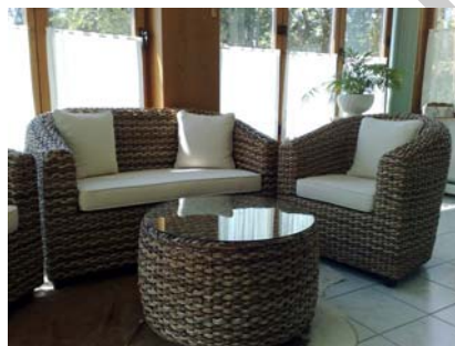
9. ábra. Egy könnyedebb ülőgarnitúra megoldás 9

Próbáljuk meg a televíziót ne házi oltárként kezelni! Szerepe persze fontos, elhelyezésére is figyeljünk. A képernyő magassága ülőhelyzetben legyen szemmagasságban vagy szemmagasság alatt. Ideális távolsága az ülőbútortól a képernyő függőleges méretének ötszöröse. A sötétben való tévézés rossz hatással van a látásunkra. Ennek ellensúlyozására helyezünk kisteljesítményű fényforrást a készülék mögé – természetesen nem látható helyre. A tárolási szokások és a szekrénybútorok divatjának pozitív változása kiszorította a nagytestű bútorokat a nappali teréből. A régi egybefüggő kombinált szekrény sorok – amik ruhát, könyvespolcot, bárpolcot, vitrint foglaltak magukba – különváltak. A ruhásszekrény a gardróbba vagy a hálószobába került, a könyvespolcok, vitrinek, bársekreény önálló egységként, kisbútorként élnek tovább a lakószobákban.