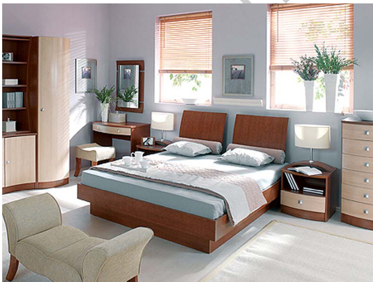
22. ábra. Komplet modern hálószobagarnitúra 22

A hálószoba lakásunk legintimebb zónája, az a helyiség, ahol a hosszú nap végén végre lepihenhetünk, ahol távol a világ zajától ellazulhatunk és feltöltődhetünk. Az ideális hálószoba visszafogott, mentes minden fölösleges ingerforrástól, ugyanakkor barátságos és meghitt. Nem a méretek, hanem a kényelem a fő szempont. A meghitt hálószoba inkább kisebb méretű, ahol fölösleges tárgyak nem zavarják pihenésünket (22. ábra). Ideális esetben levetett ruháinkat sem itt tároljuk, hanem a közeli gardróbban, esetleg a fürdőszobában. Van, ahol a lakás mérete miatt az ember kénytelen a nappalit és a hálószobát egy helyiségre redukálni. Ilyenkor érdemes elgondolkodni azon, hogyan választhatók szét mégis a nappali és az éjszakai funkciók (7. ábra). A klasszikus hálószoba berendezése ágy (általában duplaágy), éjjeliszekrény, hálószobaszekrények, fésűködő szekrény, lerakószekrény – vagy inkább lerakó puff (22. ábra).