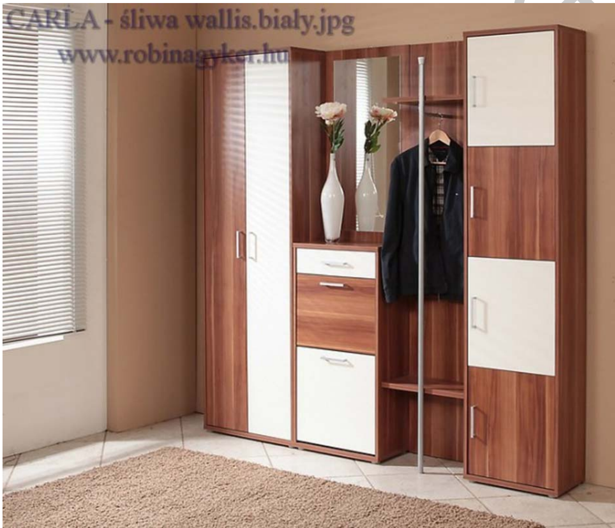
5. ábra. Zárt szekrényes előszoba nyitott akasztórészsel 5

A zárt szekrényes előszobabútorok például jótékonyan takarnak, és a rendezettség illúzióját keltik a csupán fogásra felaggatott kabátokkal szemben, viszont macerásabb is a használatuk. Célszerűbb hát egy kombinált tárolót választani (5.ábra). Amit ritkábban használunk – esernyő, meleg kabát, gumicsizma –, azt mind a zárt szekrényben tároljuk, a mindennap használt köpönyegek meg egy tetszetős fogason is viríthatnak. A kisgyermekes családok előszoba-berendezése külön kategória. Itt a felnőtt fogasok mellé egy szinttel lejjebb érdemes egy kisebb, kifejezetten gyerekeknek készült akasztót is kihelyezni. Nem árt, ha a gyermekeknek elhelyezünk egy kis széket vagy kicsi ülőpadot is az előszobában. Ők ugyanis még nemigen tudják állva felvenni a cipőjüket.