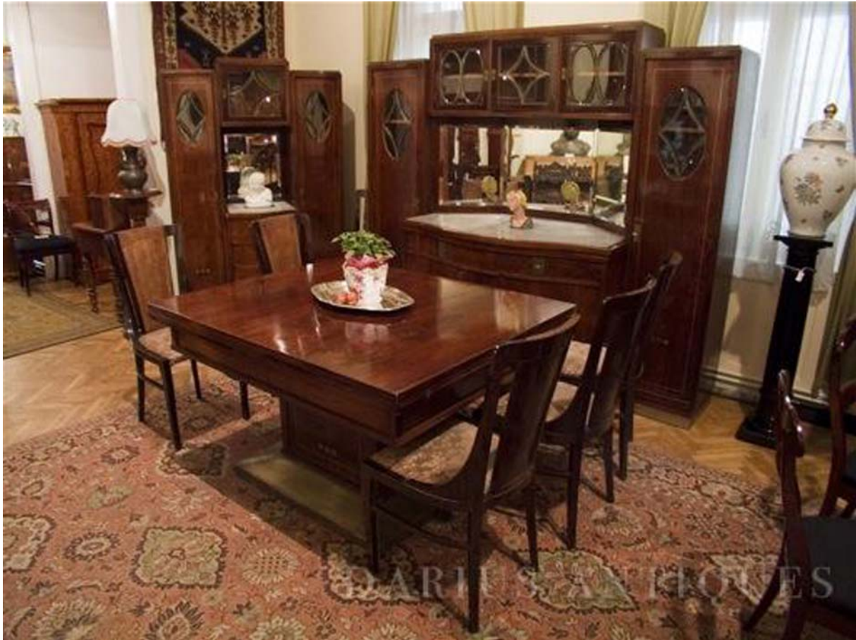
13. ábra. Klasszikus étkező 13

A garnitúrát kiegészíthette még egy alacsony kétajtós- vagy fiókos- komód. Ez a klasszikus berendezés-együttes a mai lakások méretéhez és a társadalmi szokásokhoz alkalmazkodva legföljebb 8–10 fővé bővíthető asztallá redukálódott, a tálaló pedig többnyire egy bútordarabra korlátozódik, mely alul egy mélyebb zárt szekrényrész, felül pedig egy keskenyebb, többnyire üvegezett ajtóval ellátott szekrényrész, mely ily módon magában foglalja a vitrinfunkciót is. Ha egy ilyen együttest sikerül a lakásunkban elhelyezni, akkor már meg tudtuk adni az étkezés kiemelt rangját, de a nagyobb lakások tulajdonosai gyakran vásárolnak komplett modern étkező-berendezést (14. ábra), melynek helyigénye ugyanakkora, mint a hagyományos garnitúráé, és funkciói is azok (tárolás, reprezentáció) csak stílusukban különböznek- modernek. A modern és klasszikus viszonyának megfogalmazása, tárgyba öntése komoly tervezési feladat, nem lehet öletszerűen létrehozni néhány felszínes szempont alapján (15. ábra)