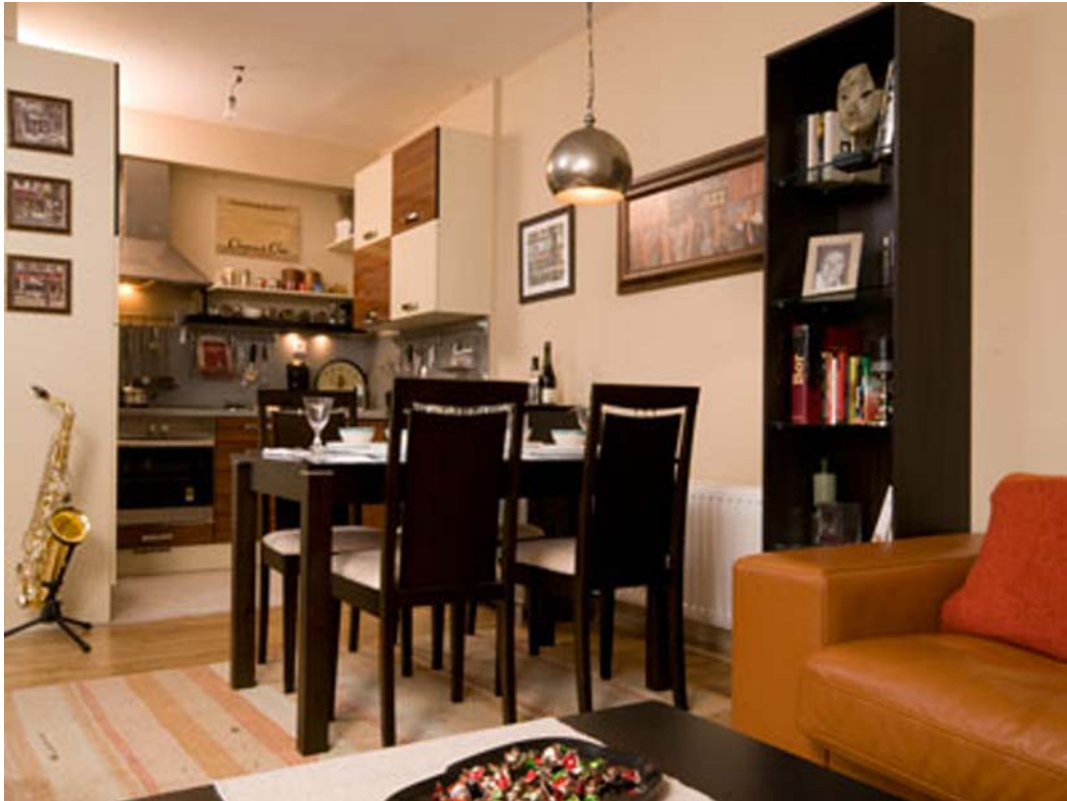
12. ábra. Nappalival összeéőr étkező, háttérben a konyha 12