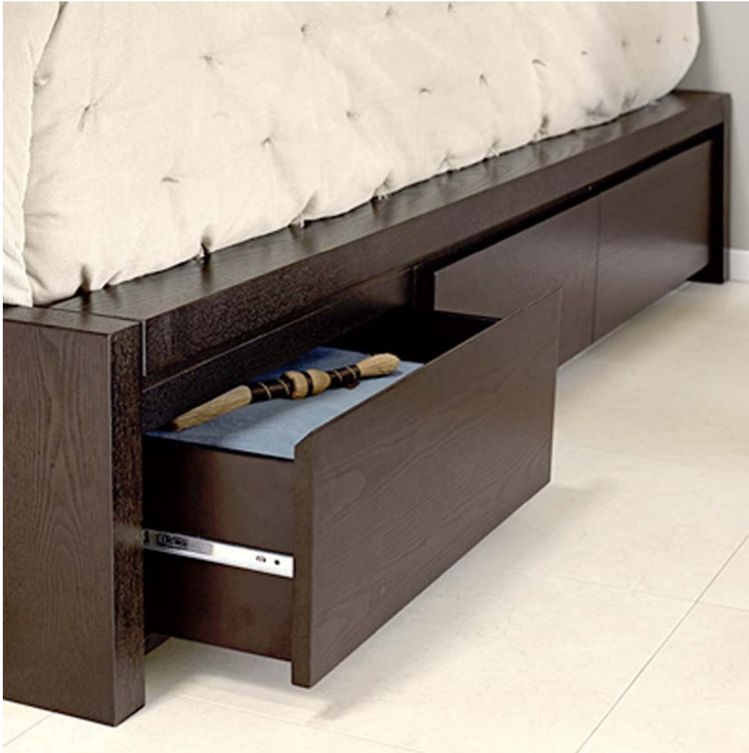
25. ábra. Ágyneműtartós ágy 25