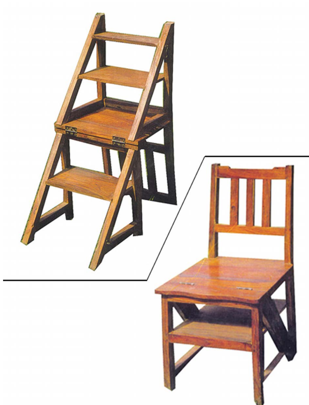
36. ábra. Praktikus és érdekes. Nincs rejtegetnivalónk egy létraszéken 36