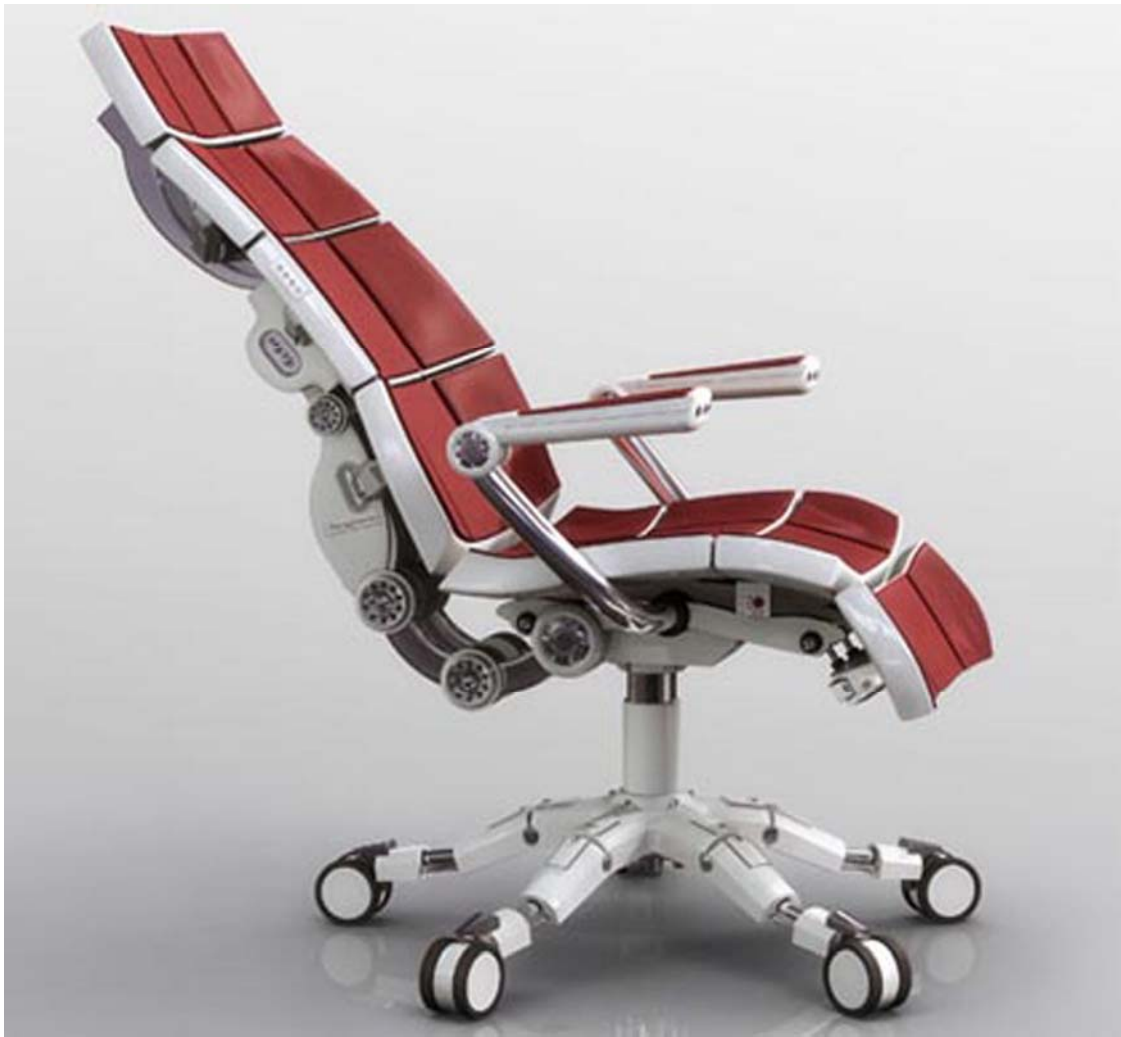
19. ábra. Ez talán túlzás, de egy jó munkaszékre valóban érdemes költeni. (Aeron – testhelyezethez igazodó ,robot' irodai szék) 19