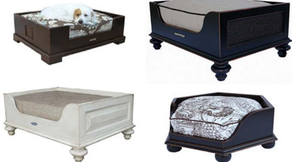
35. ábra. Kutyafekhely stílusosan...Ez is lehet a lakás bútorozásának a része 35