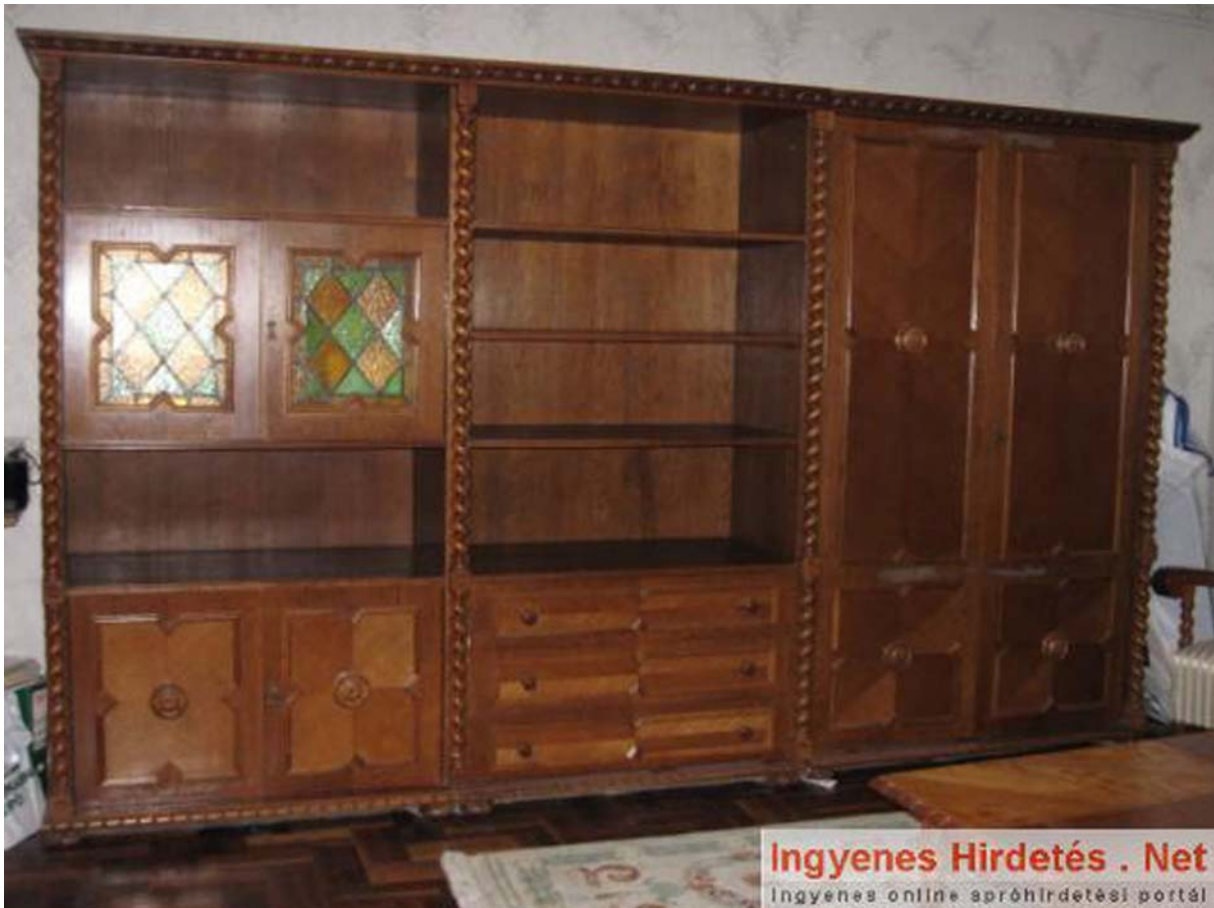
1. ábra. Nostalgia: egy sosem létezett stílus, mint klasszikus érték a mai magyar lakáskultúrában 1

A különböző funkcióknak a különböző történelmi korokban voltak megfelelően kialakított terei is. Hogy mikor melyik kapott nagyobb hangsúlyt, az az adott kortól, a lakás tulajdonosának társadalmi rangjától, anyagi helyzetétől, a divattól, a szokásoktól függött. A mai átlaglakások legtöbbszörben a nincs minden funkció számára külön hely: a funkciók fedik, vagy váltják egymást. Például a nappali egy sarka néhány hónapig, vagy akár két évig is átalakul babasarokká, ahol a pelenkázó és a járóka helyet kap. A lakás egyes terei, térszakaszai általában egyidejűleg több funkciót is betöltenek, a funkciók keresztezik egymást. Egy átlag mai magyar lakás a következő funkciókat betöltő tereket tartalmazhatja: