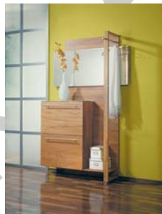
3. ábra. Kis méretű lakásba alkalmas előszobafal, nyitott és zárt résszel, tükörrel 3