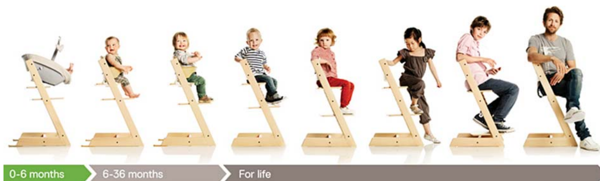
32. ábra. Bútor, mely együtt nő a gyerekekkel 32