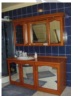
29 ábra. A tömör fából készült vagy furnérozott bútor talán nem szerencsés választás egy fürdőszobában. A teli lábazatú bútor viszont biztosan rossz döntés. 29

A fürdőszoba szintén az intim szféra egyik kiemelt helyszíne. A fürdőszobának ugyanakkor a használat körülményeiből eredően speciális technológiai szempontoknak is meg kell felelnie, akár csak a konyhának. Fontos szempont a fürdőszoba tervezésénél a beépítésre kerülő anyagok ellenállósága vízzel, gőzzel és kemikáliákkal (lúgok, savak) szemben, de az is elvárható, hogy könnyen és gyorsan takaríthatók legyenek. Legtöbbször a természetes anyagok – bármennyire is kívánatos lenne e célra történő felhasználásuk – alkalmatlanok, mert a különféle gombák és baktériumok, könnyen megtelepedhetnek rajtuk (29. ábra).