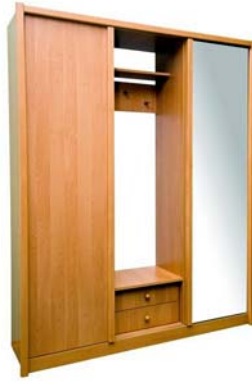
6. ábra. Ár-értékarányos, praktikus előszoba. Semmi extra. Praktikus és semleges, mégis van hangulata 6