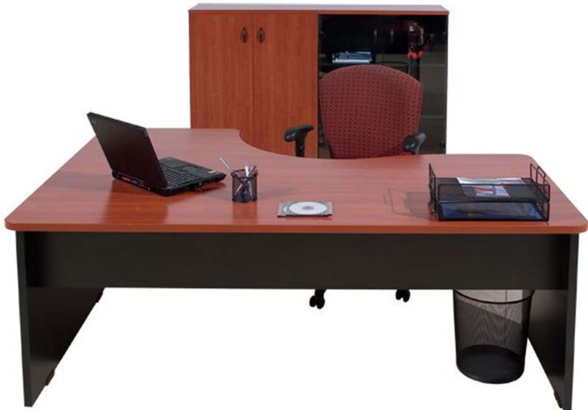
18. ábra. A klasszikus L-alak 18