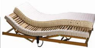
28. ábra. Az ágy lassan gépezetté válik alattunk 28

A matracoknak ma már nagyon széles választéka van, széles árkatégória-sávban (28. ábra). Van tehát miből válogatni, és a munkaszék mellett a matrac az, amin nem érdemes spórolni, vagy ha muszáj, akkor a széles kínálat mellett szinte biztosan van rá lehetőség, hogy ne az egészségünkön spóroljunk. A matrac után fontosságban az ágybetét következik, ez is nagyban befolyásolja az alvás komfortját és a testi egészséget. A keret voltaképpen csupán dekoratív körítést nyújt a betétnek és a matracnak. Nem árt észben tartani, hogy nem a keret az ágyunk- testi-lelki egészségünk legkevésbé a kereten múlik, még ha a harmonikus látvány része is az egészséges lélekállapot megteremtésének.