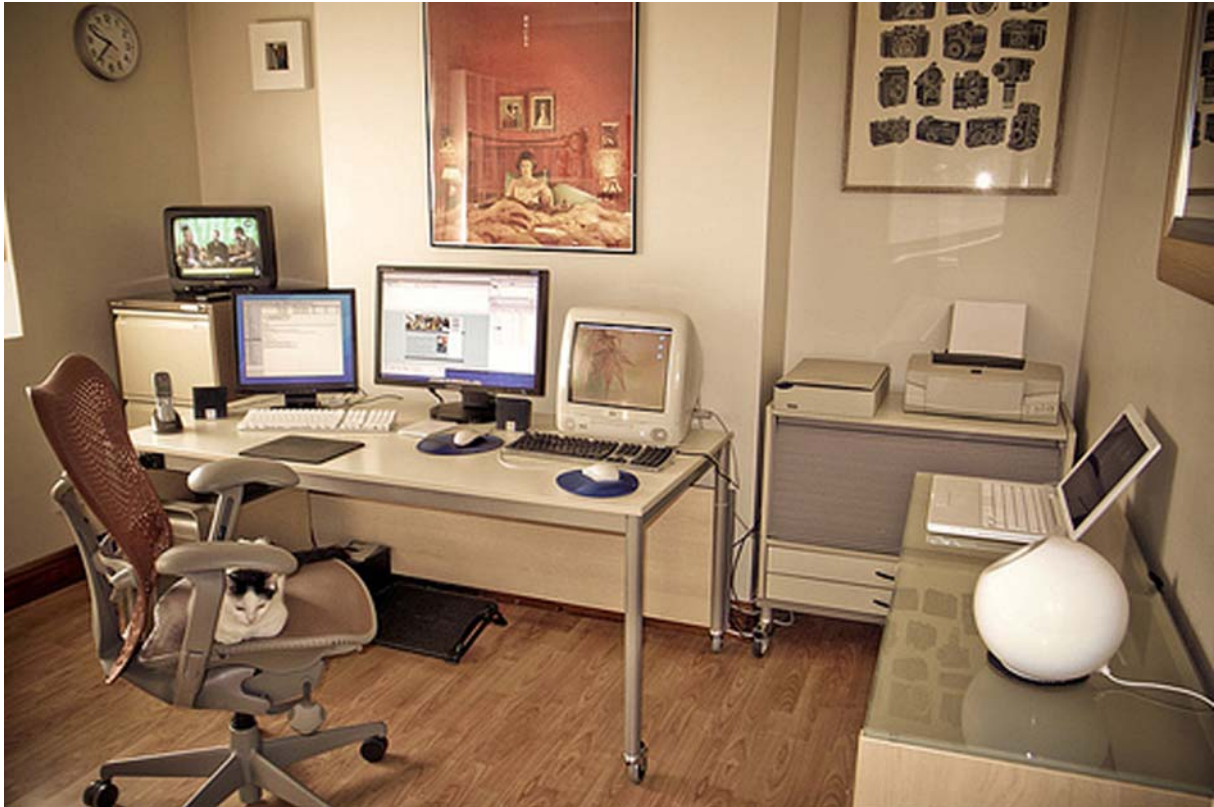
16. ábra. Nappali berendezésébe simuló több munkahelye home office rendszer- szinte fel sem tűnik, hogy ez egy komoly iroda 16