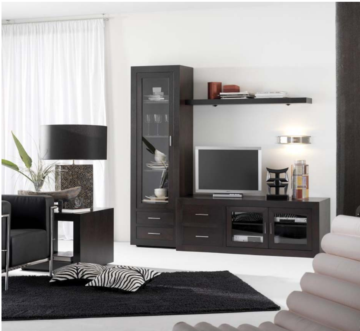
10. ábra. Alacsony, szellős nappali bútor 10