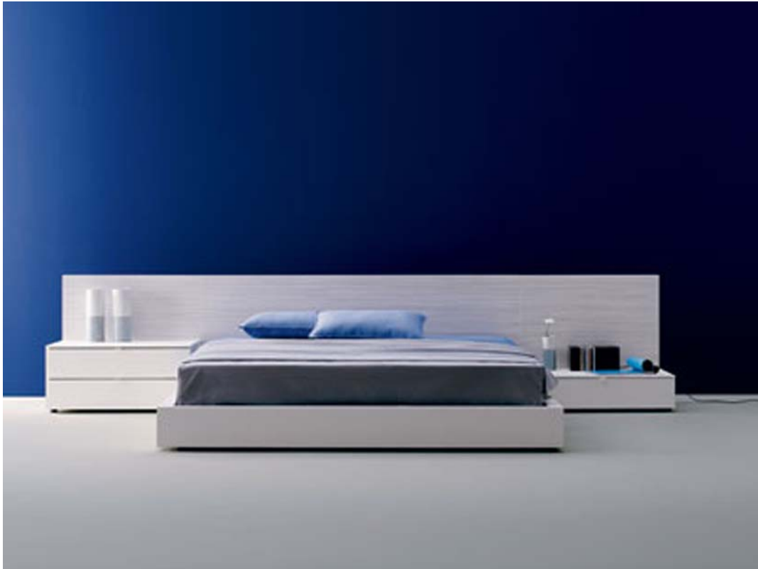
23. ábra. Legyen ingersezegény: minimál a hálószobában 23

Az ingermentes környezet ideális kívánalma ellenére mai világunkban gyakran kap helyet a hálószobában egy kisebb tévékészülék. A hálószoba berendezése és dekorációja nagyon sok mindentől függ, és ezek közül csak egy dolog az ízlés. A háló gyakran kényszerül a nappaliba, ami kétségtelenül kompromisszumokkal jár.