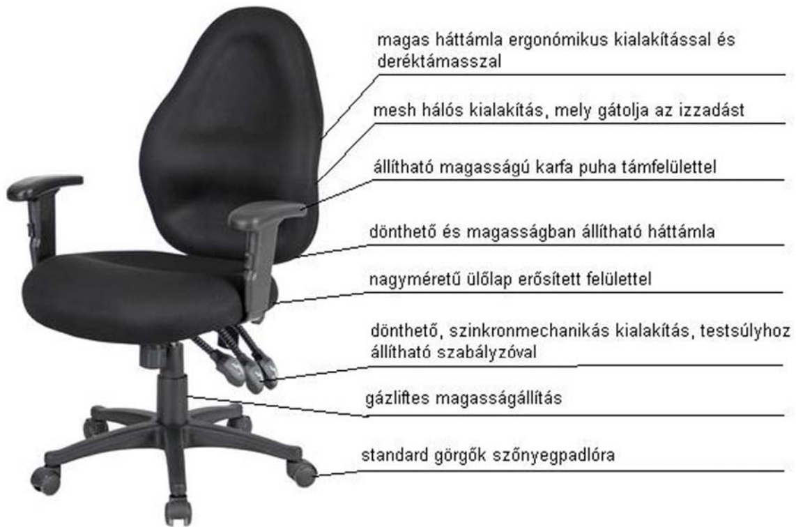
20. ábra. Nem elérhető: egy átlagos árú irodai szék technikai tudása 20