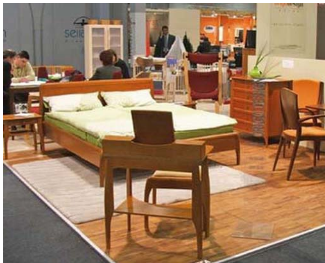
5. ábra. BNV Bútorvilág 5

4. feladat: A piac valamennyi szereplője számára fontos információszerzési lehetőséget nyújtanak a különböző szakmai kiállítások. Látogasson el a LOSZ (Lakberendezők Országos szövetsége) honlapjára és nézze meg a 2010. évi Budapesti Nemzetközi Vásáron készített "Trend-sziget videó és interjúk az enteriőrökről" című rövidfilmeket. Ezekből az interjúkból megismerheti a city- és a country-stílus értelmezését, jellemzőit! A rövidfilmek a "Lakberendezési ötletek Nem csak lakberendezőknek" link megnyitása után érhető el.