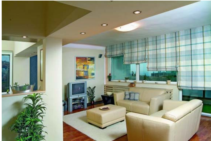
3. ábra. Az igényeknek megfelelő enteriőr 3