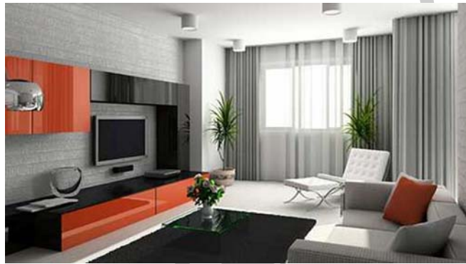
1. ábra. Nappali szoba 1