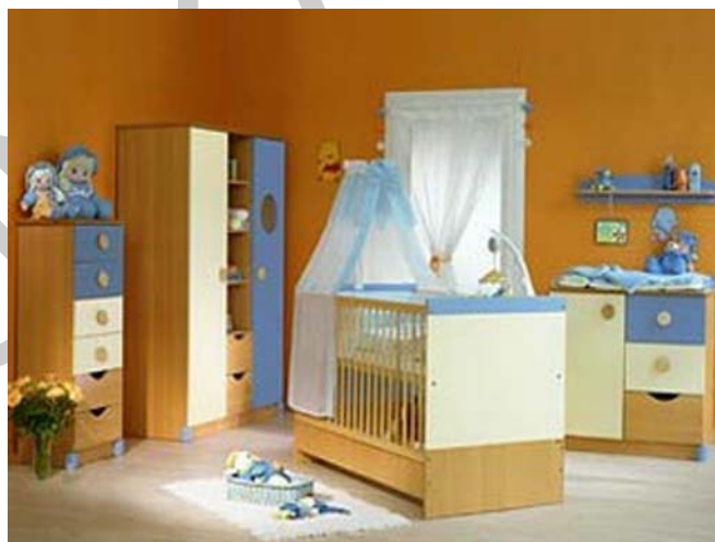
4. ábra. Gyermekszoba 4