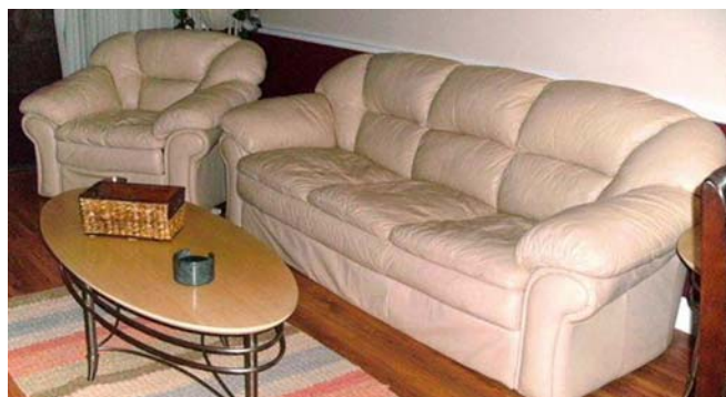
2. ábra. Ülőgarnitúra 2