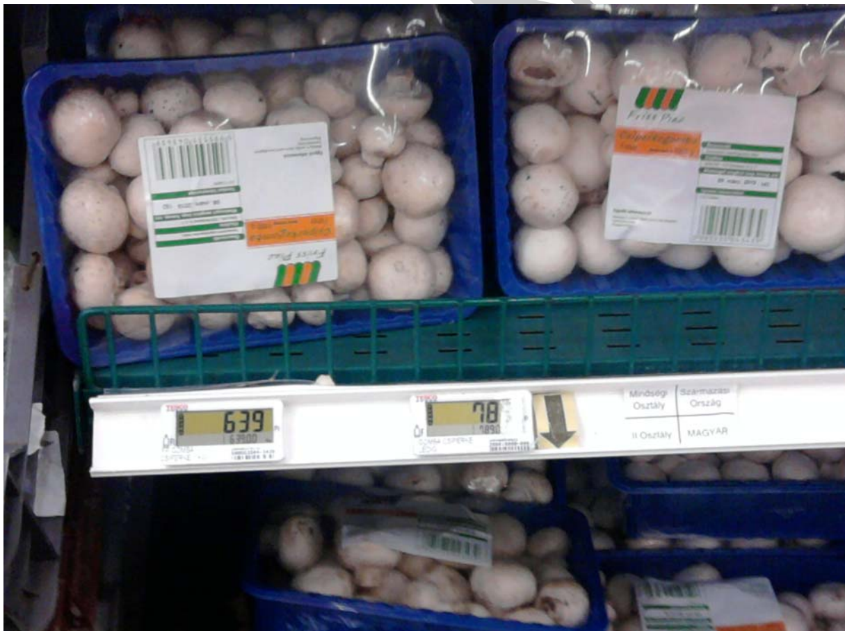
5. ábra: A gomba árának, származási helyének, minőségi osztályának feltüntetése