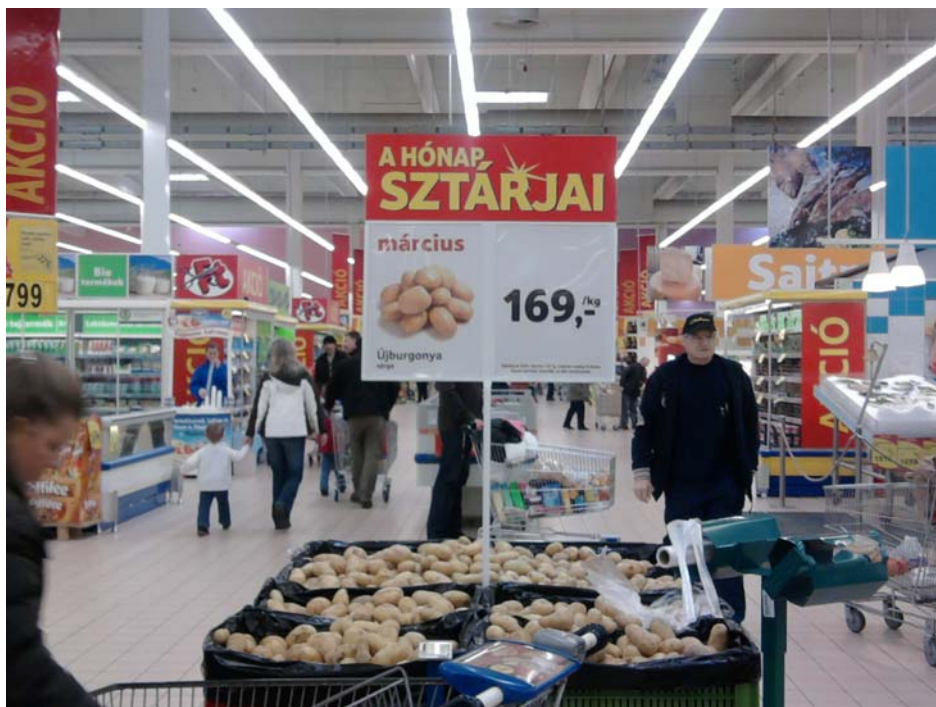
6. ábra: árfeltüntetés az akciós termék esetén

Értékelje az alábbi képet az árfeltüntetés szempontjából!