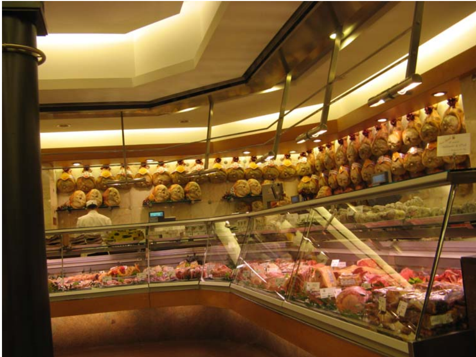
2. ábra A kereskedő köteles mindent megtenni az élelmiszerek biztonságossága érdekében: hűtőpultban tárolt húсарuk

A termék biztonságosságáról a gyártó köteles gondoskodni, de a forgalmazó sem forgalmazhat olyan terméket, amelyről tudja vagy a rendelkezésére álló tájékoztatás vagy szakmai ismeret alapján, tudnia kellene, hogy nem biztonságos. Sőt, olyan termékek esetében, amelyek biztonságosságát a forgalmazó tevékenysége befolyásolja (gondoljon az élelmiszerekre), a fogyasztóvédelmi törvény a forgalmazót is gyártónak tekinti 6 . Ez azért fontos, mert ha a fogyasztót a termék hibája miatt kár éri, akkor a gyártó felel. 7