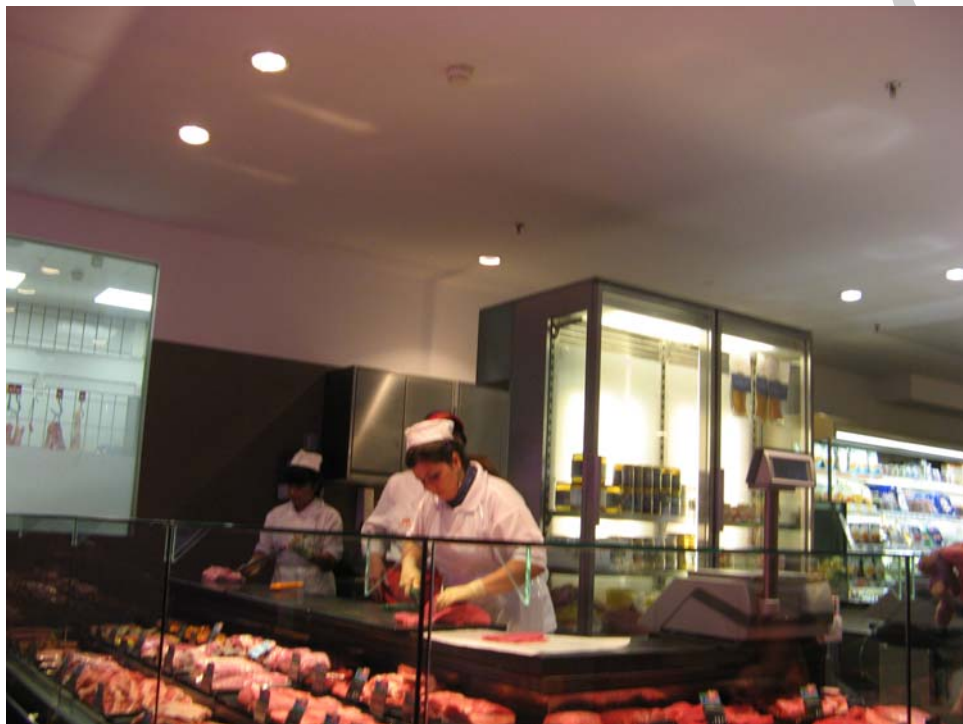
1. ábra: Hentespult

4. Az alábbi képen látható eladó öltözete, valamint az áruk elhelyezése a hűtőpultban, összefüggésben van-e – Ön szerint – a fogyasztói érdekek védelmével? Indokolja választát!