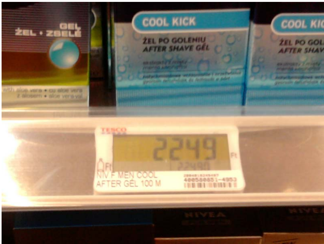
4. ábra Az árfeltüntetés új módja: elektronikus, digitális árfeltüntetés

A fogyasztók gazdasági érdekei a hibátlan pénztárosi munkát is megkövetelik. A termék árát pontosan kell bevinni a pénztárgépbe, a készpénzes fizetés esetén figyelni kell a precíz, pontos visszaadásra, a bankkártyával történő fizetés összes szabályát be kell tartani ugyanúgy, ahogy a készpénz nélküli fizetési módok esetén előírt eljárási szabályokat is. A számla- és nyugtaadási kötelezettséget minden kereskedelmi forma 12 esetén be kell tartani! (A részletes szabályokat más tananyagelemek tartalmazzák.)