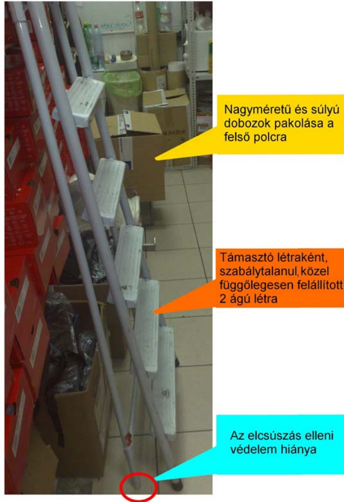
6. ábra. A baleset helyszíne