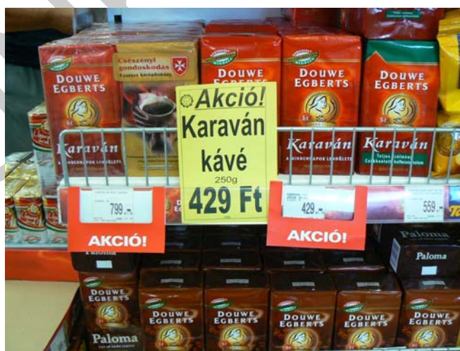
6. ábra. Akciós ár feltüntetése

Amennyiben a kereskedő akció keretében meghatározott termékeket kedvezményes áron kínál értékesítésre, ezen áruk esetében mind az akciós eladási, mind az akciós egységárat fel kell tüntetnie. (Az akciós egységár feltüntetésének kötelezettsége értelemszerűen nem vonatkozik azokra a termékekre, amelyek esetében a GM r. értelmében egyébként sem kell az egységárról tájékoztatást adni.). Önmagában az eladási ár és a kedvezmény mértékének feltüntetése (pl. „-70%”, „-5000 Ft”) nem fogadható el, ha nem szerepel számszerűen a ténylegesen fizetendő ár is, a lényeg ugyanis az, hogy ez utóbbiról tájékoztatást kapjon a fogyasztó.