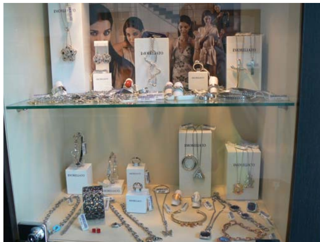
5. ábra. Kirakati árfeltüntetés