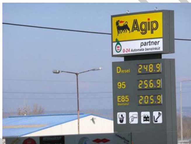
10. ábra. Üzemanyagtöltő állomás 6

C) Az alábbi képen helyesen tüntették-e fel az árakat az üzemanyagokkal kapcsolatosan?