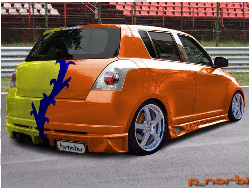
8. sz. ábra Reális szükséglet 19