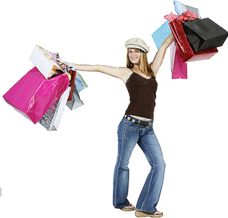
3. és 3.a. sz. ábrák Mi motiválja őket?