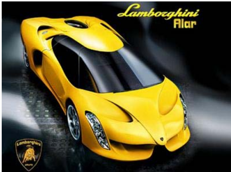
7. sz. ábra Vágyak 18

Természetesen egyéneként változó, hogy mit tekint váagnak, és mi számára a realitás. Bizonyára sokan vannak, akiknek realitás egy Lamborghini és sokan vannak olyanok is, akiknek egy Suzuki csak a vágyak kategóriájába fér bele.