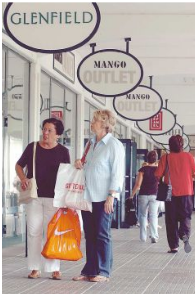
4. sz. ábra Kik a vásárlás résztvevői? 6

A vásárlás résztvevőiről általában többes számban beszélünk. Őket "vásárló központnak" vagy "Buying Centre"-nek is nevezik. Ők azok, akik az igény felmerülésétől a termék elfogyasztásáig részt vesznek a folyamatban. Később részletesen taglaljuk résztvevőiket a fogyasztói piacon a "Vásárlói szerepkörök" cím alatt, míg a szervezeti piacoknál a beszerzési központ cím alatt.