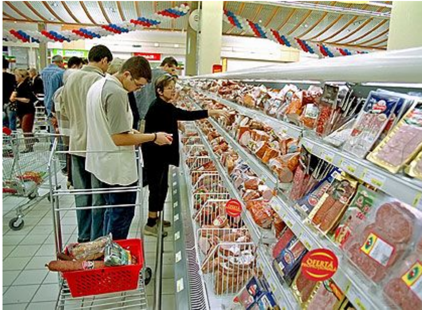
1. sz. ábra Kik a vásárlóink? 3