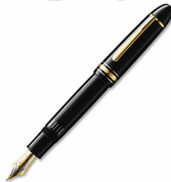
11. sz. ábra Mount Blanc toll