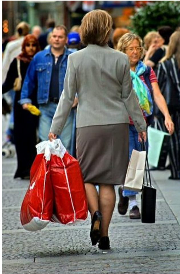
2. sz. kép Mit vásárolnak? 4

Ez lehet tárgyasult termék vagy szolgáltatás. ma gyakran értelmezik a terméket úgy, mint a termék ígérete, pl. egy arckrém a fiatalságot és szépséget ígéri, vagy egy exkluzív autó a státusz ígéréssel, társadalmi elismerés érzésével bír. A termékek körét a vállalkozás termékpolitikájában határozhatja meg.