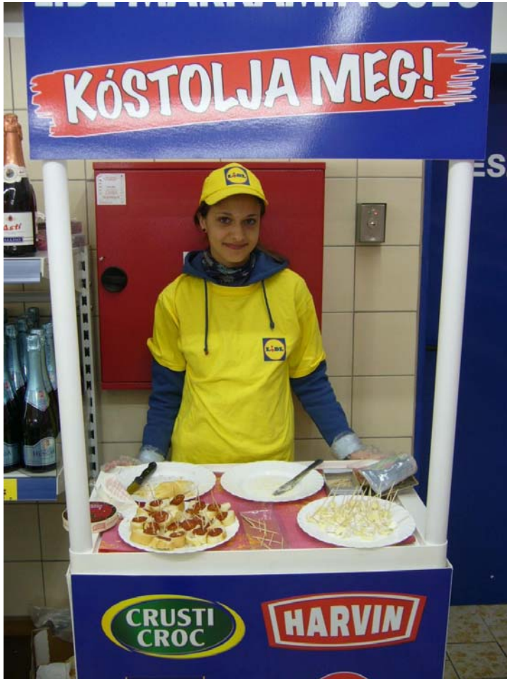
5. sz. ábra Kóstoltatás, impulzív vásárlás 8