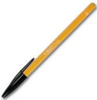
10. sz. ábra Eldobható toll