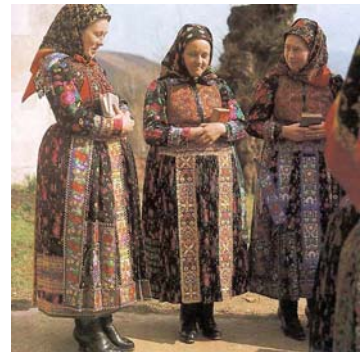
6.a.b.c. sz ábra Szubkultúra 11

11 6.a. http://z.about.com/d/diyfashion/1/0/Z/G/-/-/Punk_Hair.jpg