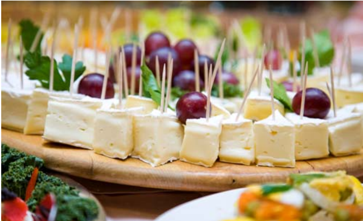
9. sz. ábra Az impulzív vásárlás egyik oka: kóstolók 20